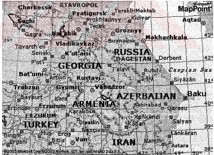
Harita 1.1: Kafkasya Bölgesi Haritası

Zengezur bölgesi sorununu anlatırken bölgenin yerini anlatmanın en iyi yolunun haritada göstermek olduğunu düşündük. Bunun nedeni yeri görüldüğünde, sorunun neden kaynaklandığını açıkça ortaya koymasıdır.