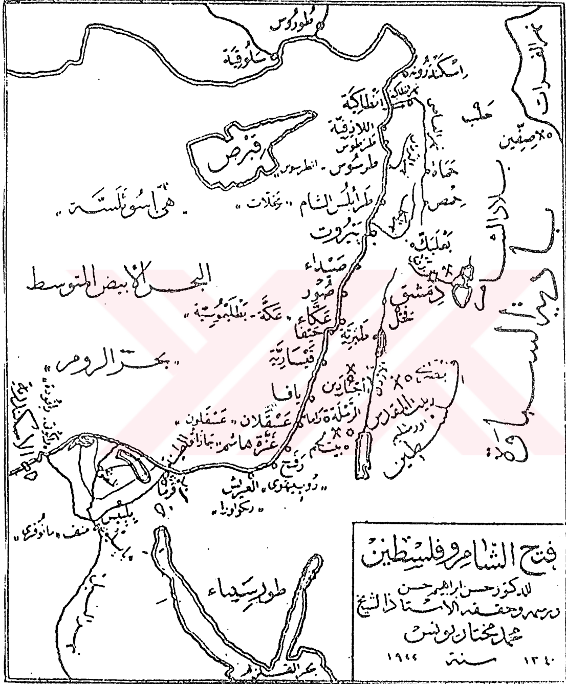
2. Amr b. el-Âs'ın Komutan Olarak İştirak Ettiği Şam Bölgesinde Fethedilen Topraklar. HASAN, Hasan İbrahim, Tarihu Amr b. el-Âs , Mısır 1996, s. 67