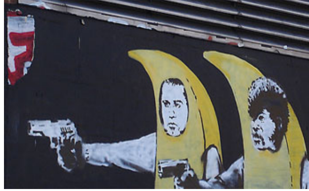
Resim 7: ( http://www.artbanksy.com/famous-artworks.html : e.t. 26.08.2018)