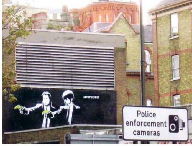
Resim 6: (Banksy, 2005: 105)