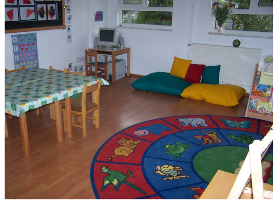
Resim-10. Bir sınıfın görünümü