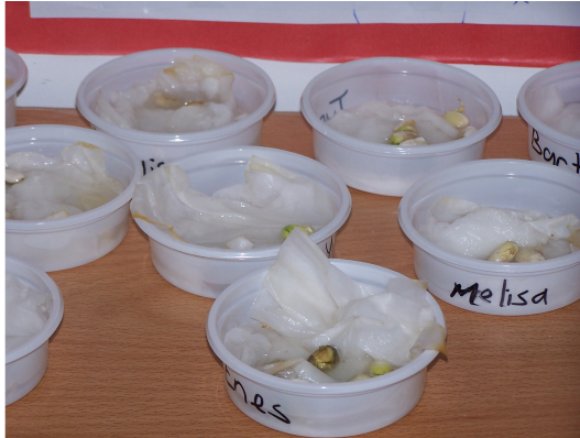
Resim-11. Bir sınıfta öğrencilerin yaptığı fasulye çimlendirmesi