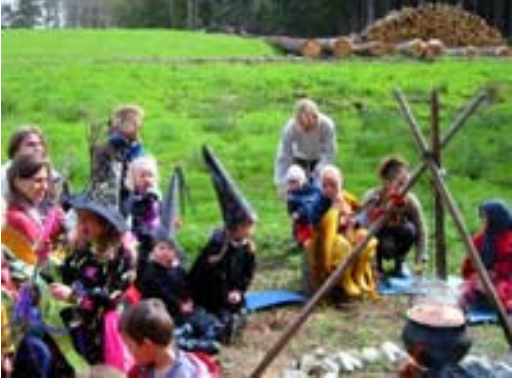
Resim-5. Açık havada pişirilen yemeğin çevresinde çocuklar.