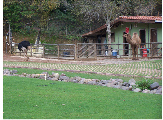
Resim-4. Okul ağılında yaşayan deve ve devekuşu