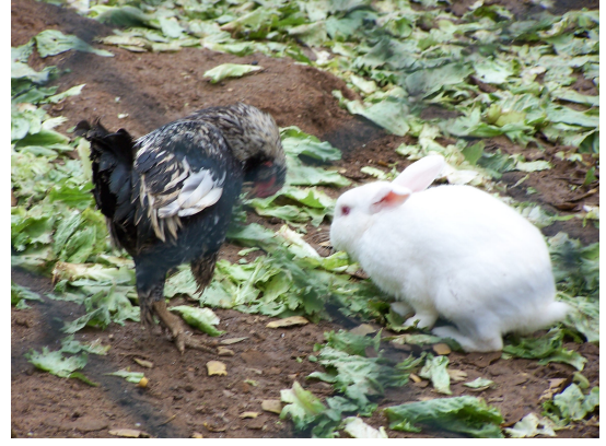
Resim-6. Okul bahçesindeki kümeste yaşayan tavuk ve tavşan