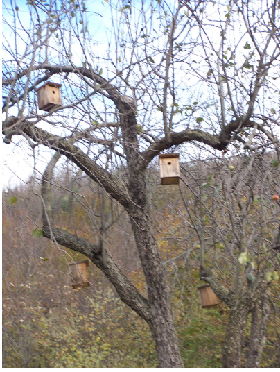
Resim-1. Okul bahçesinde kuşlar için hazırlanmış olan yuvalar