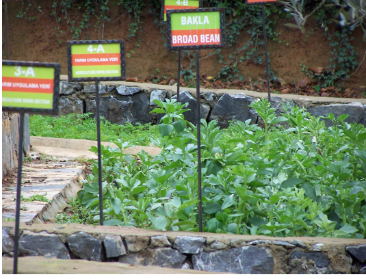
Resim-5. Sınıflara göre ayrılmış tarım uygulama alanları