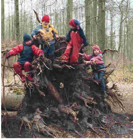
Resim-7. Devrilmiş bir ağacın köküne tırmanarak oynayan çocuklar