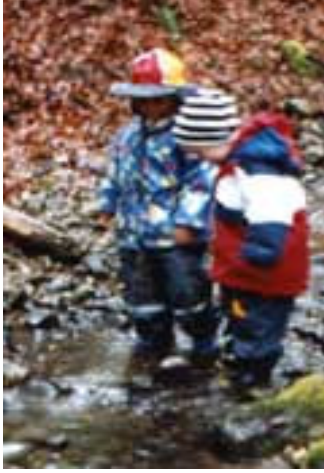
Resim-1. Ormanda çamurla oynayan çocuklar