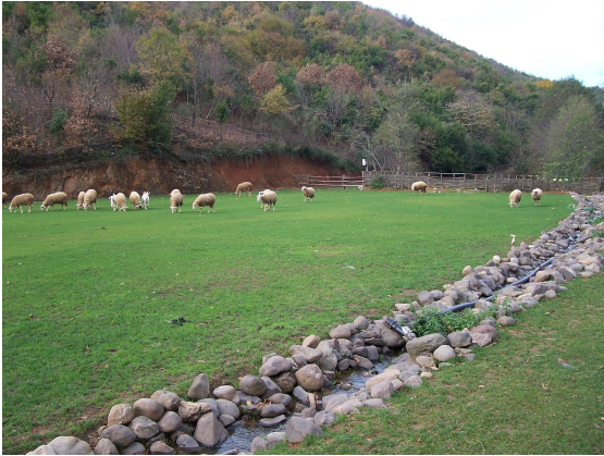
Resim-3. Okul bahçesindeki ağılda bulunan koyunlar