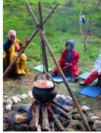
Resim-6. Kamp ateşinde pişen yemek