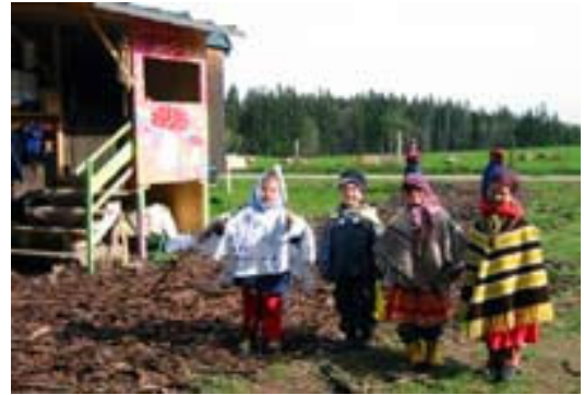
Resim-4. Fırtına Kulübesinin çevresinde oynayan çocuklar