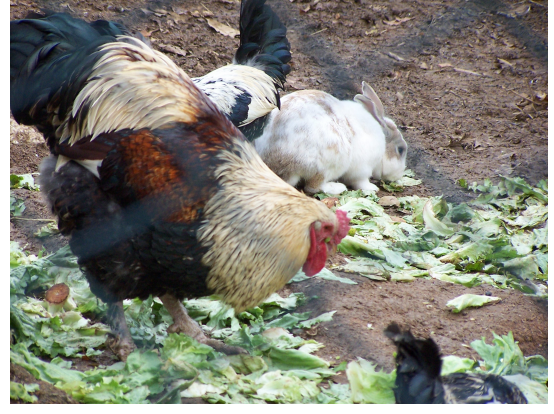
Resim-8. Kümesin diğer sakinlerinden horoz ve tavşan