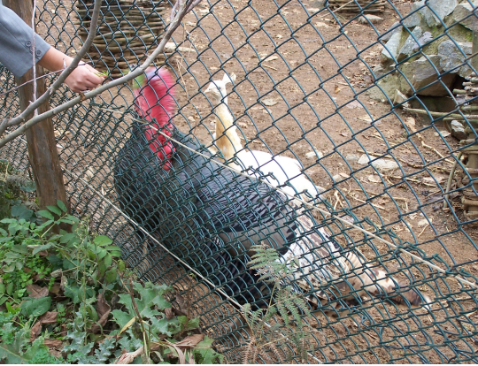
Resim-7. Okul bahçesindeki kümeste yaşayan hindi ve albino tavus kuşu