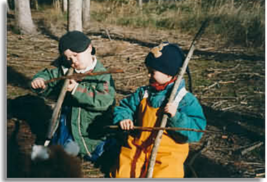
Resim-2. Ormandan topladıkları dalları oyunlarında viyolonsel ve keman olarak kullanan çocuklar