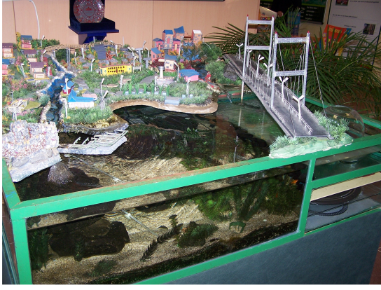
Resim-9. Okul binasının girişinde bulunan Boğaziçi maketi ve akvaryum