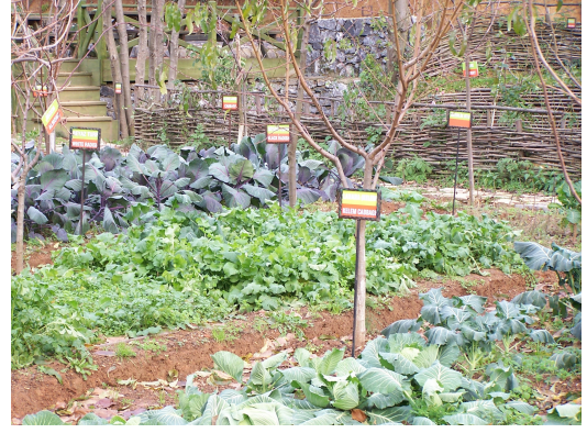
Resim-2. Çocuklar ile birlikte yetiştirilen sebze tarlaları