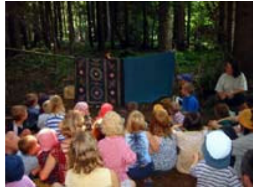
Resim-8. Orman içinde kukla gösterisi seyreden çocuklar.