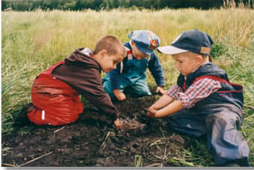
Resim-3. Toprakla oynayan çocuklar