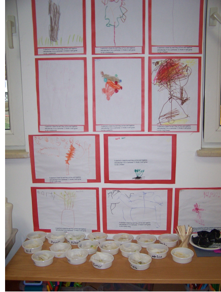
Resim-12. Çimlendirilen fasulyelerin büyüdülerinde neye benzeyeceklerine dair çocukların çizdiği resimler ve fasulyeler.