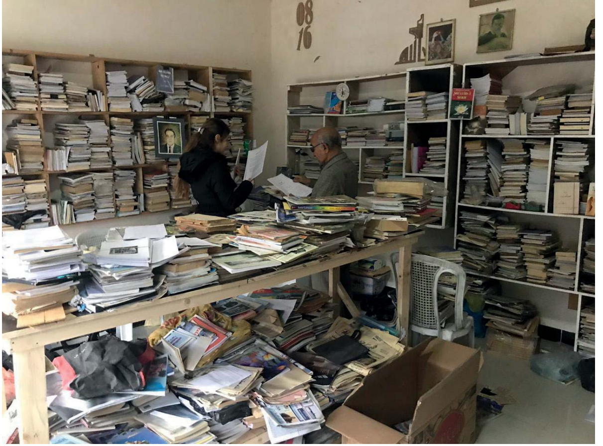
(Irak- Kerkük Türkmen Kütüphanesi)