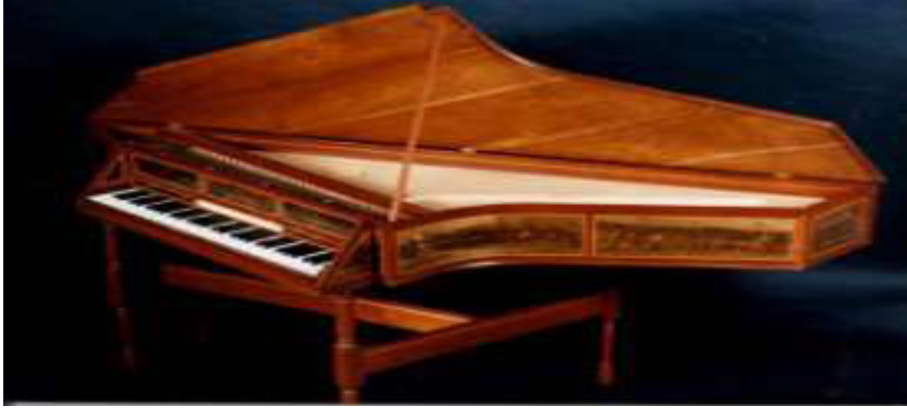
Resim 1. Spinet ( www.users.erols.com/cembalo/spinet1.htm )

Günümüzde ses alanı 7,5 oktav ve 88 tuştan oluşan standart piyanolar yapılmaktadır. (Feridunoğlu, 2004: 204). Konsol bir piyanoda ortalama 230 telin toplam ağırlığı on sekiz ton, kuyruklu piyanoların ise yirmi yedi tondur (Reblitz, 1993:23)