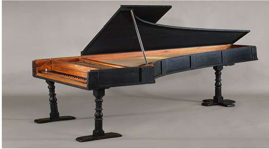
Resim 5. Bartolomeo Cristofori: gravicembalo col piano forte ( http://www.metmuseum.org/toah/images/h2/h2_89.4.1219.jpg )

( http://formation.paris.iufm.fr/archiv_05/pastant/Sites/images/instruments/acorde/clavecim.jpg )