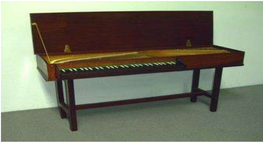
Resim 3. Klavikord ( www-rawbw.com/hbv/earlymus/instrument.html )