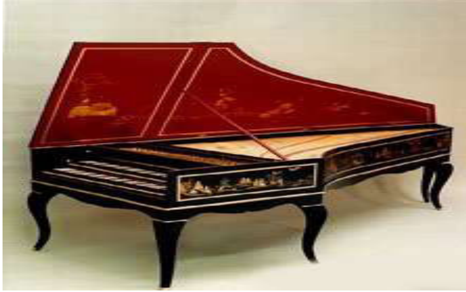
Resim 4. Klavsen

( http://formation.paris.iufm.fr/archiv_05/pastant/Sites/images/instruments/acorde/clavecim.jpg )