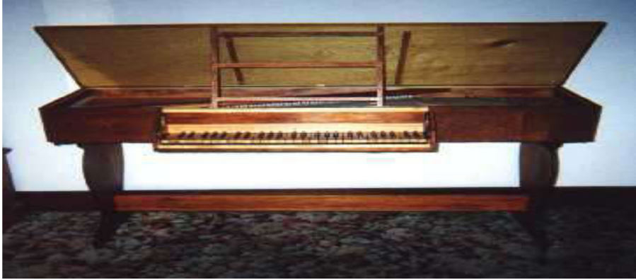
Resim 2. Virginal