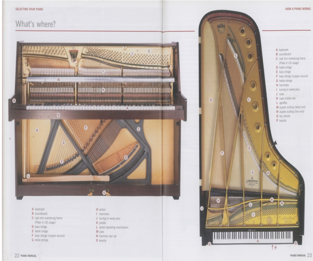
Resim 6. Piyanonun İç Mekanizması (Bishop ve Barker, 2009)

Piyano, Avrupa’da bütün bu gelişimlerini yaşarken, ülkemizde ilk defa Tanzimat (1839-1876) döneminde tanınmaya başlanmıştır (Köseihal, 1939:93). Osmanlı’da Batı müziği ekolünü başlatan Giuseppe Donizetti (1828-1856), II. Mahmut devrinde askeri bandoyu yetiştirmek amacıyla davet edilmiş, Muzıka-ı Hümayun adı altında birçok müzik okulunu barındıracak ilk saray konservatuarını kurmuştur (Baydar, 2010:9). 1827 [bazı kaynaklara göre 1828] yılında saraya gelen Donizetti Paşa, sarayda ilk piyano derslerini vermiştir. Abdülhamit devrinin son yıllarında dersleri ile hizmet görmüş olan Aranda Paşa, sarayın ilk ustaca piyanistidir. Piyanistlerin en ileri seviyelerini sarayda dinlemek imkânı Tanzimatla açılmıştır (Fenmen, 1947:136-137). 1846 [bazı kaynaklara göre 1847] yılında İstanbul’a gelen Franz Liszt (1811-1886), Sultan Abdülmecit’in huzurunda konser vermiştir (Köseihal, 1939:127). Franz Liszt İstanbul’da dört piyano resitali vermiş, büyük olasılıkla aynı programı yinelemiştir (Yener, 1990:10).