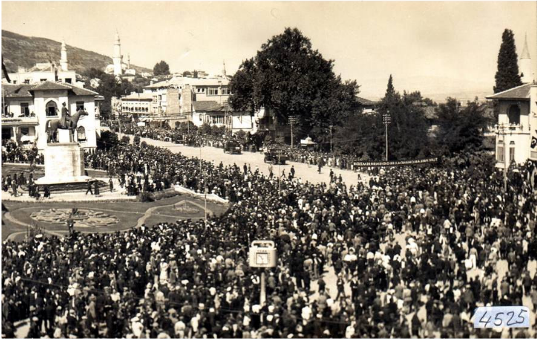
Atatürk Caddesi'nde Cumhuriyet Bayramı Töreni - 1937