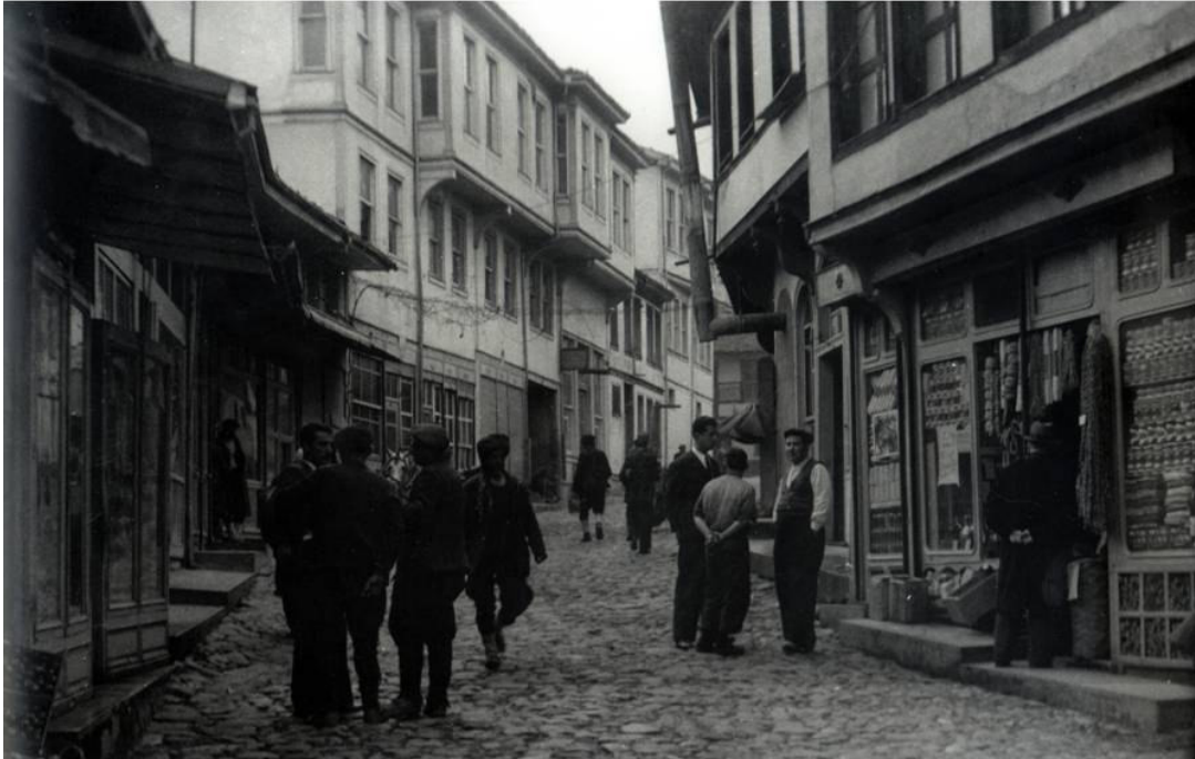
* Maksem Caddesi -1938