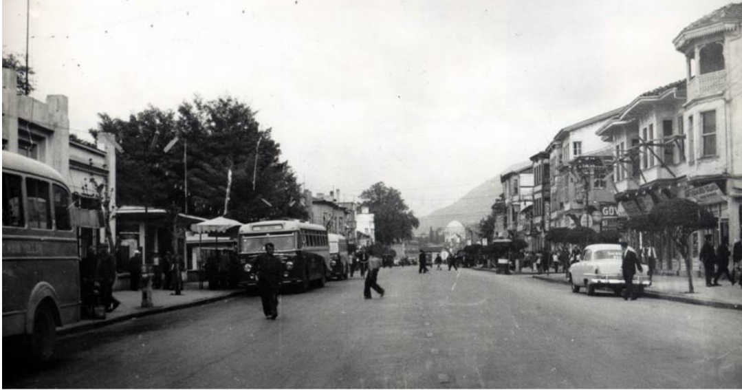
* Atatürk Caddesi –1940