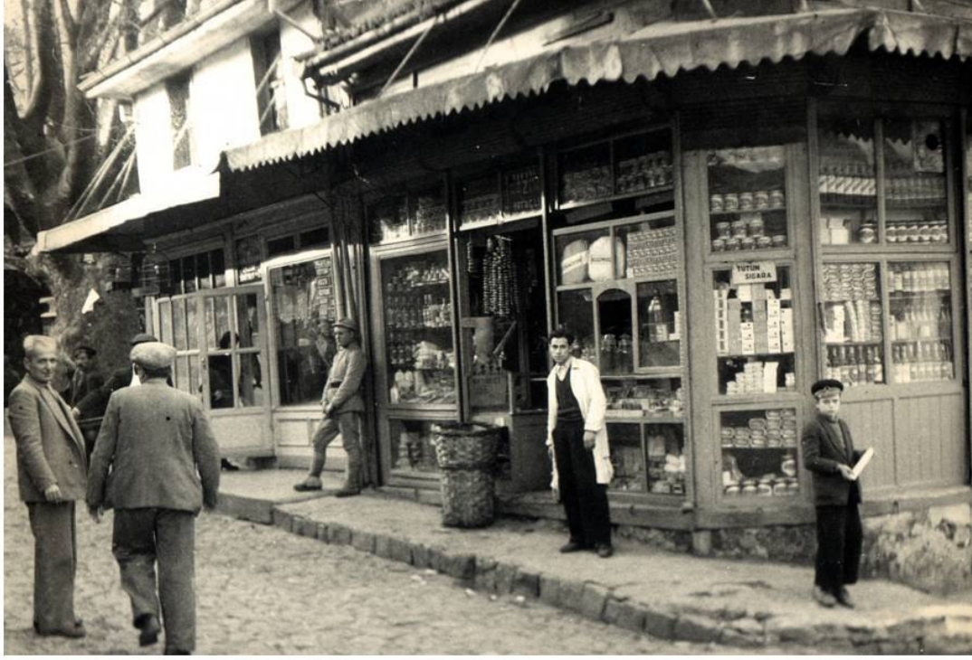
* Bakkal Dükkanı - Tahtakale -1938