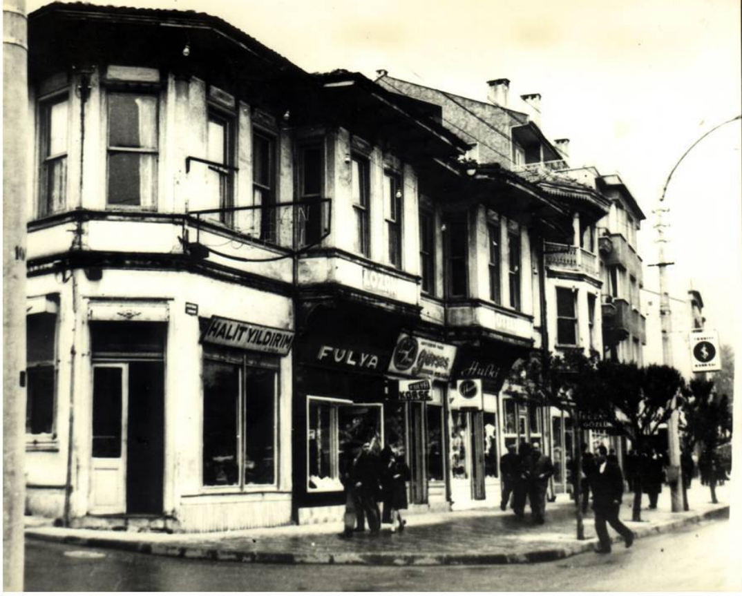
* Atatürk Caddesi—1937