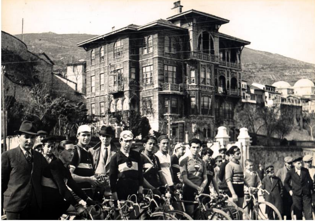
* Halkevi'nin Düzenlediği Bisiklet Yarışması - 1940