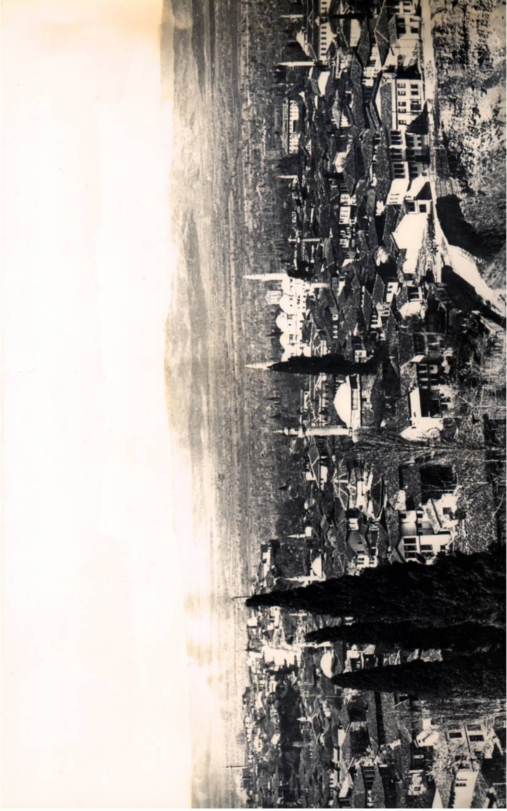
* Bursa'nın Temenyeri'nden Görünüşü - 1930