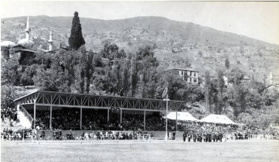
* Atatürk Stadyumu - 1937