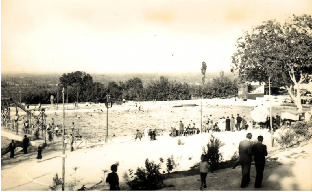
* Havuzlupark - 1935