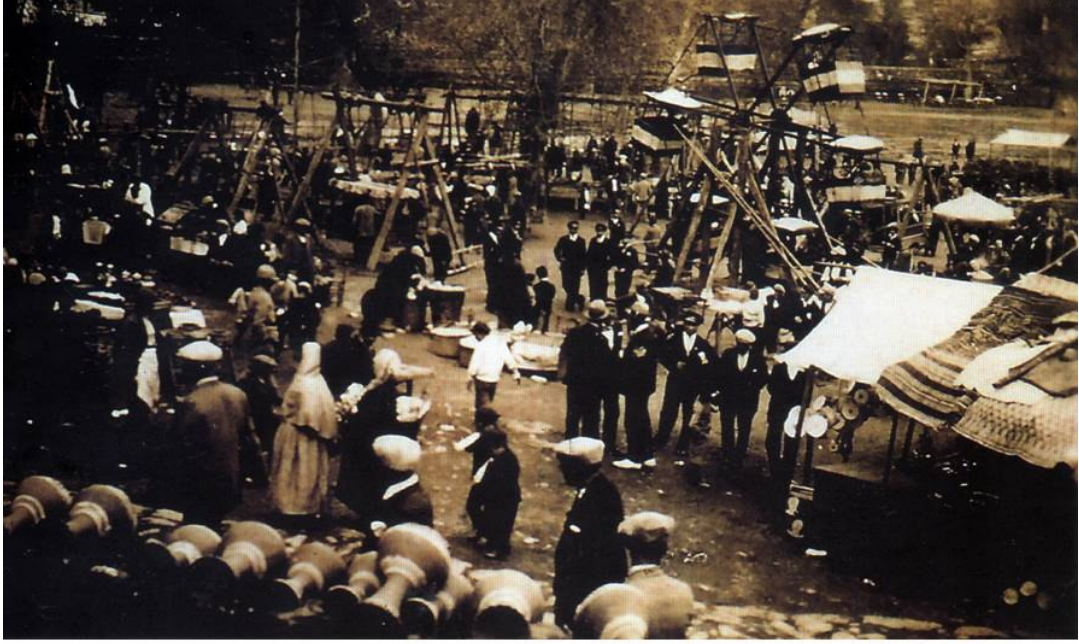
* Pınarbaşı Eğlenceleri –1932 (Anılarda Molla Gürani Mahallesi Kitabından Alınmıştır)