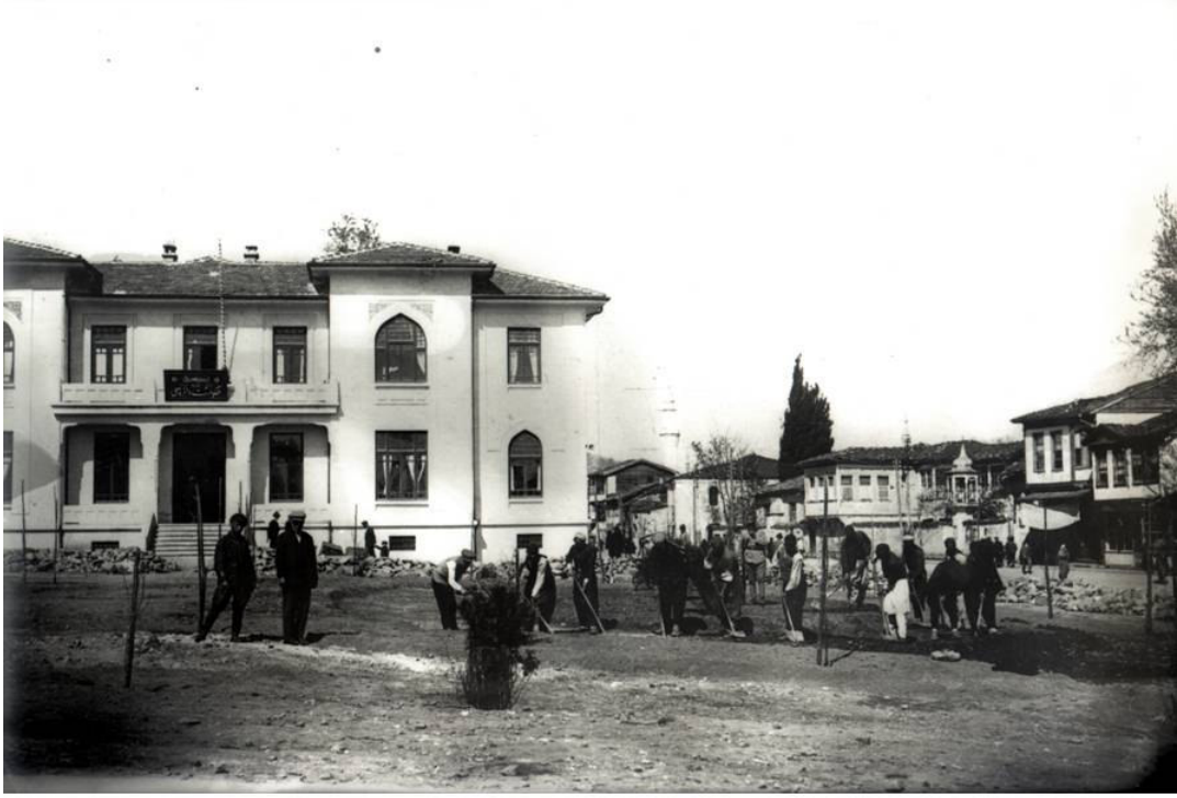
* Cumhuriyet Meydanı Atatürk Heykeli Yapılmadan Önce –1926