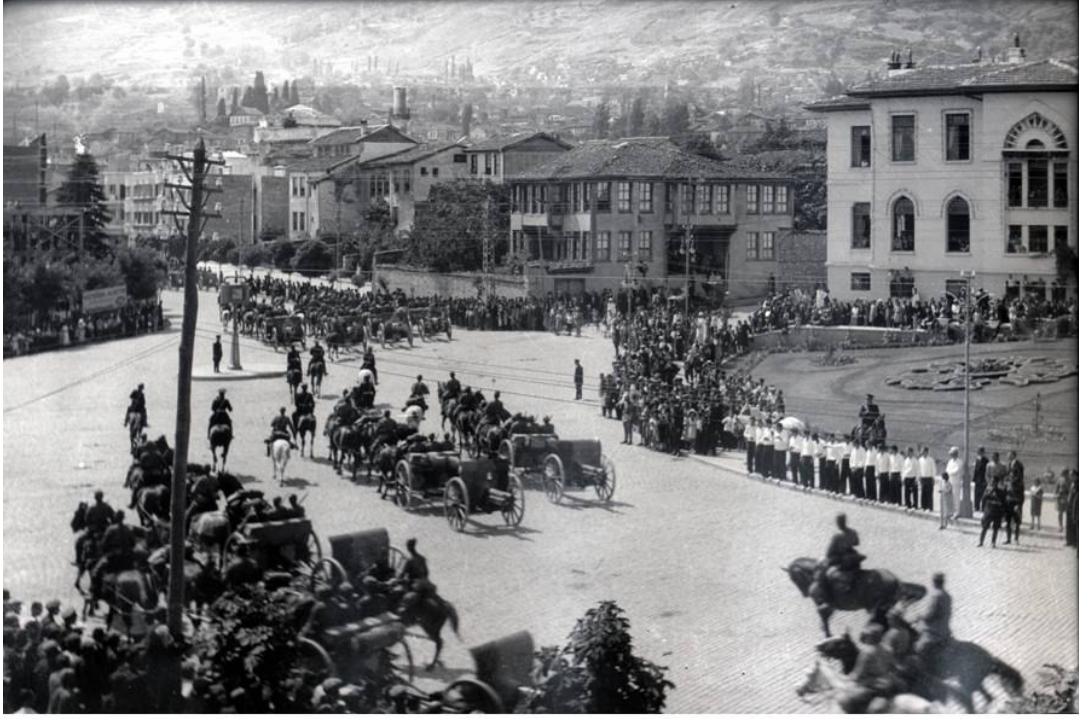
* Resmi Geçit Töreni –1937