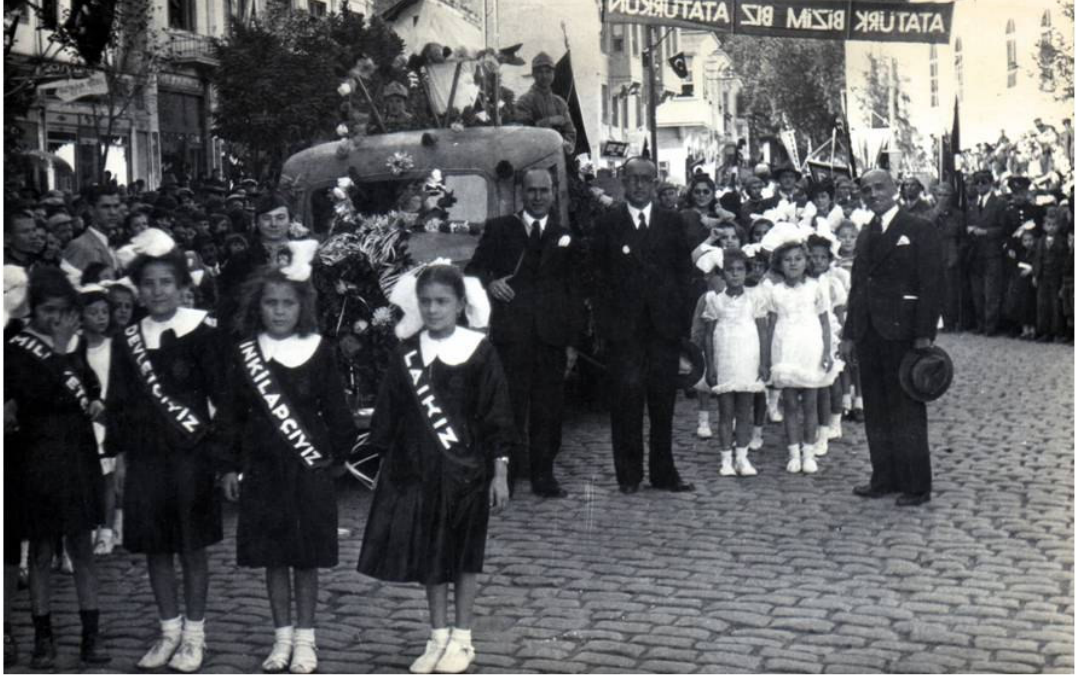
* Cumhuriyet Bayramı Kutlaması ve İlkokul Öğrencileri –1935