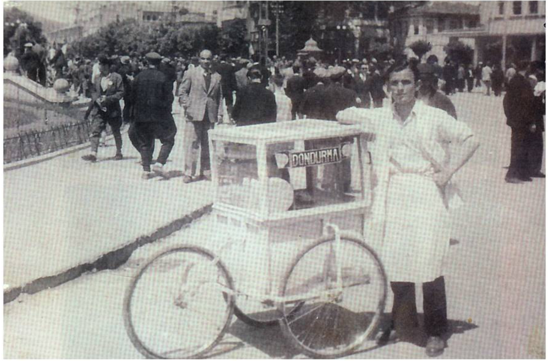
* Dondurmacı –1945 (Anılarda Kavaklı Mahallesi Kitabından Alınmıştır)