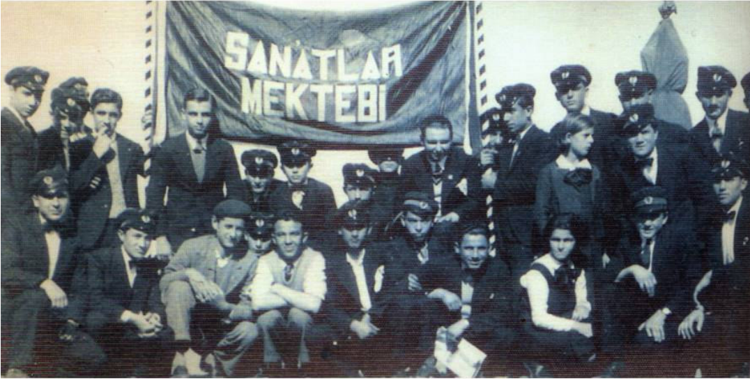
* Resmî Geçit Sonrası Erkek Sanat Enstitüsü Öğrencileri –1940