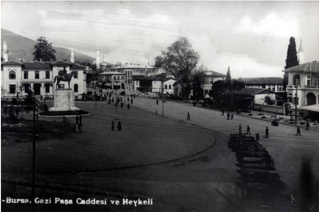
* Cumhuriyet Meydanı –1936