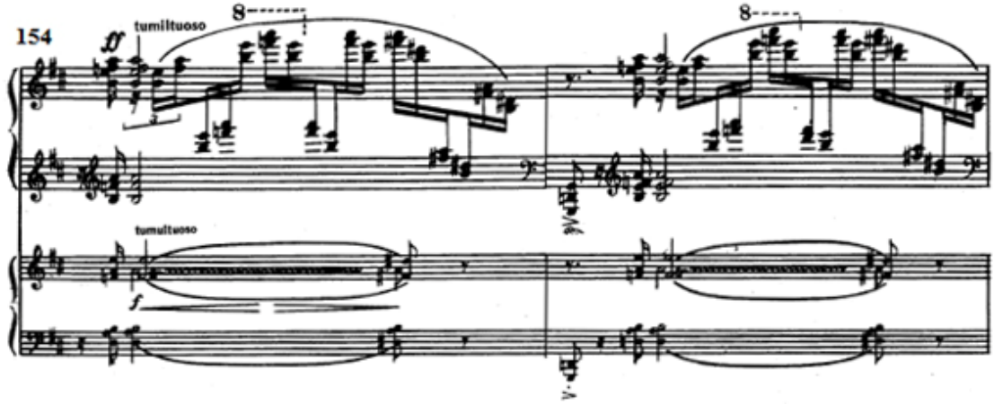
Şekil 11: Giriş motifinin tekrar piyanoda duyulması (Ölçü 154-155)

135. ölçüde orkestradan C1 temasının başının duyulmasıyla köprü başlar. Piyano da virtüözük pasajlarla eşlik eder. Orkestrada 139. ölçüde A1 teması, 141. ölçüde ise A2 teması duyulur. Bu ölçülerde tempo sık sık değişime uğramıştır. 145. ölçüde A1 teması piyanonun sol elinde ortaya çıkar. Modülasyonların ardından 147. ölçüde do diyez majör kadans ile A2 teması tekrar orkestradan duyulur. Orkestra A2 temasını çalmaya devam ederken, piyanodan da farklı ritim kalıplarıyla A2 teması re majör tonalitesinde duyulur. Şekil 11’de görülen 154. ölçüde, konçertonun girişindeki motif dört ölçü boyunca yalancı röpriz olarak duyulur ve ardından re majör tonalitesinde, A2 temasından alınmış motiflerden oluşan serim bölümünün görkemli koda başlar.