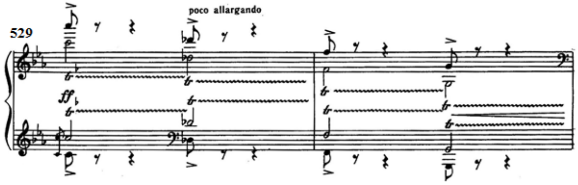
Şekil 24: Gelişmenin sonundaki giriş motifi (Ölçü 529-530)

Tablo 5’te gelişme bölümünün genel görünüşü gösterilmektedir.