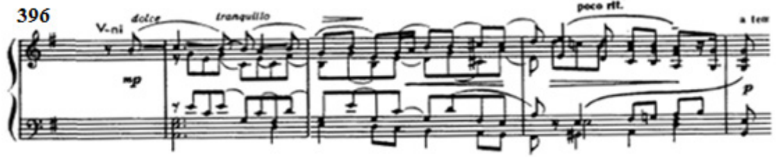
Şekil 19: İkinci bölmedeki 5. varyasyonun orkestra girişi (Ölçü 396-400)

406-409. ölçülerde B1 teması piyanoda sol elde sekizliklerle duyulurken, sağ elde de farklı bir ritmik yapıda duyulur. Şekil 20'de görülen bu ritmik yapıdaki B1 temasıyla ileriki varyasyonlarda da karşılaşılacaktır.