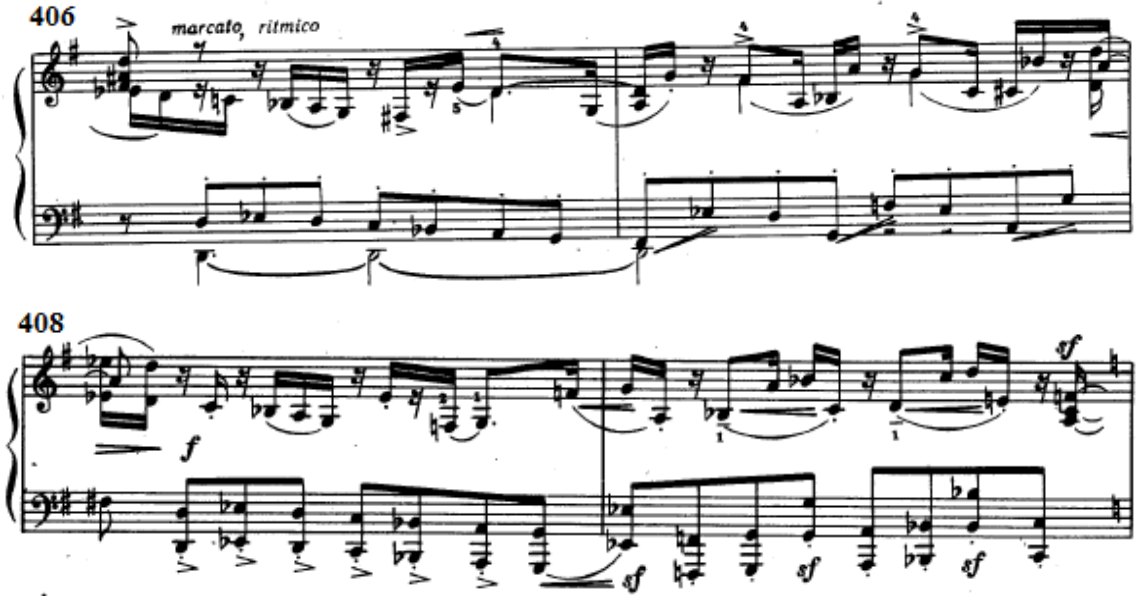
Şekil 20: 5. varyasyondaki B1 temasının ritmik yapısı (Ölçü 406-409)

406-409. ölçülerde B1 teması piyanoda sol elde sekizliklerle duyulurken, sağ elde de farklı bir ritmik yapıda duyulur. Şekil 20'de görülen bu ritmik yapıdaki B1 temasıyla ileriki varyasyonlarda da karşılaşılacaktır.