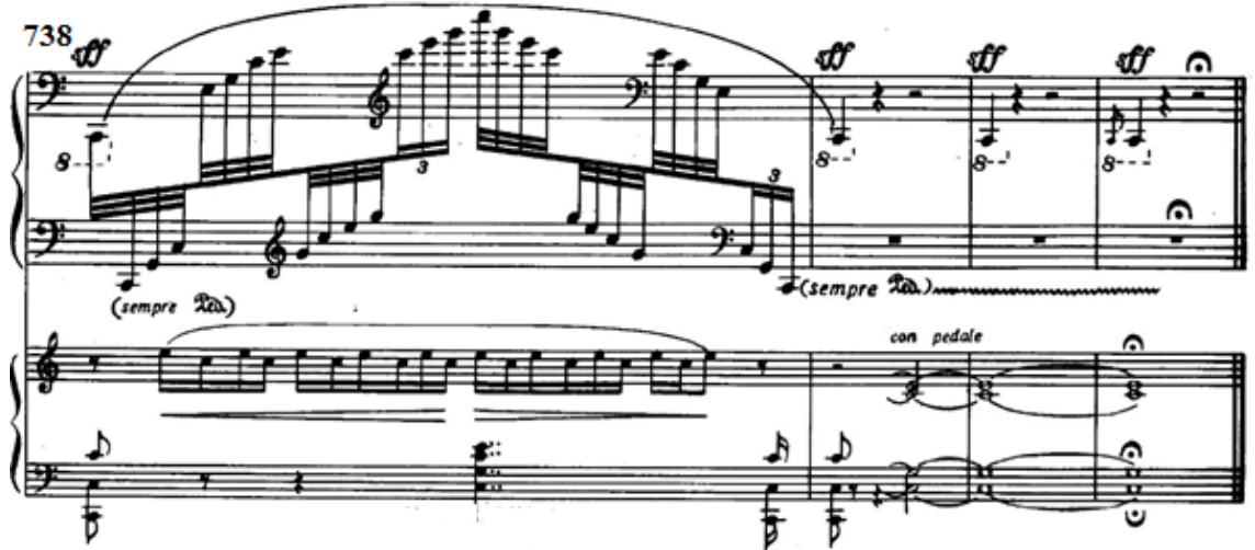
Şekil 30: Konçertonun kapanışı (Ölçü 738-741)

Tablo 6’da koda’nın genel görünüşü gösterilmektedir.