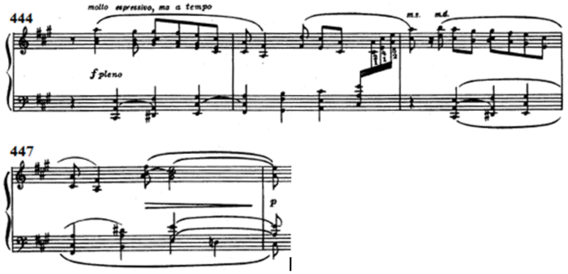
Şekil 22: İkinci bölmedeki 7. varyasyonun girişi (Ölçü 444-447)

8. varyasyon (459.-530. ölçüler), mi bemol majör tonalitesinde dokuz ölçülük orkestranın girişi ile başlar, diğer varyasyonlara göre daha uzundur. Orkestra tarafından seslendirilen ilk tema C2, ardından da A2 temasıdır. Orkestranın solosunun ardından C2 teması dört ölçü piyanodan duyulur. 472. ölçüde orkestradan re bemol majör tonalitesinde duyulan temanın ardından yine piyanoya geçen tema, genişletilmiş hali ile devam eder. Burada tema bir orkestraya bir piyanoya geçtiği için piyano ve orkestra diyalog halindedir. 479. ölçüde orkestra piyanoya A2 teması ile katılır. 486. ölçüde piyano orkestraya güçlü ve kromatik oktavlarla eşlik eder. Bu oktavlı pasajın ikinci gelişinin ardından, piyanodan sol elde yine oktavlarla A2 teması duyulur. B2 temasının başının orkestra ve piyano arasındaki atışmasının ardından, 495. ölçüde sol elde oktavlarla A2 teması duyulurken, sağ elde yine B2 teması duyulmaktadır. 499. ölçünün sonunda B2 temasından kesitler, Şekil 23'te görüldüğü gibi orkestra ve piyanodan genişletilmiş ve kanon halinde duyulmaya başlar. Orkestra ve piyanonun kanonu 505. ölçünün sonuna kadar devam eder.