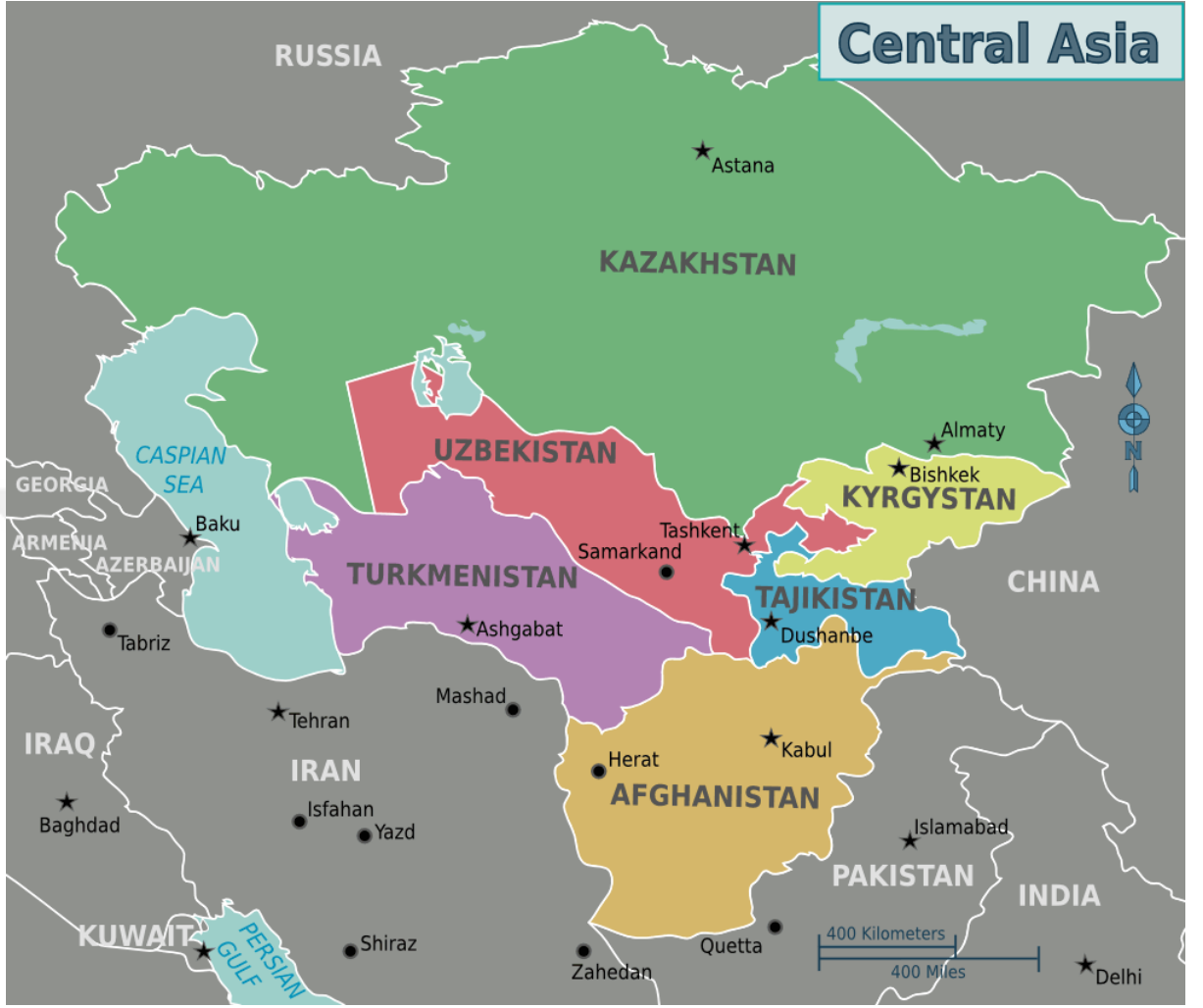
Harita 1. Orta Asya Ülkeleri