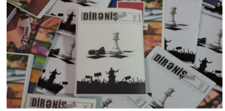
AMDT’nin yayınladığı kitapça