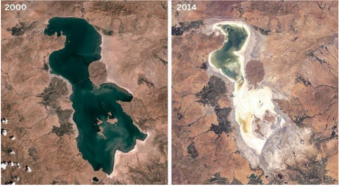
Urmu gölü'nün kuruması haritası