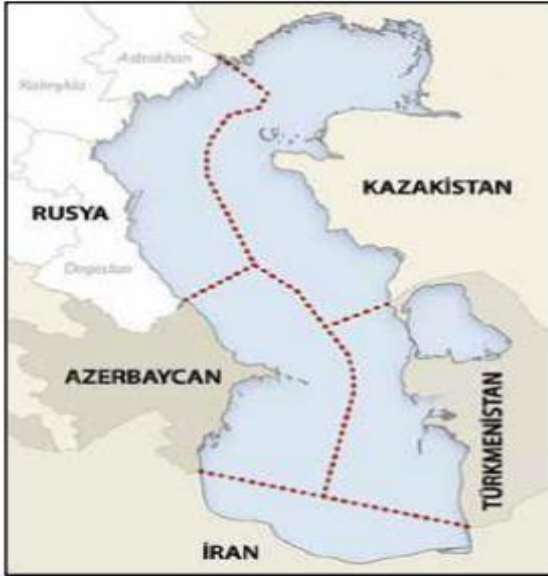
Şekil.1: Sınır Gölü Senaryosu (Coffey, 2015: 16).

İran'daki Türklerin toplu halde yaşadığı bölgeler (rakamlar tahminidir)