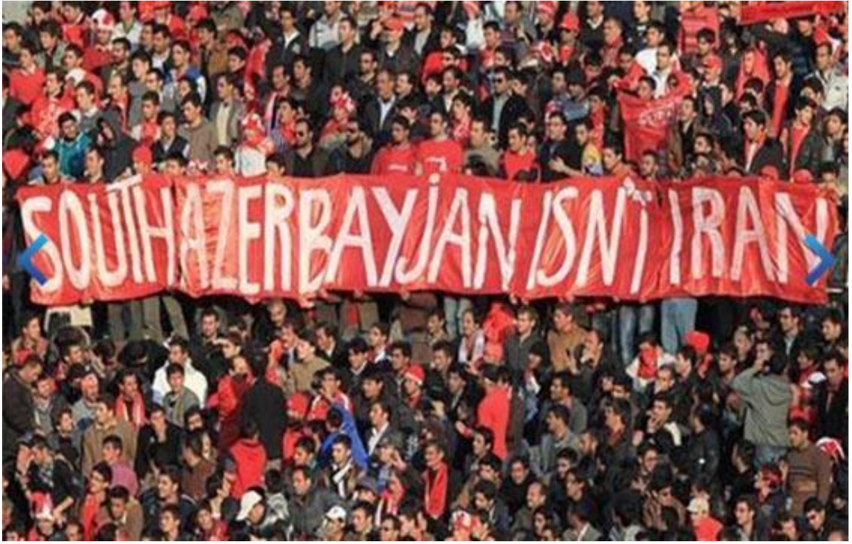
TraktorSazi Futbol Kulübü taraftarlarının açtıkları pankart