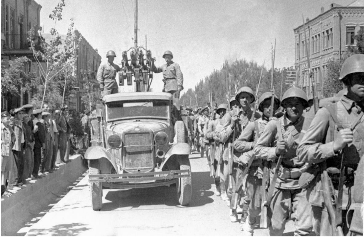
Sovyet askerlerinin Tebriz'e girişi