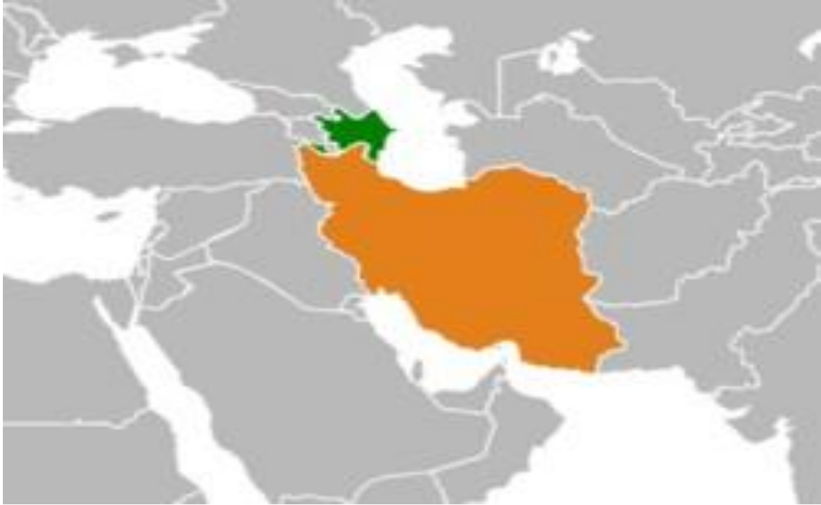
İran ve Azerbaycan haritası

file:///C:/Users/KSL8/Downloads/Bulletin%20PISM%20no%20116%20(1187)%2027%20August%202018.pdf