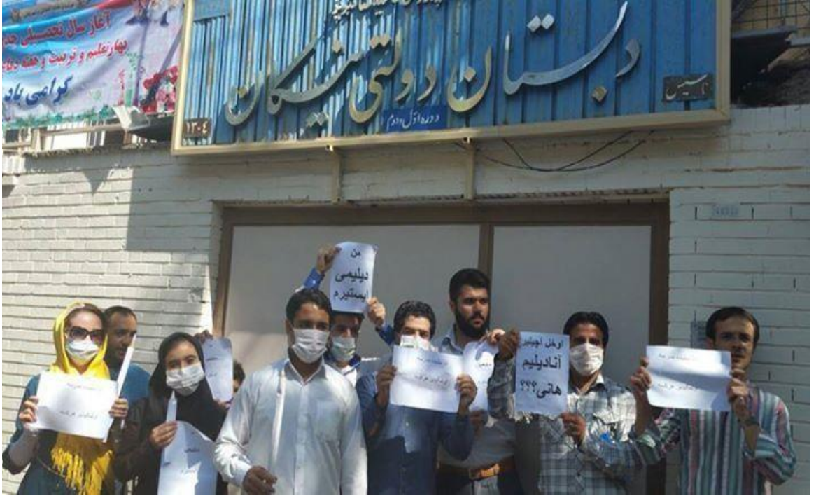
Okul karşısında 'Ben dilimi istiyorum' ve diğer yazıları tutmuş İran Türkleri