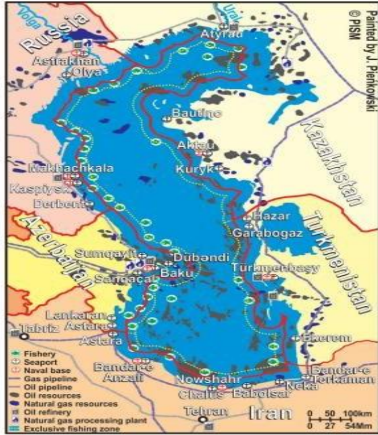
Hazar'ın enerji kaynaklarının haritası