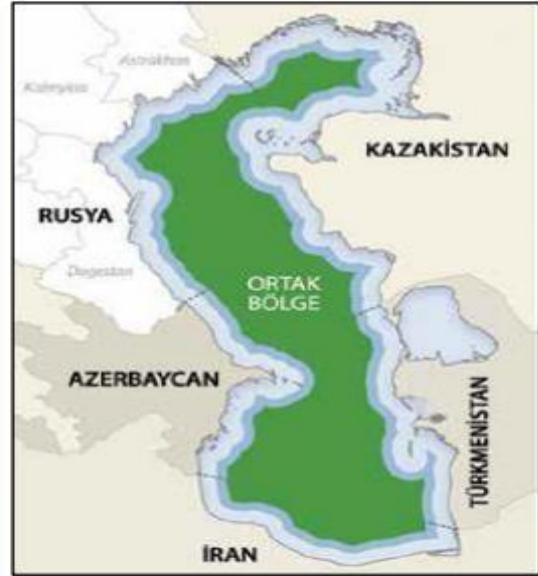
Şekil.2: Ortak Kullanım Senaryosu (Coffey, 2015: 16)

Hazar'ın ulusal sektörlere bölünmesi haritası