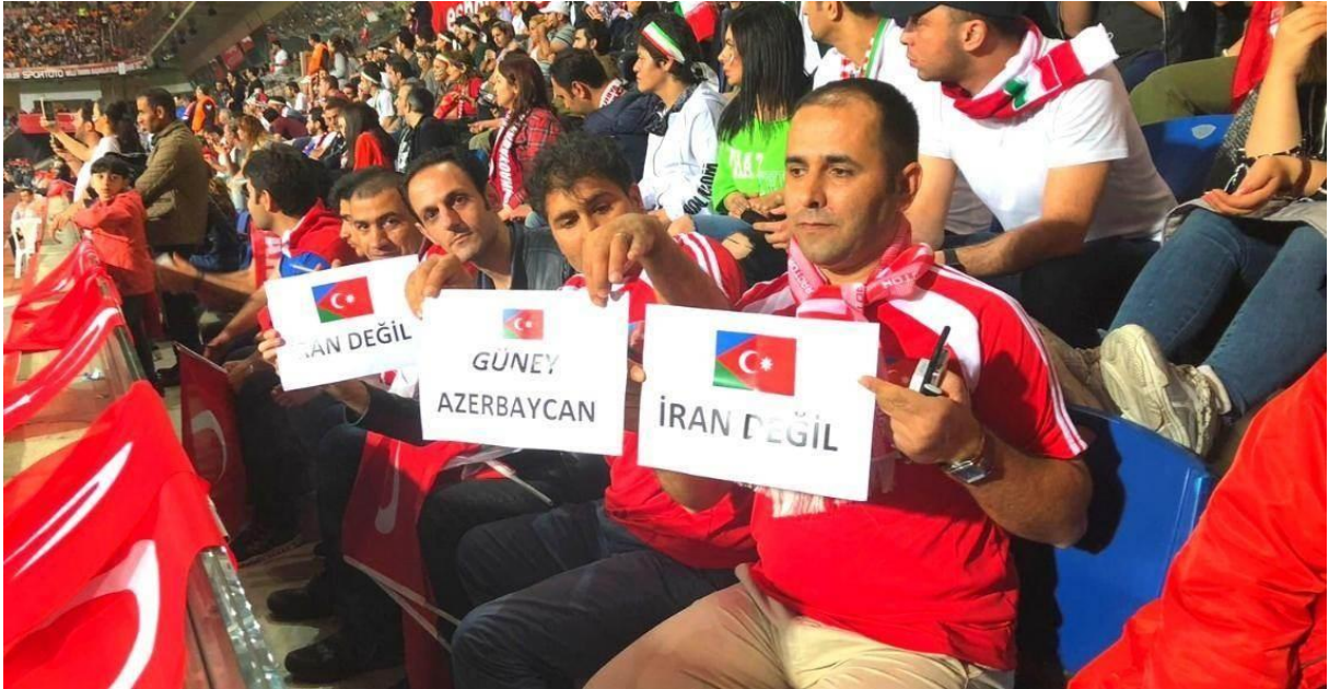
Stadyumda İran Türklerinin gösterdikleri pankartlar