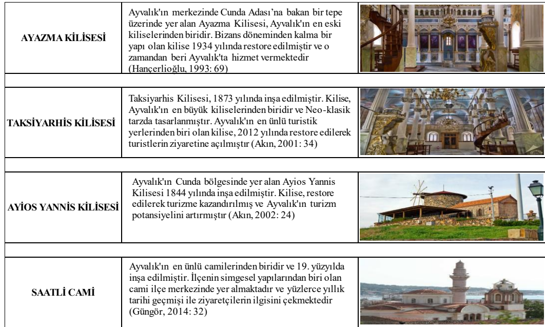
Resim 5: Ayvalık Dini Yapılar

Ayvalık köklü bir geçmişe sahiptir. Kent dokusunun oluşmasında etki eden bu köklü geçmiş aynı zamanda mimari açıdan oldukça etkileyici olan birçok dini yapıyı da beraberinde getirmiştir. Kentte irili ufaklı birçok cami ve kilise bulunmaktadır. Bunların içinden en ünlüleri Ayazma Kilisesi, Taksıyarhis Kilisesi, Ayios Yannis Kilisesi ve Saatli Camidir.