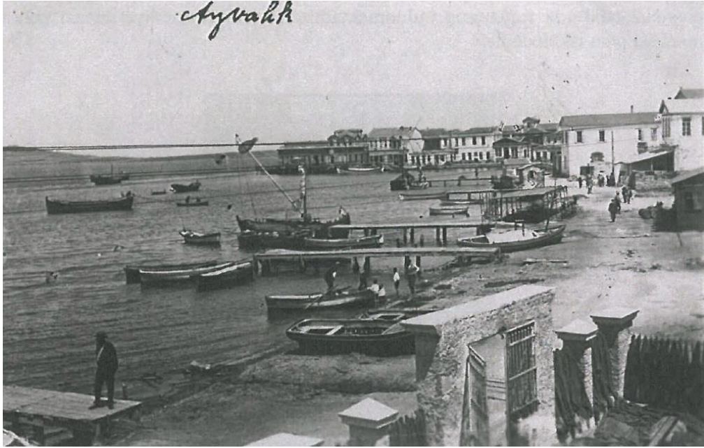
Resim 2: 1900'lü Yılların Başında Ayvalık Atatürk Caddesi

Selçukluların Ayvalık'a hakim olduğu dönemleri net bir şekilde aydınlatacak yazılı bir kaynak bulunmamaktadır. Fakat Osmanlı döneminde 1772 yılında Cezayirli Hasan Paşa tarafından çıkarılan bir fermanla Ayvalık adına rastlanmaktadır. İlçe 1789 yılından itibaren gayri Müslimlerin yaşadığı özerk bir bölge konumundadır ve özerklik durumu 1821 yılı Yunan ayaklanmasına kadar devam etmiştir. Bu isyandan sonra büyük kısmı boşaltılan ilçe 1840'da Osmanlı Devleti'nin Karesi Sancağı'na bağlı bir yerleşim yeri olmuştur (Kültür ve Turizm Bakanlığı, 1984: 32-33).