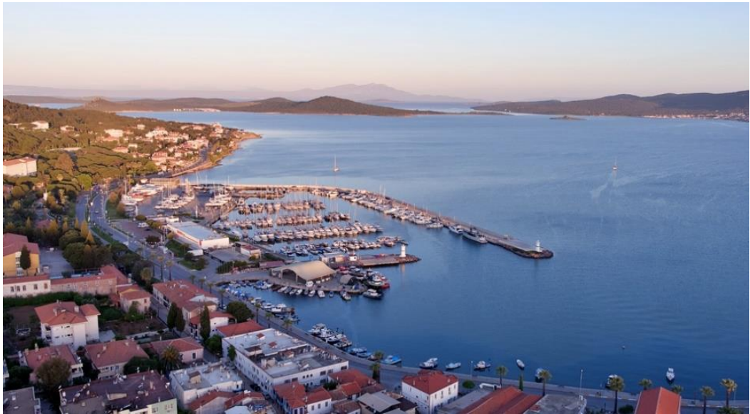
Resim 11: Ayvalık Yat Limanı

Bölgede hizmete sunulan Ayvalık Setur Marina ile yat turizmi de ivme kazanmıştır. Setur Marina, İstanbul ile İzmir illeri arasındaki yat seyahatinde ve Midilli ile diğer Yunan adalarından yat yoluyla gelecek olan kişilerin konaklaması, yat bakım ve onarım ile yat barınması ihtiyaçlarını karşılayabilecek uluslararası standartlardaki tek yat limanını oluşturmaktadır. Yat limanının denizde 200, karada 150 yat olmak üzere ortalama kabul kapasitesi 650 teknedir (Narin, 2002: 131-132).