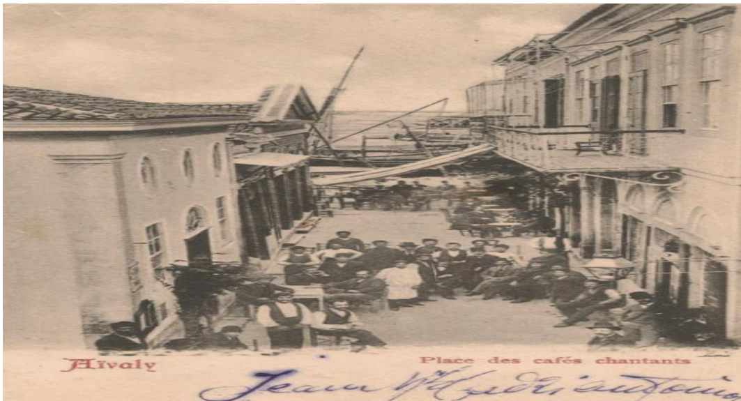
Resim 1: 19. Yüzyıl Ayvalık Liman Bölgesi Çarşısından Bir Görünüm

Tarihsel süreç içerisinde Cisthna, Taliani ve Kydonia gibi çeşitli isimlerle adlandırılan ve çok eski bir yerleşim merkezi olan Ayvalık'a ilk yerleşim Yunan adalarından göç eden Misyalılar ile oluşmuştur. Misyalılar buraya yerleşerek çeşitli koloniler kurmuşlardır. Ayvalık ve çevresi İ.Ö. 330-30 yılları arasında Makedonyalıların, M.Ö. 30 - M.S. 395 arası Romalıların, M.S. 395 – 1453 arasında Bizanslıların hakimiyeti altında kalmıştır. Ayvalık'ın bugünkü anlamda kuruluşu ise bazı kaynaklara göre 1430-1440 yıllarına bazılarının göre ise 1623 yılına kadar uzanmaktadır. Antik çağlarda Ayvalık'ın önündeki adalar Hekatonnesoi olarak adlandırılmakta ve çevrede Neos, Chalkis, Khidonia ve Pordoselene isimleriyle anılan yerleşimler görülmektedir. Neos, günümüzdeki Cunda (Alibey) Adası'nı, Khidonia ise Cunda'nın Lale Adası'na bakan bölümündeki alanı ifade etmektedir. Eski Ayvalık'a dair çok fazla bir kalıntı olmamakla birlikte Altınova bölgesine Hellenistik, Roma ve Bizans Dönemlerine ait çeşitli seramikler ve heykel parçaları bulunmuştur (Yorulmaz, 1994: 20-28).