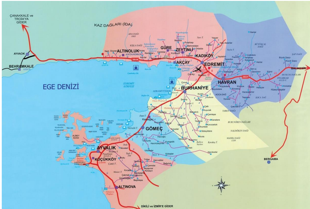
Resim 3: Ayvalık Coğrafi Konum

güneyinde Dikili, doğusunda ise Bergama ilçesi yer almaktadır. Bergama ve Dikili ilçeleri ile olan sınırı aynı zamanda Balıkesir İzmir sınırını oluşturmaktadır. Ayvalık doğuda Sazanlık Deresi, güneyde Altınova, kuzeyde Bezirgan Deresi ve Gömeç, Hisar ve Demirhan Boğazı, güneybatıda da Kaplan Dağlarının meydana getirdiği Sarımsak Yarımadası ile doğal olarak çevrelenmiş konumdadır. Adını ise içinde yer aldığı Ayvalık Körfezi'nden almaktadır. İzmir-Bergama istikametinden gelip Truva, Çanakkale, Edirne ve İstanbul'a uzanan E-24 karayolu üzerinde, Ege'nin Akdeniz sahil şeridinin başladığı yerde kurulu MÖ.330'dan beri var olan, iki kuzey nokta Patricia ve Mitralyöz Burnu, iki güney nokta Eğribucak Burnu ve Altınova dikdörtgeni içinde 100 km'den fazla sahile sahip bir ilçedir. İlçe karayolu ile İzmir'e 155, Bursa'ya 277, Susurluk'a 170 km, Çanakkale'ye 167, Ankara'ya 657, Bergama'ya 45, Truva'ya 154, Behramkale'ye 155, Efes'e 239, Alibey (Cunda) Adası'na 8 kilometre uzaklıktadır (Aşık, 1996: 3).