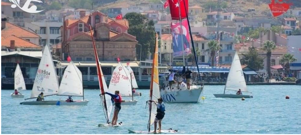
Resim 12: Ayvalık Yelken

Sörf ve yelken sporları için de Ayvalık popüler bir destinasyondur. İlçede süreklilik az eden hafif esintiler rüzgar sörfü (Windsurf) için de oldukça elverişlidir. İklim yapısı, kıyı özellikleri ve tesisleri Ayvalık, bu branşlardaki yarışlara da ev sahipliği yapmaktadır. Ayvalık Yelken ve İhtisas Kulübü başta olmak üzere bu sporlara merak salmış ziyaretçiler için profesyonel eğitim hizmetleri verilen tesisler de bulunmaktadır (Şentay, 2013: 98).