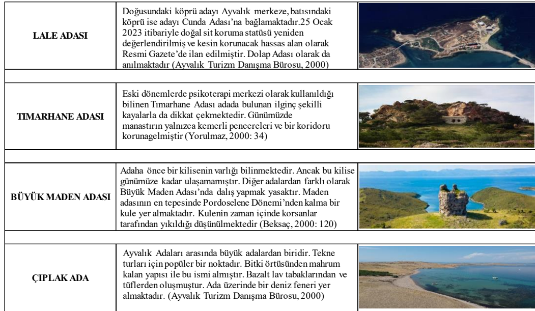
Resim 9: Ünlü Ayvalık Adaları

Kentin diğer ünşü adaları ise Lale Adası, Tımarhane Adası, Büyük Maden Adası ve Çıplak Adadır.