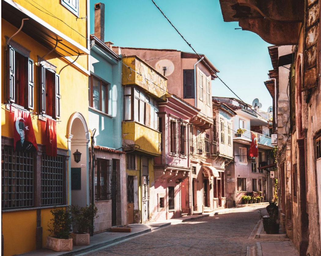
(Ayvalık Turizm Danışma Bürosu, 2020)

2012 yılında UNESCO Dünya Mirası Geçici Listesi'ne eklenen bu evler, zengin tarihi ve kültürel miraslarının yanı sıra mimari özellikleri ile de dünya