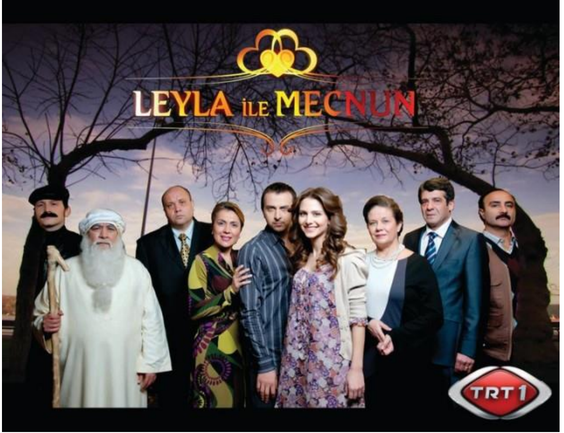
Görsel 6: Leyla ile Mecnun Dizi Afışı

Absürd komedi başlığı altında absürd tiyatronun özellikleri yer almaktadır. Burada absürd komedi ayrı bir tür gibi anlatılmıştır ancak özellikler birebir absürd tiyatroya aittir. Tezin ilerleyen kısımlarında Leyla ile Mecnun dizisinin absürd komedi örneği olduğundan bahsetmektedir. Dizide bir aşk hikayesi anlatılmaktadır. Beşik kertmesi ve beşik kertmesine aşık olma gibi geleneksel unsurlar vardır. Leyla ile Mecnun'un aşkı ve Aksakallı Dede gibi unsurlar olması masal, mesnevi ve efsane geleneklerinden yararlandığını göstermektedir. Dizide zenginlik- fakirlik gibi zıt durumlar ve fantastik öğeler vardır. Özellikle fantastik öğeler ve gerçeküstü durumların yer alması dahi absürd kavramı ile açıklanmaktadır. Örneğin; dizide yastığın konuşması olağanüstü bir durumdur. Bu durum absürd olarak nitelendirilmektedir. Masal türünün özelliklerinde cansız varlıkların konuşması vardır. Yine fantastik film ve dizilerde de buna benzer örnekler görmekteyiz. Dizinin kendine özgü bir dili vardır. Örneğin; sigara yerine sakız ifadesi kullanılır. Bu absürd kavramındaki dille farklıdır. Dizinin dili daha çok argoya