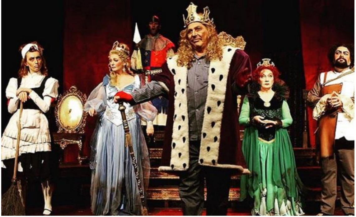
Görsel 5: Kral Oyunu Afişi

“ https://www.dunyabizim.com/ ” adlı sitede “Ölümsüzlüğün peşinde absürt bir komedi: Kral” adlı bir tiyatro oyunu absürt komedi olarak nitelendirilmiştir.