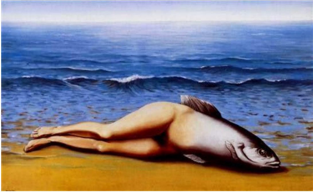
Görsel 4. Collective Invention (René Magritte / 1934)

kuyruğa sahiptir. Bu yaratığın su altında yaşayamayacağını ya da karada yürüyemeyeceği düşünülür. Bu çalışmadaki anti-denizkızının sahile vurduğu vaziyet ve -balık karada yaşayamaz- bilgisi nedeniyle, kara ve deniz canlısı arasındaki çelişkiye dikkat çeker. Bu çelişkiye dikkat çekilmesinin en belirgin nedeni denizkızının alışkanlıklarının dışına çıkan şekilde tasvir edilmesidir. Eseri bacaklar üzerinden yorumlamak istersek dilsiz, ölmek üzere ya da ölmüş bir kadın figürü algılanır. Bu eser sürrealistlerin kadını haz nesnesi olarak gören genellikle tecavüz ve şiddetle özdeşleştirilebilecek işlerine örnek olarak gösterilebilir. Bu melez canlının yaşamsal fonksiyonlarını meydana getiren parçalar koparılmıştır. Geriye cinsel organı, bacakları ve karada ölümüne sebep olan ve fonksiyonunu kaybetmiş balık başı kalmıştır. Eser sadece kadın, balık ve cinsellik arasında ikilem oluşturmaz aynı zamanda klasik denizkızı figürü ile de çelişki oluşturur. Bu çelişkili durumlar eserdeki anti denizkızının grotesk olarak anılmasına sebep olmuştur. (Gündüz, 2016, s. 32-33)