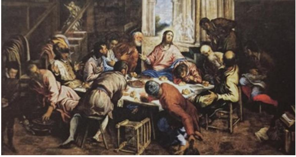
Görsel 2. Son Akşam Yemeği (Jacopo Tintoretto/ 1566)

Masa Leonardo'nun aynı temalı resminde olduğu gibi resim düzeyine paralel durmamaktadır, çapraz konulmuştur. Orada havariler, tek çizgi üzerinde simetrik gruplar oluşturmuşlardı, burada masa etrafında gelişli güzel toplanmışlardır. Rönesans'ın idealleştirdiği havari tiplerinin yerini günlük hayatta her rastlanabilecek insanlar almıştır. Sanatçı kişilerin birini arkadan göstermektedir, ikisi kenarda gölgede kalmış diğerlerinin yüzü de tam olarak seçilememektedir. Leonardo'nun resim yüzeyine sıkı sıkıya bağlı kalan figürleri Tintoretto'da dört bir yana savrulmuştur. Hareket uzam içinde dağılmaktadır. (N.İpşiroğlu ve M.İpşiroğlu, 2017, s. 116)