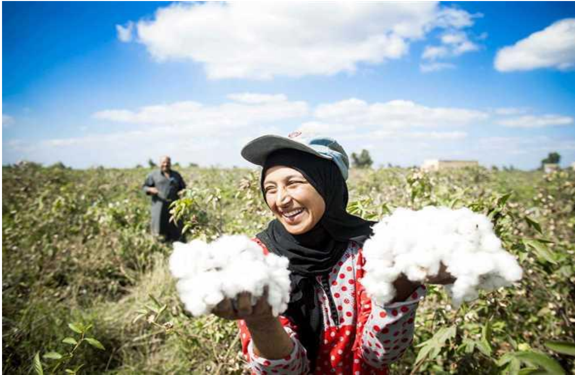
Şekil 4.2. Pamuk İşgücü