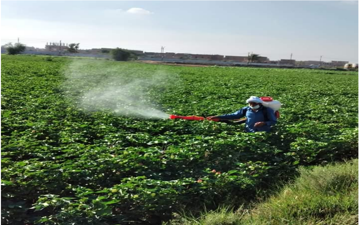
Şekil 4.1. Pamuk İlaçlama