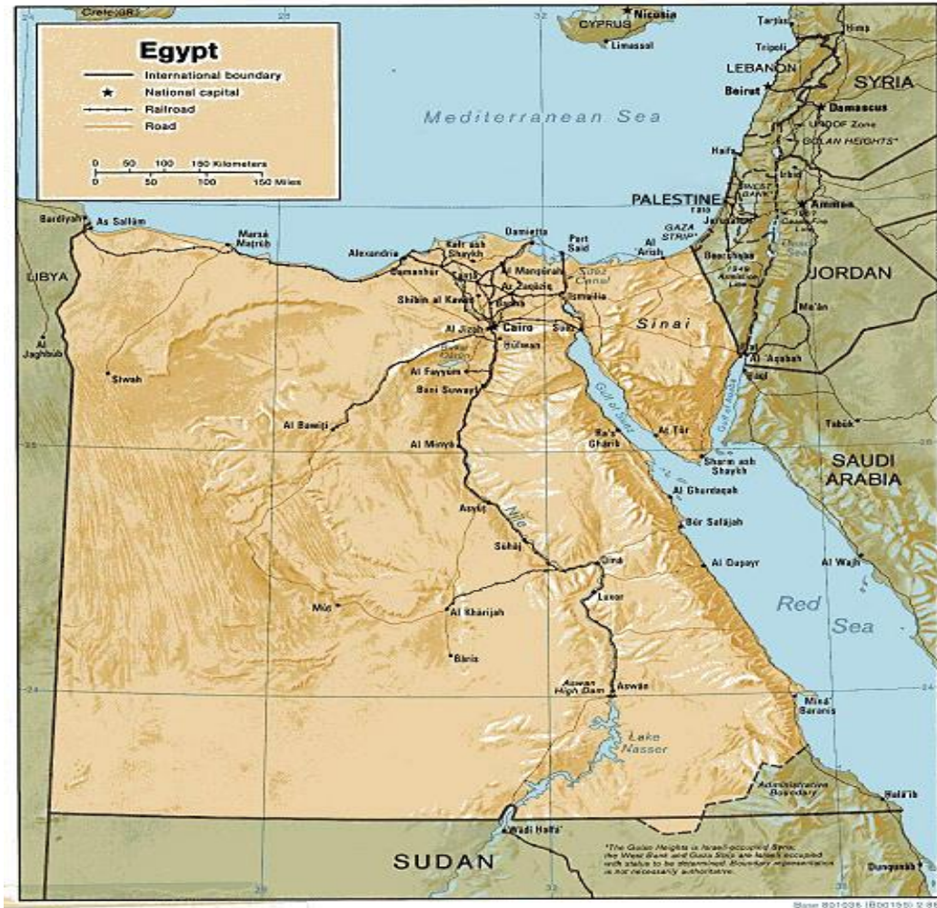
Şekil 2.1. Mısır Haritası

Dünya pamuk fiyatlarının artması, düşük fiyata alışmış uluslararası ithalatçılar için bir avantaj oluşturabilir. Ancak uluslararası ticarete piyasa payını yitirmek çok önemli bir sorundur. Bu kapsamda kademeli olarak hedefler belirlenmeli, yüksek verimli GDO'lu ürünlerden ziyade Mısır pamuğunun kalitesinin anlatılması için gerekli adımlar atılmalıdır. Ancak herşeyden önemlisi, pamuk tarımı ile uğraşan çiftçilerin yoksul kalmış olmasıdır. Yoksul çiftçi, düşük tasarruf, düşük yatırım, düşük gelir döngüsünden kurtulamamaktadır. Benzer sorunlar, araştırmanın yürütüldüğü Fayyum İlin'deki köylerde de sorundur. Fayyum, Mısır'da önemli pamuk üretim merkezlerinden biridir. Fayyum ilindeki pamuk ekili alanların 2.8 bin hadır, ve pamuk dönümünün ortalama verimliliği yaklaşık 825 kg/ha dır. Fayyum'un toplam pamuk üretimi 2.3 tondur. Bu kapsamda araştırma bölgesi, pek çok küçük-orta ölçekli pamuk üreticisinin bulunduğu Fayyum'da gerçekleştirilmiştir (Şekil 2.1,Şekil 2.2)