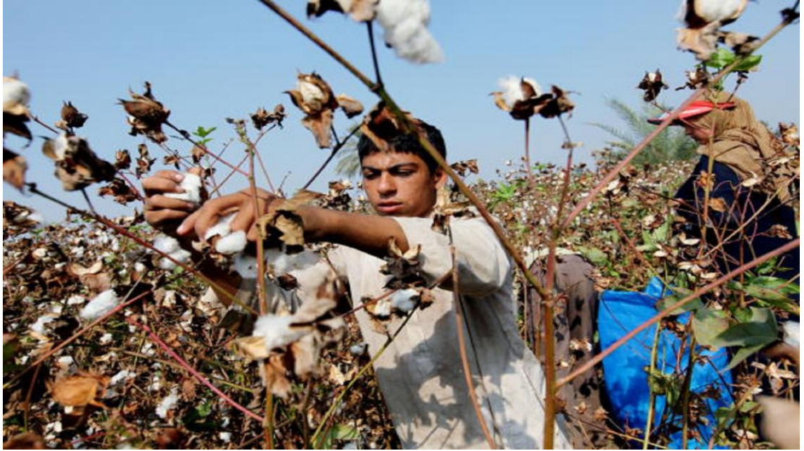
Şekil 4.3. Pamuk elle hasat şekli

Pamuk üreticilerinin küresel bazdaki etkilerinin ölçüldüğü sorgulamada 5’li Likert ölçeğine göre 1 en zayıf, 5 en güçlü olarak kabul edilerek; çiftçilerden değerlendirmeler yapmaları istenmiştir.