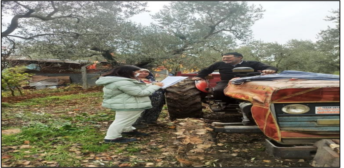
Şekil 3. 1. Zeytin üreticileriyle yapılan anket çalışmaları (2021)

Şekil 3.1’de zeytin üreticileriyle yapılan anket çalışmaları görülmektedir.