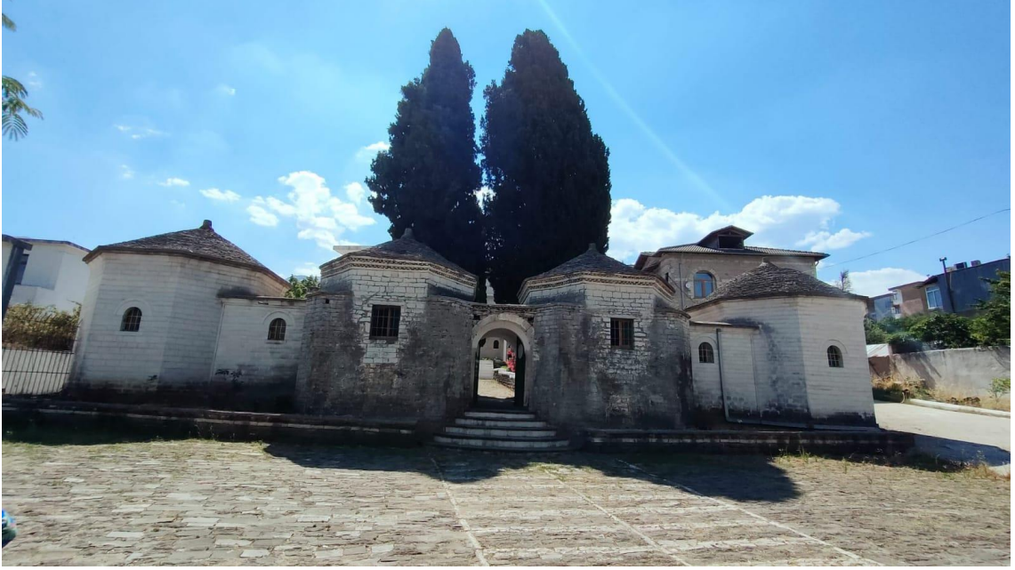
Ek. 4. Zal Tekkesinden kareler (Teqja e Zallit)