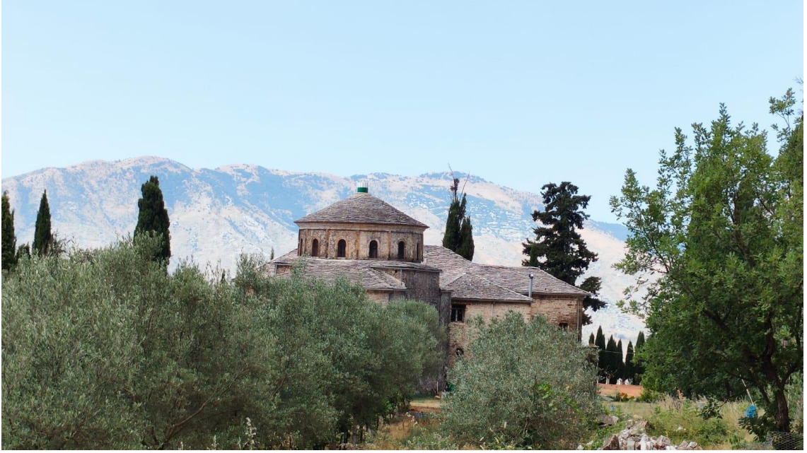
Ek. 6. Ali Hormova Tekkesi