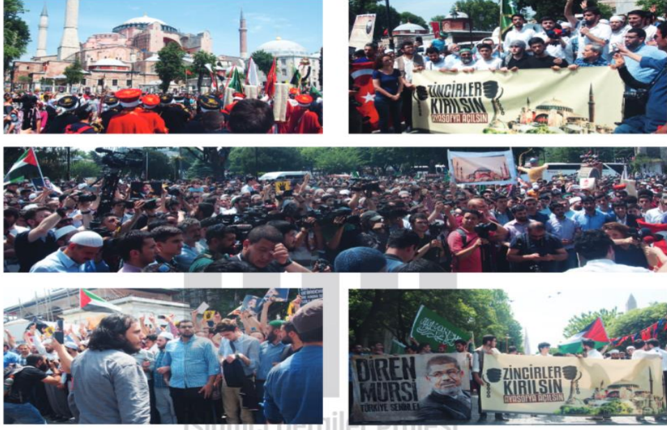
Resim 2: Mayıs 2015 tarihli Baran Dergisinin haber fotoğrafı

Sur dergisinde, Milliyet gazetesinde yazar olan Altan Öymen’in Ayasofya’nın cami olmaması konusundaki çıkışı hakkında yorum yapılmıştır. Altan Öymen: “O zaman savaşlar dini sebeplerle yapılıyordu. Fatih’in Ayasofya’yı cami yapması normaldi. Şimdi cami yapılması anormaldir.” demiştir. Tarihi bir olaydan ibaret görüp dini hassasiyeti geçmişe hapsedip günümüz dünyasının cami yapılmasına ihtiyaç duymadığını dile getiren Öymen’e karşı Beyhan Erdem, “Batı ile münasebetlerimizi şekillendiren tek unsurdur din” 21 diyerek hilal-haç mücadelesinin hala daha devam ettiğini söylemiştir. Çünkü Erdem, çatışmanın kaynağında din unsurunu görmektedir. Beyhan Erdem’in sözlerinden dini, bu çatışmayı haklı çıkaracak bir sebep olarak kabul ettiği anlaşılmaktadır. Nitekim dinin pek çok işlevleri söz konusudur. Bunlardan biri de meşrulaştırma. İnsanlar din aracılığıyla yaşanan olaylara anlamlar yüklerler. Din, savaşları meşrulaştıran sebeplerden biridir. 22 Birini öldürme, öldürülme eylemleri, insan