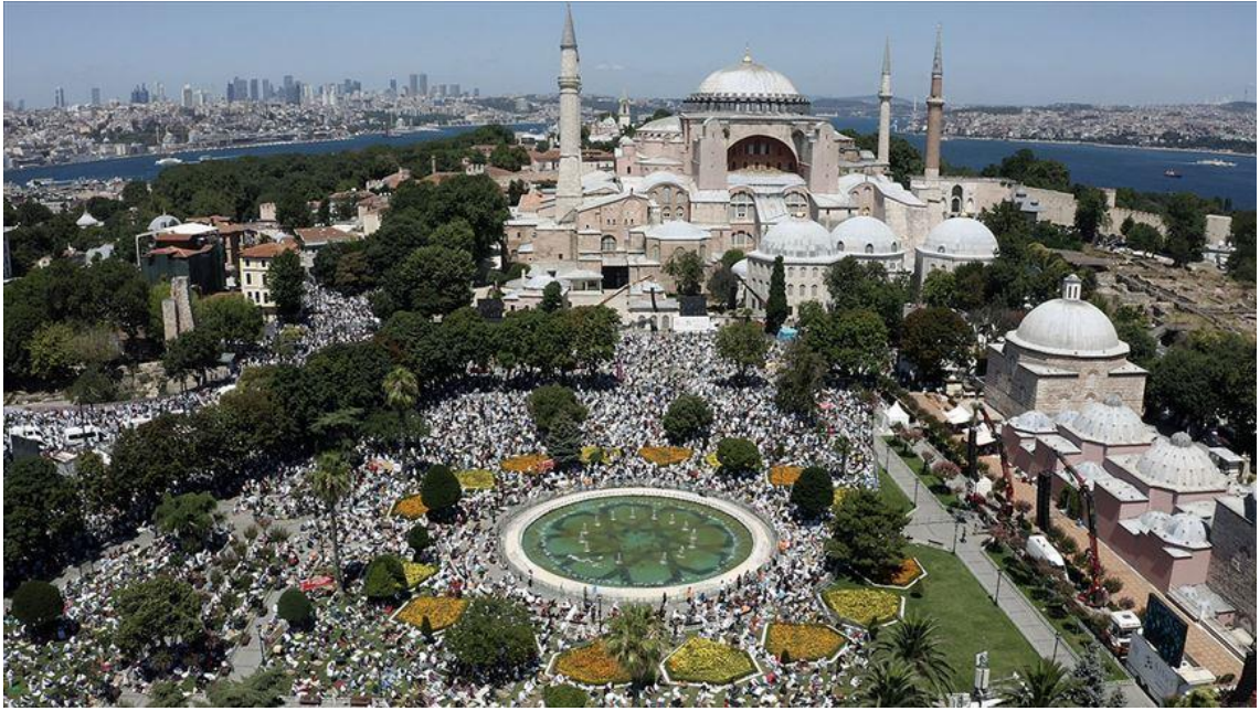
Resim 6: Anadolu Haber Ajansının, 25/07/2020 tarihli dünya basınındaki yansımaları adlı haberine ait fotoğraf *

Ayasofya'nın açılma haberi sonrasında kılınan şükür namazları ve Cuma namazının kılınacağı gün, farklı şehirlerden gelen insanların coşkusu, aradan 86 yıl geçmiş olsa da İslamcılar nezdinde mabedin sembolik anlamının yok olmadığını ve Müslümanlarla mabet arasında duygusal bağın kaybolmadığını göstermiştir.