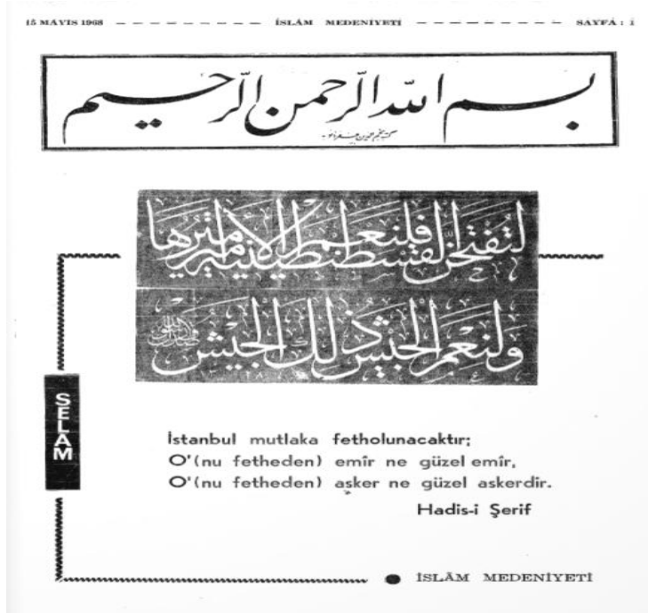
Resim 3: İslam Medeniyeti dergisinin kapak fotoğrafı

Hadisin, Türkler için ehemmiyeti, Hz. Muhammed'in sözlerine muhatap olmasından kaynaklanmaktadır. Uzun yıllar boyunca İstanbul'u kuşatma çabalarının var olduğu bilinmektedir. Fatih Sultan Mehmet'in İstanbul'u fethetmesiyle Müslümanların eline geçmesi, torunları olarak Türkleri gururlandırmaktadır. Dergiler içerisinde yazılarda ve giriş sayfalarında Hadis-i Şerif'in yer aldığı görülmektedir. 26