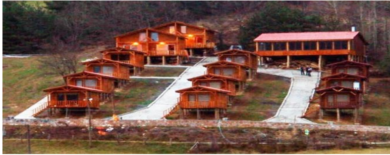
Şekil 4.4. Kırsal Turizm Tesisi Projesi-4

TKDK proje desteklemesinden yararlanılarak kurulan Kırsal Turizm Tesisi Projesi-4 tesisi için yarısı AB fonlarından hibe olmak üzere toplam 1 milyon 150 bin TL'lik yatırım yapılmıştır. İçerisinde 15 adet ahşap ev ve bir restoran bulunan tesiste bunun yanı sıra doğal yürüyüş parkurları ve ATV araçları ile doğa turları yapma olanağı da bulunmaktadır.