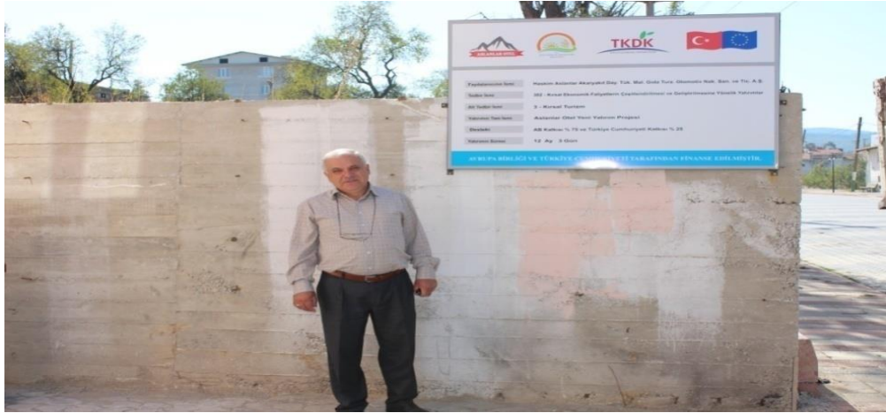
Şekil 4.1. Turizm Tesisi Projesi-1

Kırsal Turizm tesisi projesi-1, Bursa ilinin Orhaneli ilçesinin Fevzi paşa mahallesinde 2015 yılında faaliyete geçirilmiştir. Ortalama 12 ay 3 gün gibi bir sürede hayata geçirilen proje TKDK kurumundan %50 hibe desteği alarak projelendirilmiştir. Proje maliyeti toplam 596.243,73 TL (195.669,37 €)' dir. Proje toplam tutarının 447.182,79 TL'sini AB, 149.060,94 TL'sini TC devleti tarafından karşılanmaktadır. Toplamda 25 oda kapasiteli bir kırsal turizm tesisidir.