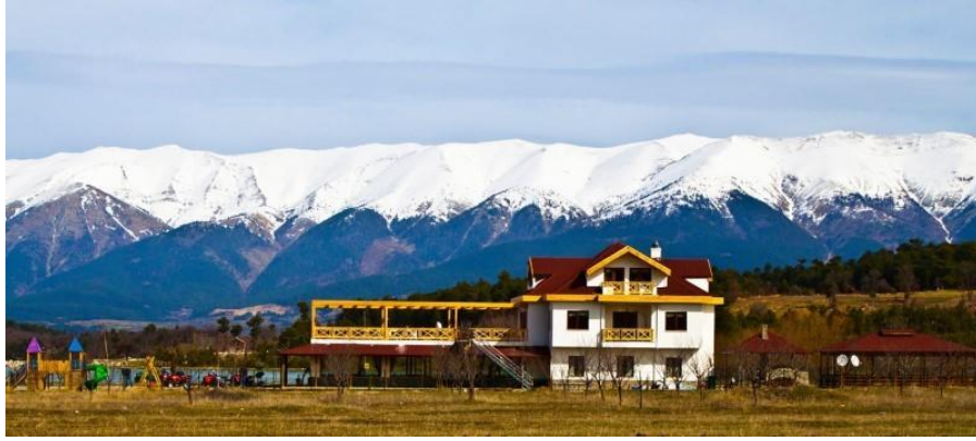
Şekil 4.2. Kırsal Turizm tesisi projesi-2

Kırsal Turizm tesisi projesi-2, Bursa'nın dağ ilçelerindeki kırsal yerleşim özelliği gösteren mahallelerin gelişmesinde önemli katkılar sağlayacak potansiyelindedir. İşletmede tam zamanlı olmak üzere 7 kişiye günlük, toplam 24 kişiye sezonluk iş olanağı sağlayabilmektedir. Bunun yanı sıra yakın çevrede yaşamını sürdüren özellikle kadınlar için önemli bir ekonomik katkı sağlayabilmektedir (salça, reçel, köy kahvaltısı gibi). İşletme doğal ortam içerisinde doğa meraklısı insanlara güvenli, sağlıklı ve kaliteli bir alternatif tatil fırsatı sunabilmektedir.