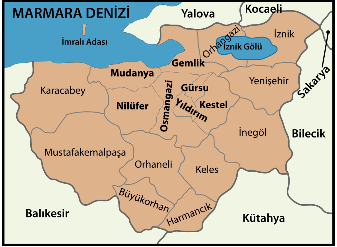
Şekil 3.1. Bursa İli Haritası

Osmanlı topraklarına 1326 yılında Bizans topraklarından katılan ve Osmanlı Devleti'nin ilk başkenti olması nedeniyle Osmanlı izlerinin yoğun olarak hissedildiği şehir olan Bursa nüfus yoğunluğu bakımından, İstanbul, Ankara ve İzmir'den sonra Türkiye'nin en büyük 4. şehridir. Bursa, ekonomik açıdan Türkiye'nin en gelişmiş kentlerinden birisi olmasının yanı sıra tarihsel ve doğal zenginlikleri ile de oldukça büyük önem taşımaktadır. Marmara Bölgesi'nin gözde şehirlerinden birisi olan ve sahip olduğu yeşil dokusu nedeniyle Yeşil Bursa olarak tanımlanan şehirde, 27 arkeolojik, 1 doğal, 3 kentsel sit alanı, 2042 adet korunması gereken anıtsal yapının yanı sıra birçok türbe ve cami de yer almaktadır. Bursa'nın çok zengin bir kültürel ve doğa zenginliği bulunmaktadır. Tek başına sadece doğa güzelliği ile bile dikkat çeken bir şehirdir (Anonim, 2021d)