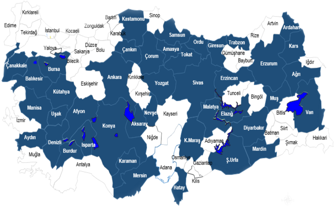
Şekil 2.1. IPARD Programının İller Bazlı Uygulama Yerleri

IPA'nın beşinci bileşeni olan IPARD programı yararlanıcılarından olan Türkiye, IPARD programına temel kaynak olması amacıyla ilgili bakanlık ve Devlet Planlama Teşkilatı koordinasyonunda stratejisini belirlemiştir. IPARD programının amacı, tarım sektörünün ve kırsal alanların sürdürülebilir kalkınması için öncelikli sorunların belirlenmesi ve çözümüne yönelik katkı sağlamaktır. Uygulamanın yapılacağı illerin seçiminde, tarımsal üretim ve potansiyel kırsal alanın güçlü ve zayıf yönleri, yurtiçi gayri safi hasıla (GSYİH) değerleri, göç durumları değerlendirilmiştir. Buna göre, birinci faz dönemi olan 2007–2009 döneminde Afyon, Amasya, Balıkesir, Çorum, Diyarbakır, Erzurum, Hatay, Isparta, Kahramanmaraş, Kars, Konya, Malatya, Ordu, Samsun, Şanlıurfa, Sivas, Yozgat, Trabzon, Van, Tokat illeri; 2010–2013 ikinci faz dönemi için Ağrı, Aksaray, Ankara, Ardahan, Aydın, Burdur, Bursa, Çanakkale, Çankırı, Denizli, Elazığ, Erzincan, Giresun, Karaman, Kastamonu, Kütahya, Manisa, Uşak, Mersin, Muş, Nevşehir, Mardin illeri (Şekil 2.1) seçilmiştir (Aslan ve ark. 2016).