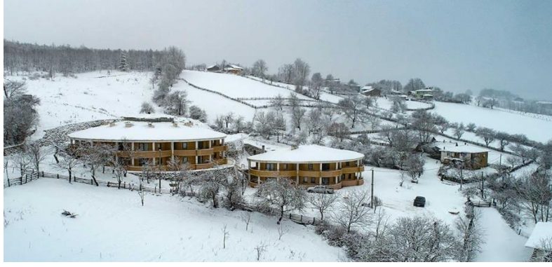
Şekil 4.3. Kırsal Turizm tesisi projesi-3