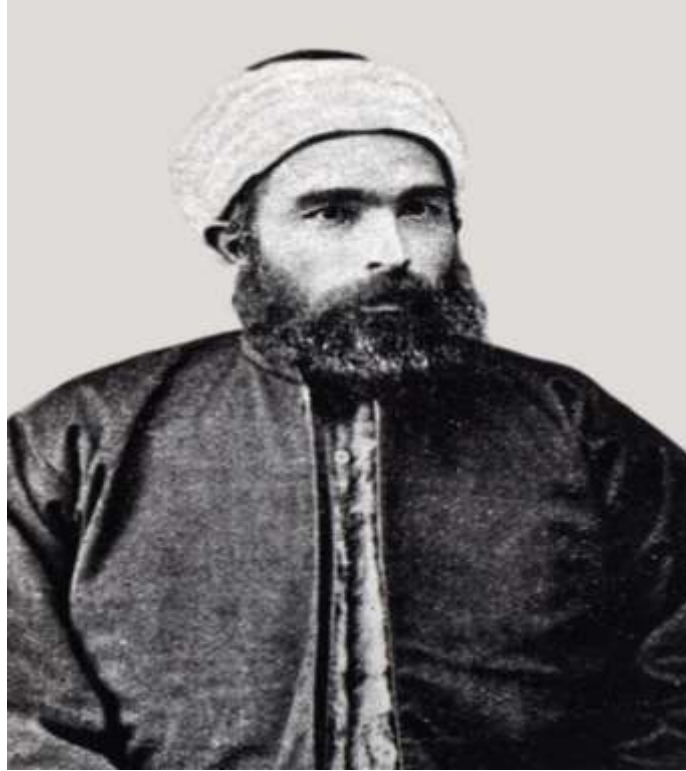
(Şeyhülislâm Musa Kazım Efendi)