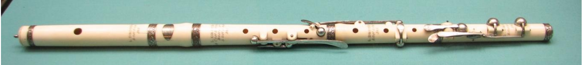
Resim 1. Louis François Philippe Drouet tarafından 1817 yılında yapılmış flüt.

18. yüzyılın ikinci yarısında ilk büyük orkestraların oluştuğu görülmektedir. Orkestranın bir üyesi olarak flüt de senfoni ve konçertolarda yerini almaya başlamıştır. Barok ve Klasik Dönemlerde flütün entonasyon problemleri yaşaması, parmak tekniğinde güçlüklerin olması ve gelişiminin tamamlanmamış olmasından dolayı; flüte, orkestralarda yer almaya yeni yeni başlamasının yanı sıra oda müziği eserlerinde daha sık rastlanır. Orkestralarda flütün kullanılmasına yönelik ilginin 1800'lü yılların ortalarında iyice arttığı görülmektedir.