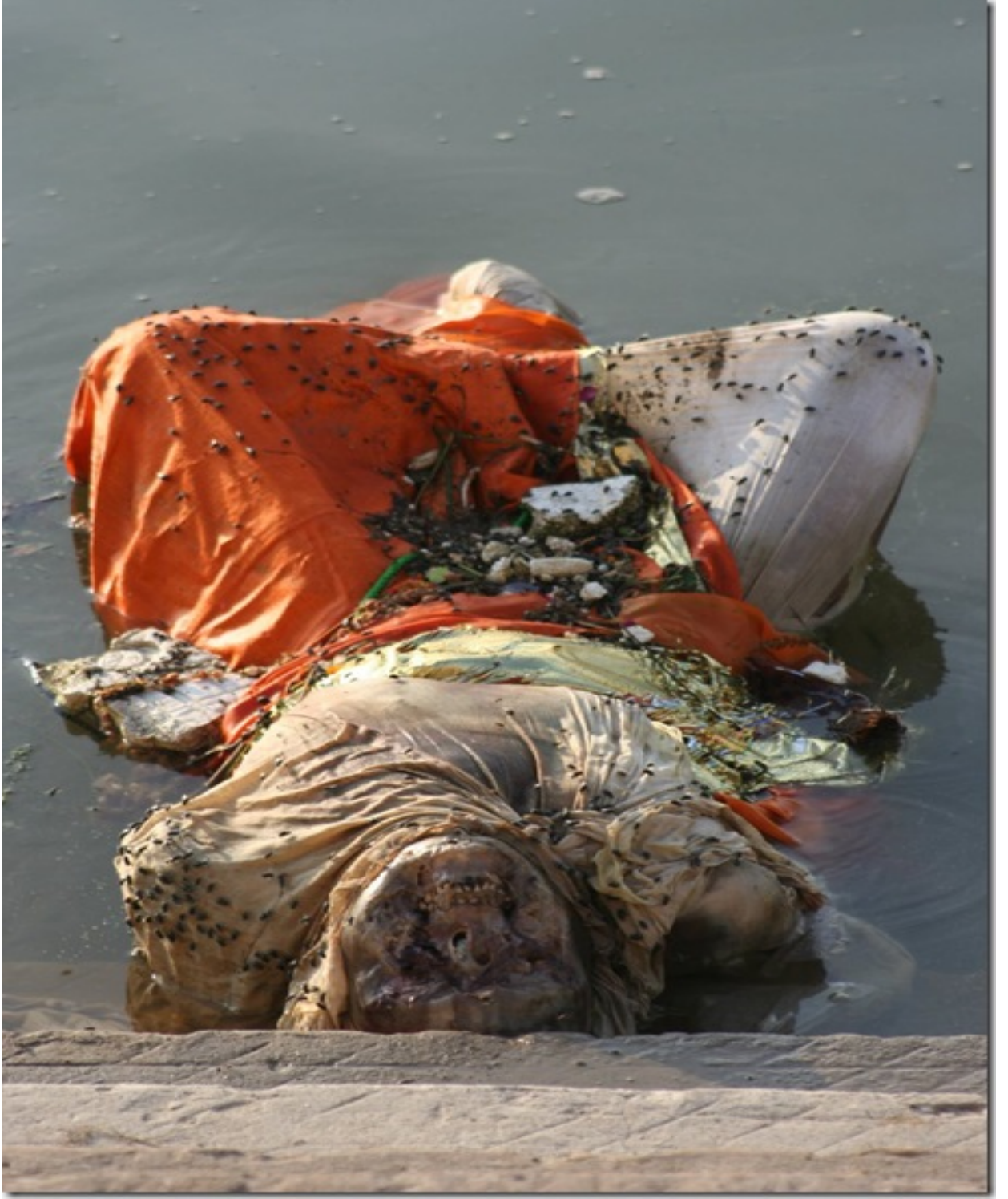
k. Ölü'nün lotus şeklinde suya atılmış hali ve ölü cesetlerinin su üstünde bulunması.