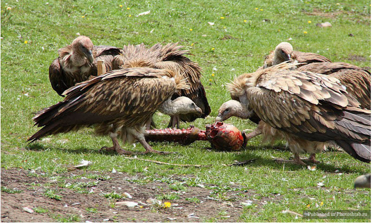
g. Sonra geriye kalan kemikler toplandı