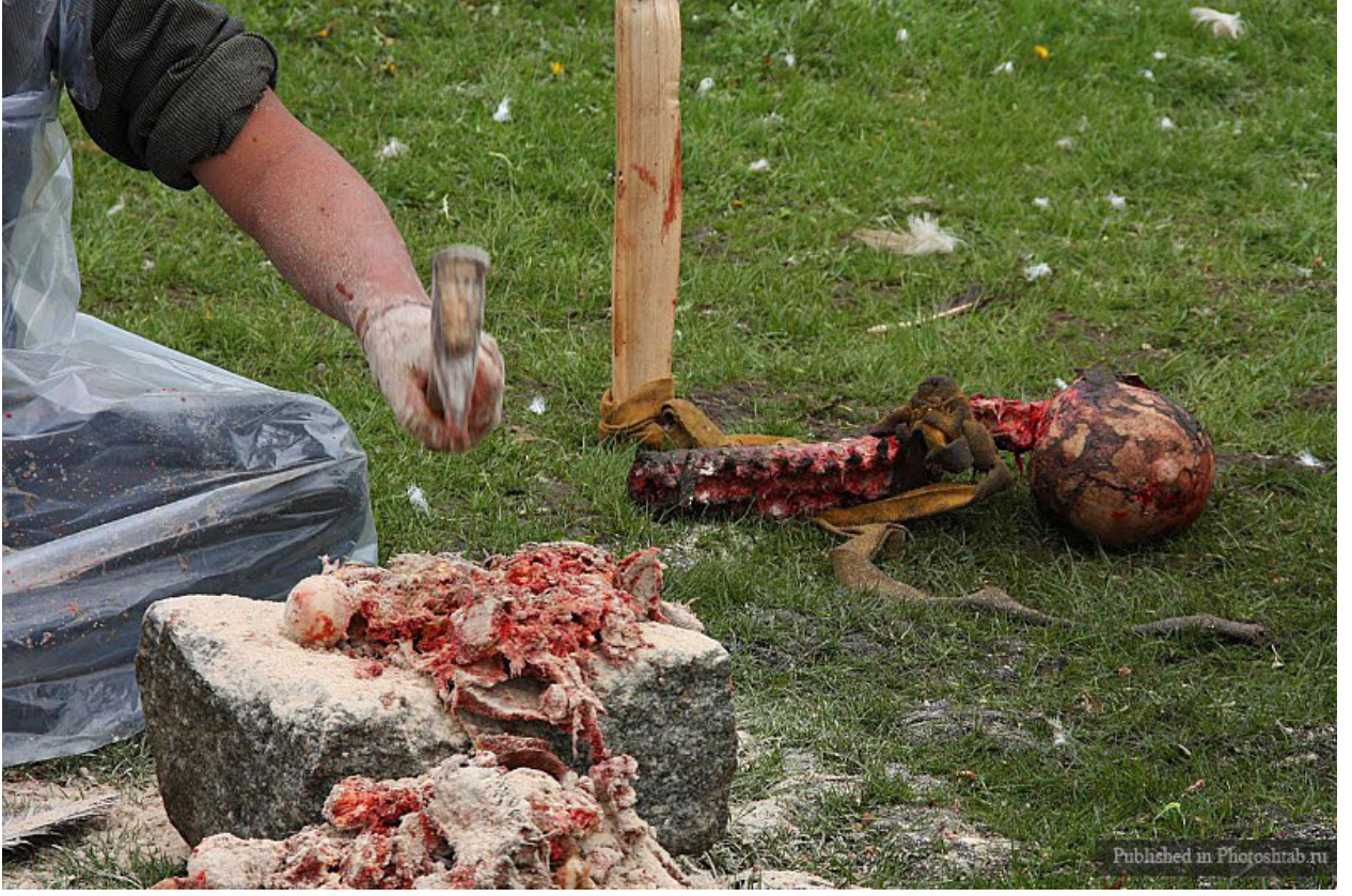
h. Ve onlar un haline gelinceye kadar ezilir.