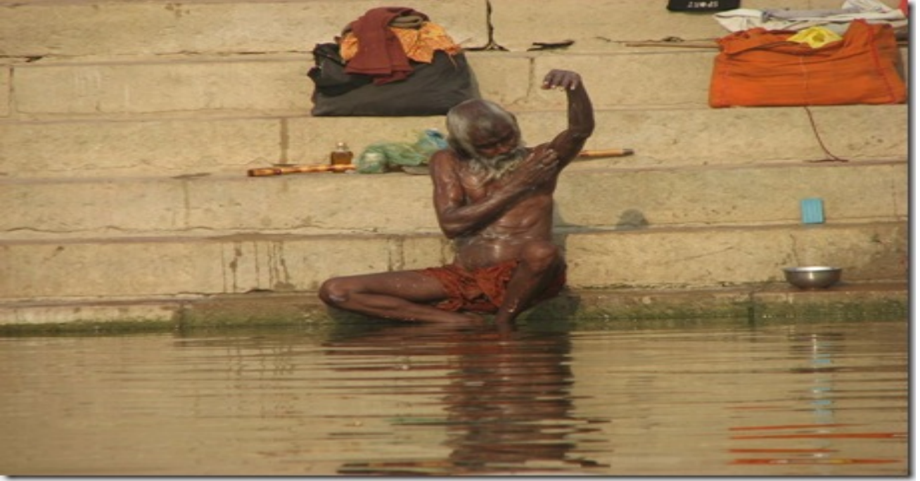
d. Hindu hacıları buraya günahlarından arınmak için gelirler.