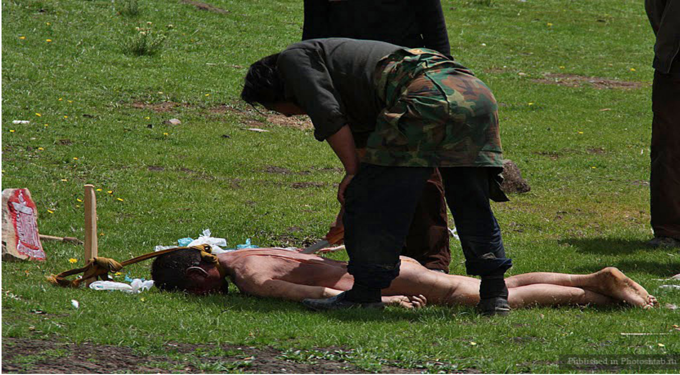
c. Sonra, ölü kişinin vücudu balta ile parçalara ayrılır.