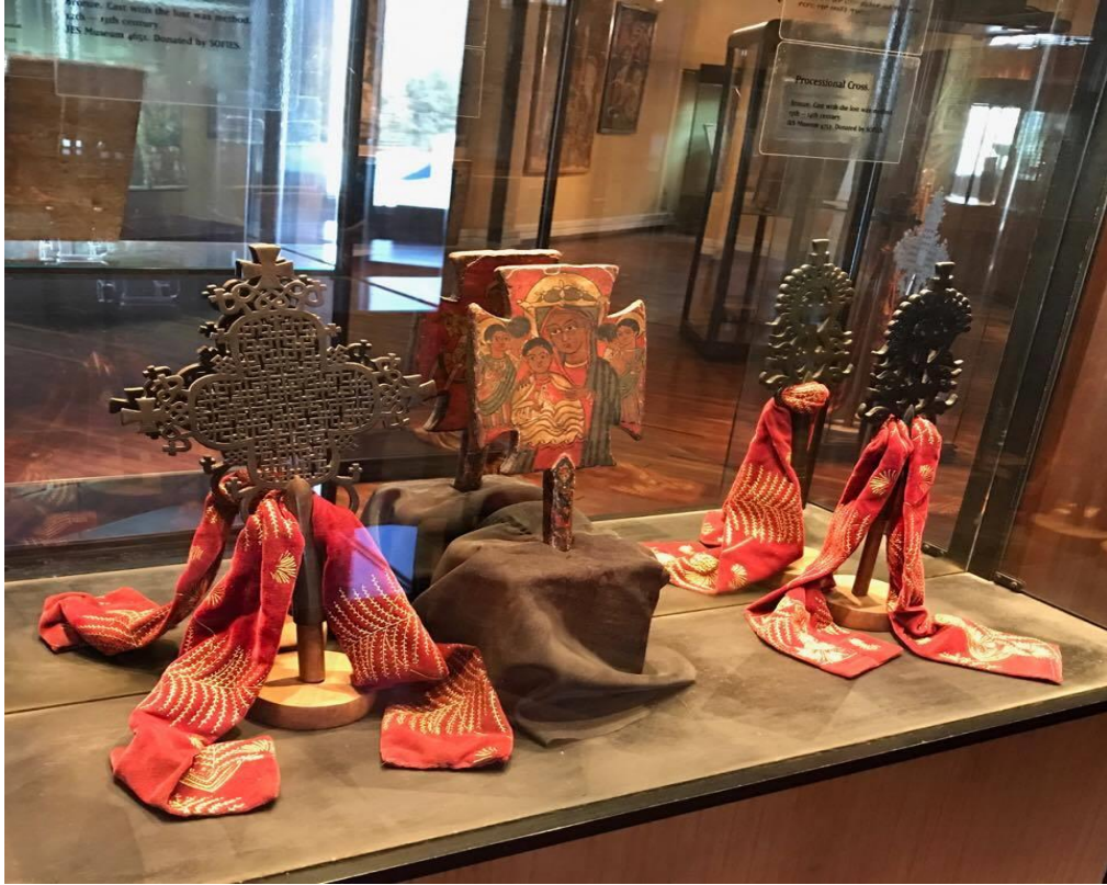
Resim 9: Ortodokslara ait bir haç