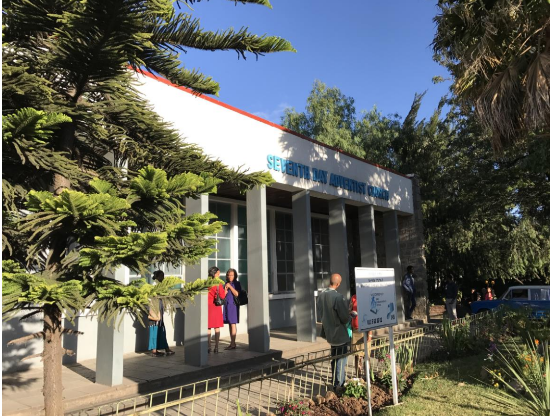
Resim 6: Etiyopya Yedinci Gün Adventist Kilisesi