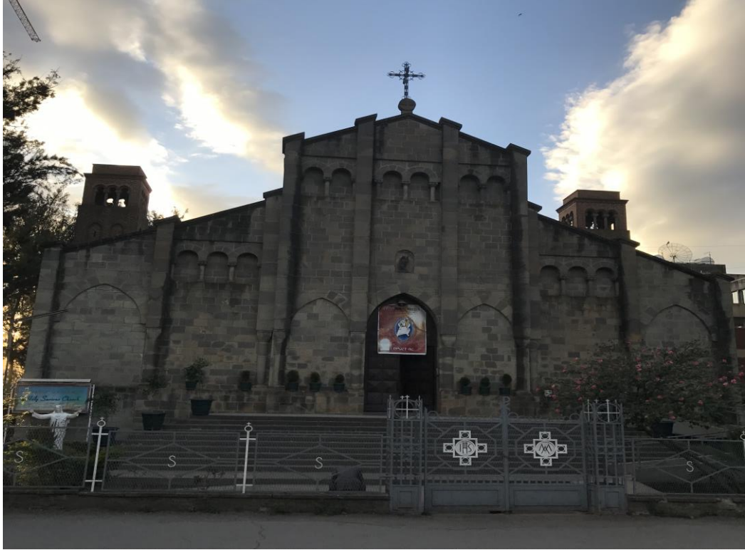
Resim 10: Aziz Michael Katolik Kilisesi