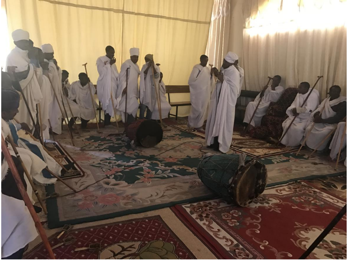
Resim 4: Bole Medhane Alem Kilisesi'nde ibadet edilirken