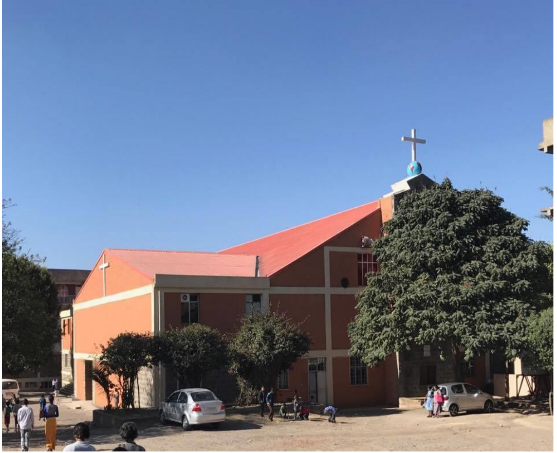
Resim 8: Etiyopya Apostalik Kilisesi