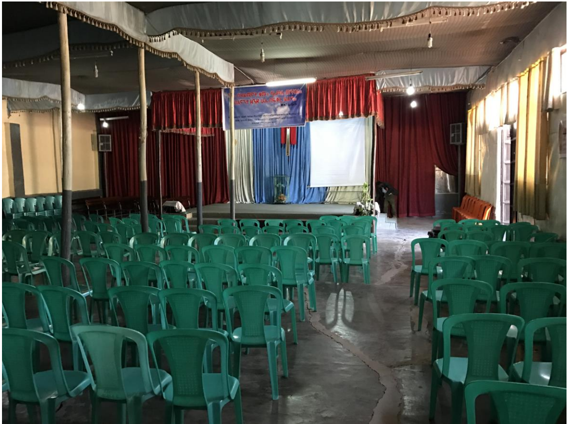
Resim 5: Southern Addis Ababa Mesrete Kristos Kilisesi