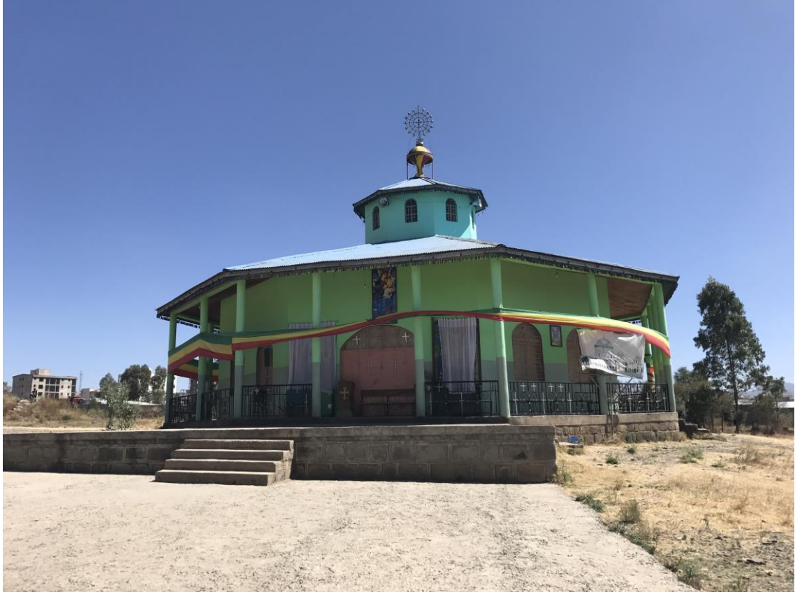
Resim 3: Bole Medhane Alem Kilisesi