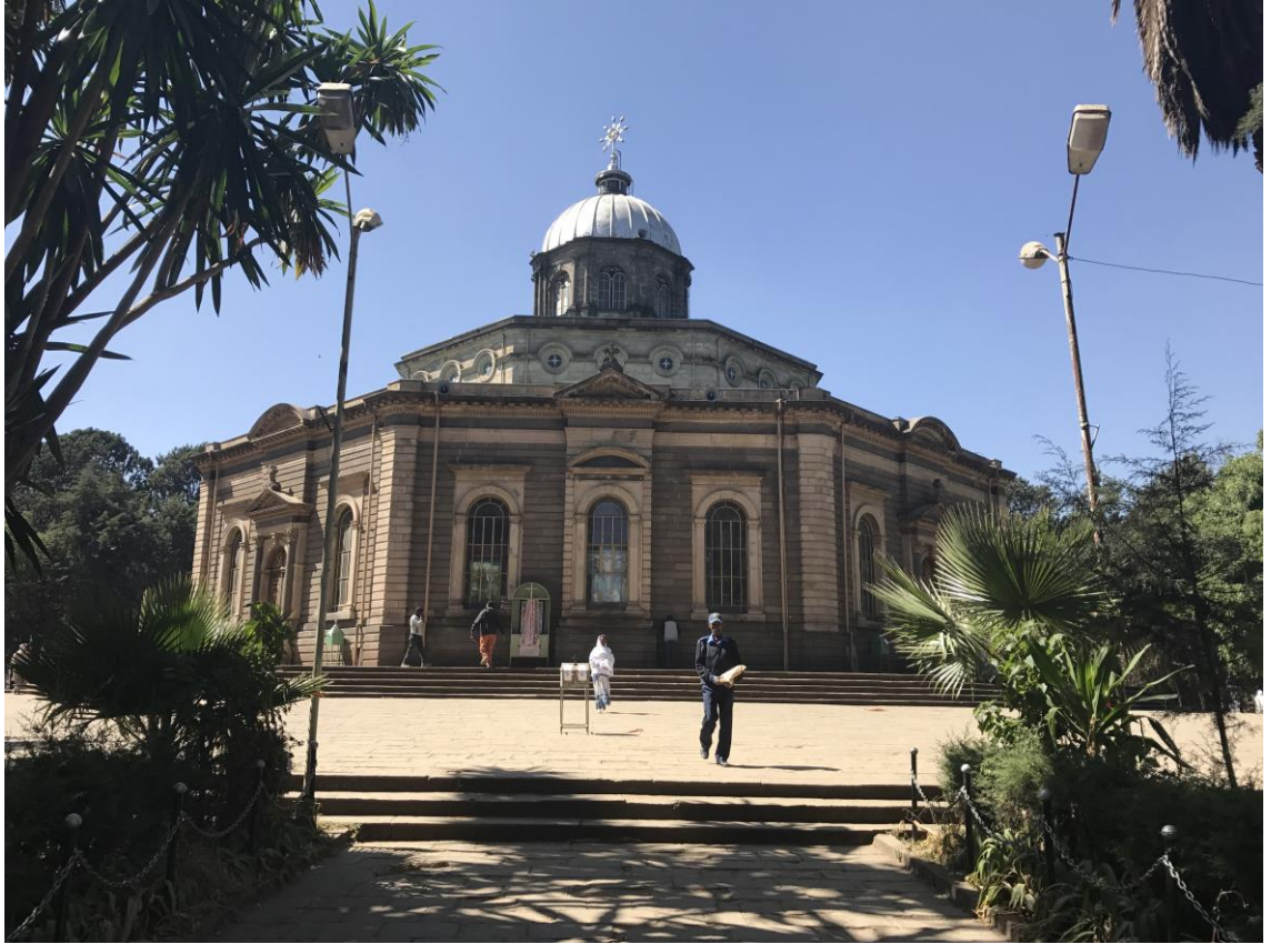
Resim 2: Menegsha Genet Tsige St. George Kilisesi