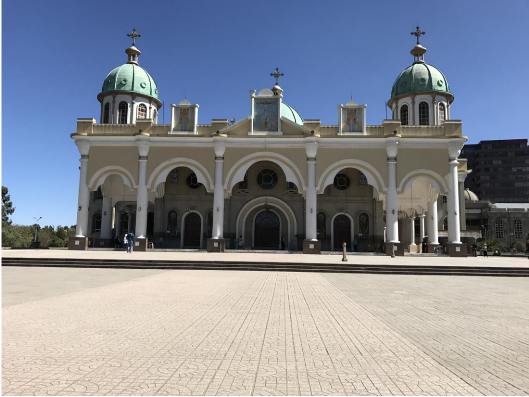
Resim 1: Medhane Alem Katedrali