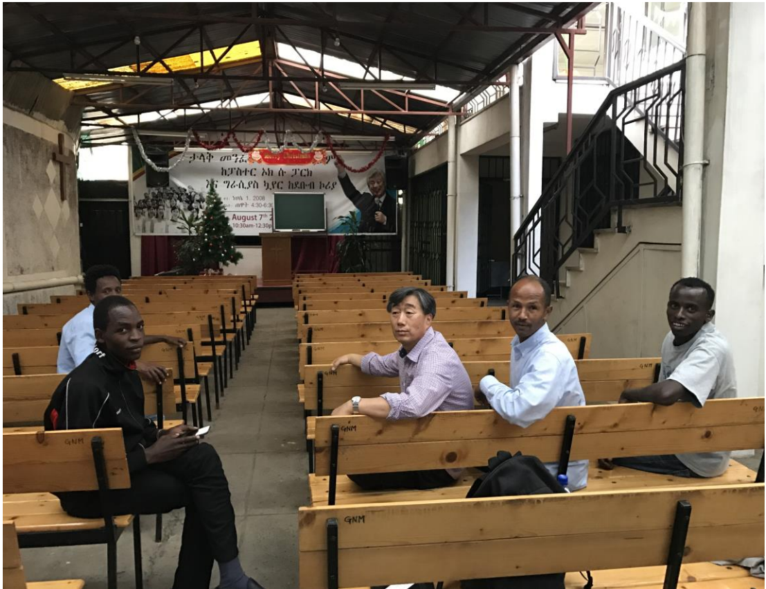
Resim 7: Addis Ababa Good News Kilisesi