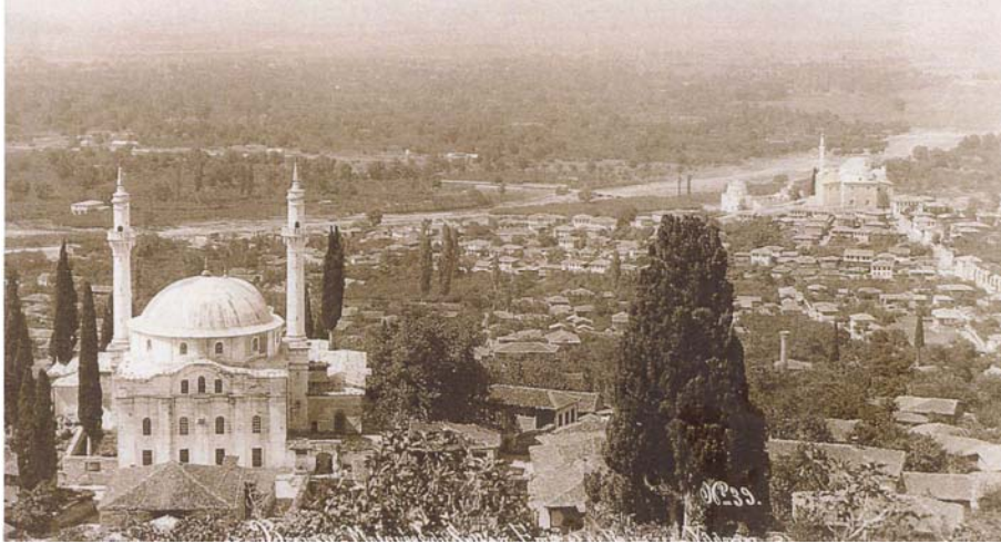
Resim 2. Emir Sultan ve Yıldırım Beyazıt Camileri