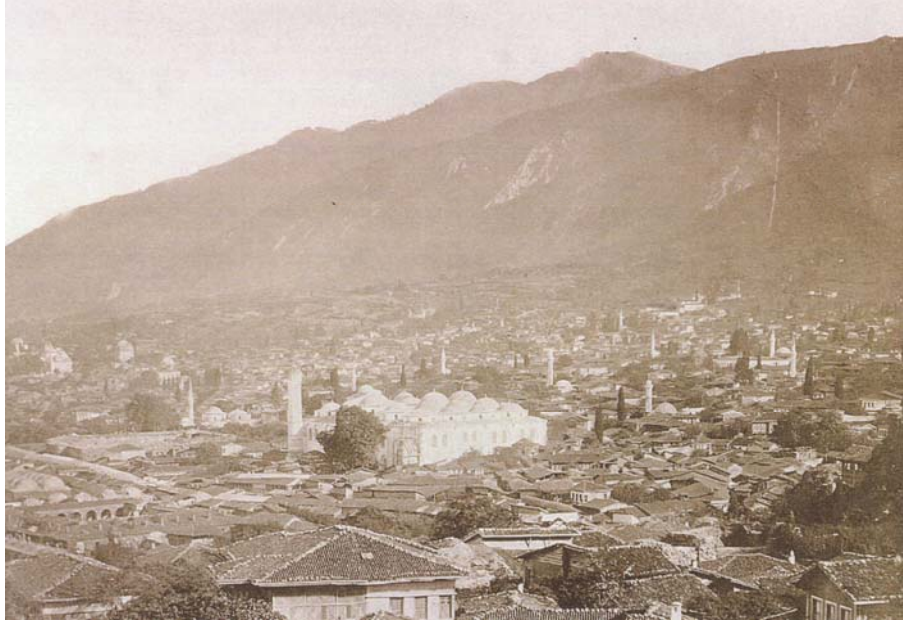
Resim 1. Bursa'nın Genel Görünümü ve Ulu Camii (1862)

çeşitlenen tarımsal ürünler ve yoğunlukları sebebi ile tarih boyunca ticaret merkezi olma fonksiyonunun korunmasıdır. Bir ikincisi, bugün anlaşılan kavramı ile turizm merkezi oluşudur. Bursa, turizm kenti kimliğini taşımasını, en başta sıcak su kaynaklarının bol olması ile kaplıca ve hamamları ile şöhret kazanmasına, Uludağ'ın bulunmasından dolayı kış sporlarının yapılması ile bir spor merkezi olması ve bir o kadar plaj ve kumsallarının yoğunluğuna borçludur. Bunun yanında Bursa'nın, aktif ve pasif yeşil alanının bolluğu kadar, tarihsel birikimi taşıması ile adeta bir açık hava müzesi olarak işlev görmesi, kentin turizm kimliğini pekiştirmektedir.