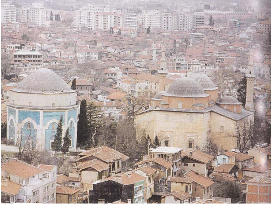
Resim 4. 1950 Sonrası Bursa'nın Genel Görünümü