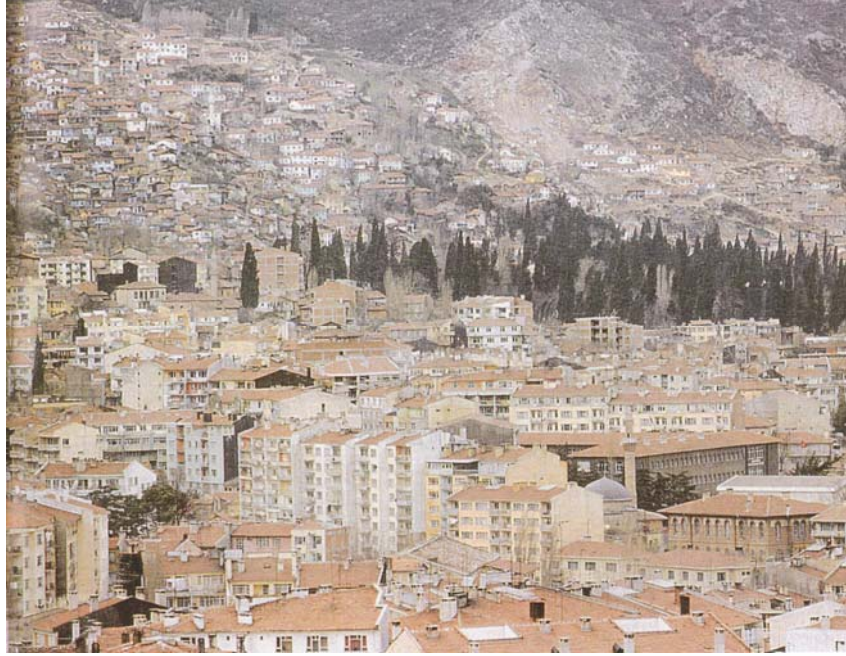
Resim 3. 1950 Sonrası Bursa'nın Genel Görünümü

Osmanlı kent kimliğinin temsil edildiği tarihi doku izlenirken, diğer yandan eskinin bütünsellik anlayışına aykırı bir dikey yapılaşmanın suni bir biçimde kente eklemlendiği görülmektedir (Resim 3-4). Çelişkili gibi görünen bu ön yapı, hala estetik öznenin algı ve hazzına açık pek çok bilgi, duygu vb. ile doludur. Eski kent dokusu oluşturulurken o insanların yaşadıkları ve hissettikleri şeyler tutarlı bir bütünlük içinde, kentin silüetine işlenmişti. Bursa bu anlamda halen derinlikli bir kitap gibidir. Ancak değişen özne olgusu bugün karşımıza bir sorun alanı olarak çıkmaktadır. Bugün çok az insan –bilgi birikimi ve ilgi alanları doğrultusunda- eskinin mesajını algılayabiliyor ve onun sihirli havasını teneffüs edebiliyor. Hakim karakter kazanan fayda eksenli belirlenme ve ekonomik bakış açısı ile meta estetiği, kent ve insanın dönüştürülmesinde belirleyici rol oynamaktadır. Onun için insanlar, tarih ve uygarlıklar birikiminden süzülerek gelen ve söyleyecek çok sözü olan bir çınarı, bir sebili ya da türbeyi hiç fark etmiyorlar. Bu entelektüel derinlik adına çok büyük bir kayıp olarak yorumlanmaktadır. Eğer bu ön yapıyı okuyabilecek ve arka yapıda derinleşebilecek özne üretilemezse, ön yapının zaman içinde yok olması kaçınılmazdır. Modernite sonrası insanının aradığı değerler ve huzur, Osmanlı Bursa'sının mekanlarında gizlidir. Önümüzdeki yıllarda bu mekanların yeniden okunmasının mümkün olacağı umulmaktadır.