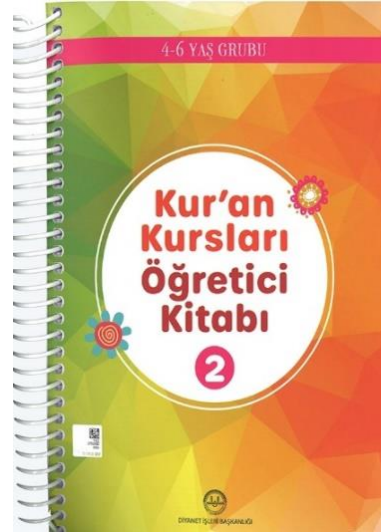
Resim 4 : DİB 4-6 yaş Kur'an Kursları Öğretici Kitabı