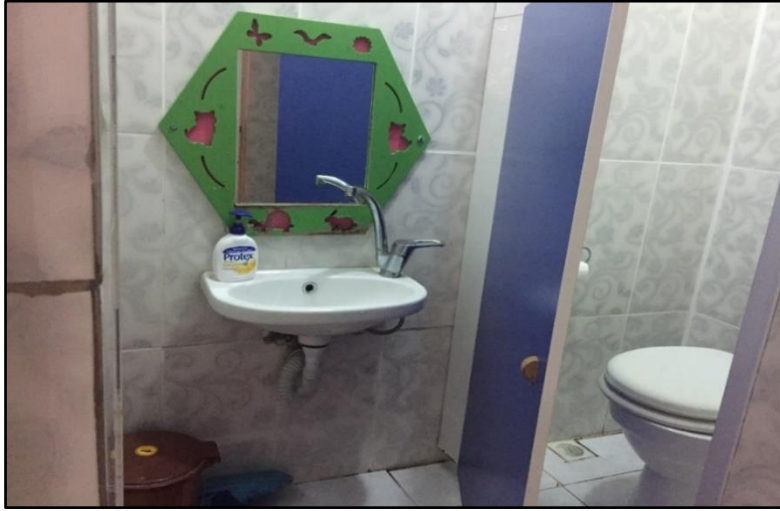
Resim 6: Çocukların boylarına uygun lavabo ve klozet

(Resimler Mudanya Müftülüğü Akşemsettin 4-6 Yaş Grubu Kur'an Kursunda bulunan sınıf donanımlarına aittir.)