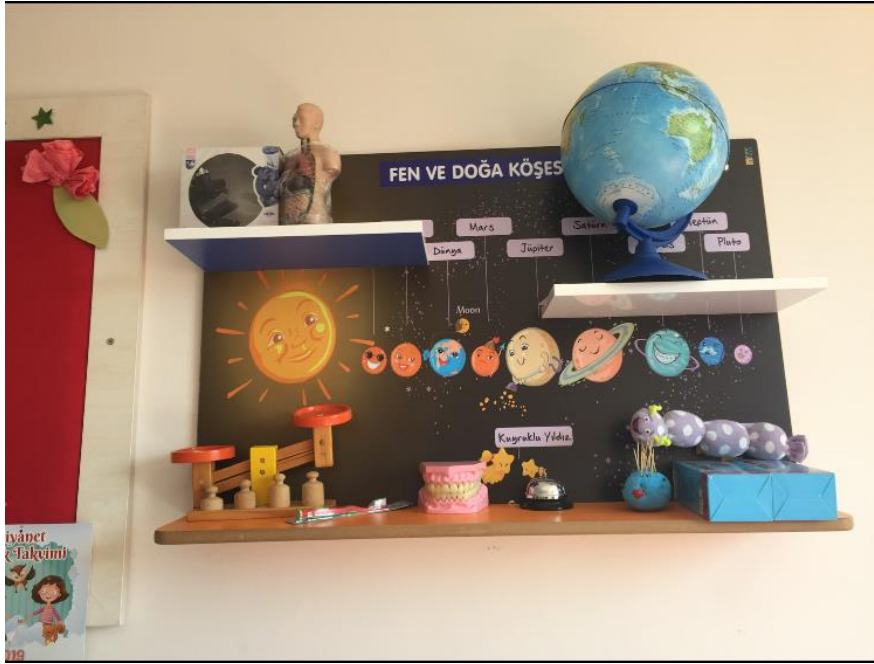
Resim 1: Fen ve Doğa Etkinliklerinde Kullanılan Eğitim Materyalleri

(Resimler Mudanya Müftülüğü Akşemsettin 4-6 Yaş Grubu Kur'an Kursunda bulunan eğitim materyallerine aittir.)