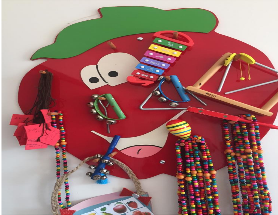
Resim 2: Müzik Etkinliklerinde Kullanılan Ritim Aletleri