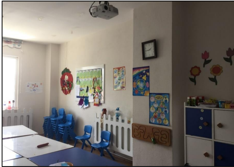
Resim 7: Etkinlik sınıfında bulunan masa, sandalye ve dolaplar