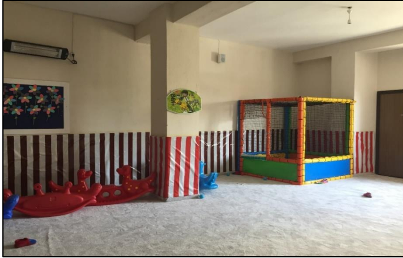
Resim 8: Oyun ve hareket etkinliklerinin uygulandıđı oyun odası