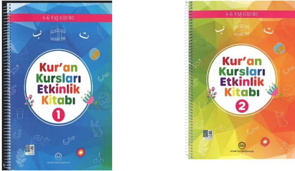
Resim 5: DİB 4-6 Yaş Grubu Kur'an Kurslarında Öğrencilerin Kullandığı Etkinlik Kitapları