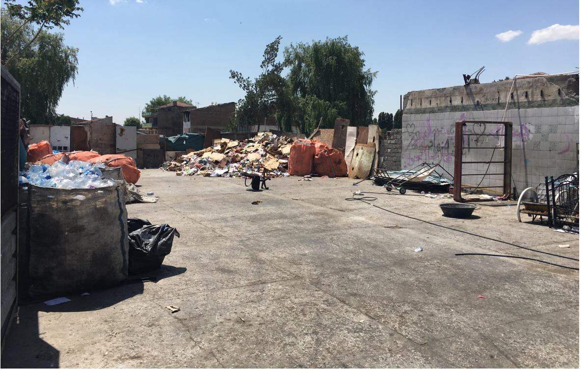
Dikmen’de atık madde toplayıcılarının yaşadığı depo.