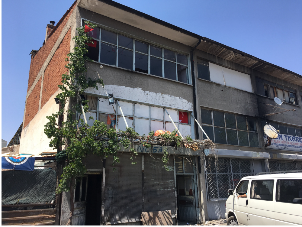
İskitler 'de atık madde toplayıcılarının atıkları ayrıştırdıkları alan.