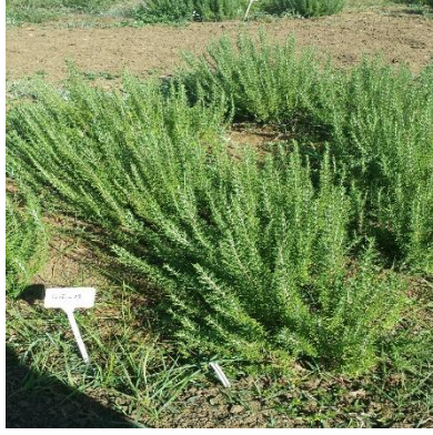
Şekil 3.6. ÇİF-13 klonu genel görünümü