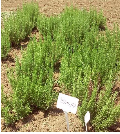
Şekil 3.26. YUM-17 klonu genel görünümü