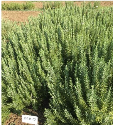
Şekil 3.10. DED-5 klonu genel görünümü