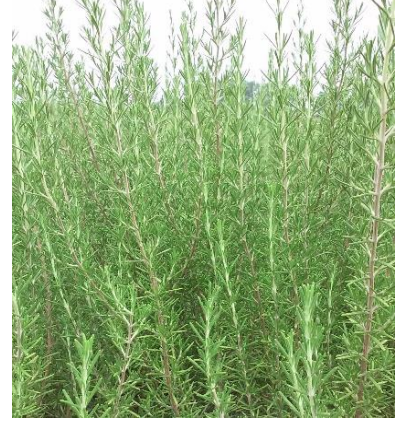
Şekil 3.13. DED-10 klonu yaprak-dal görünümü