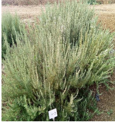
Şekil 3.18. İN-9 klonu genel görünümü