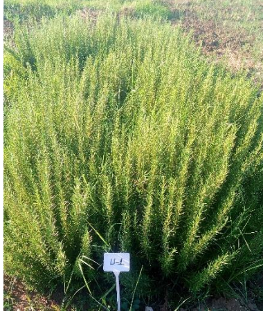
Şekil 3.2. U-1 klonu genel görünümü