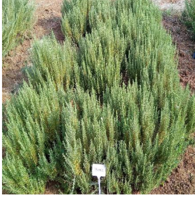
Şekil 3.24. YENİCE klonu genel görünümü