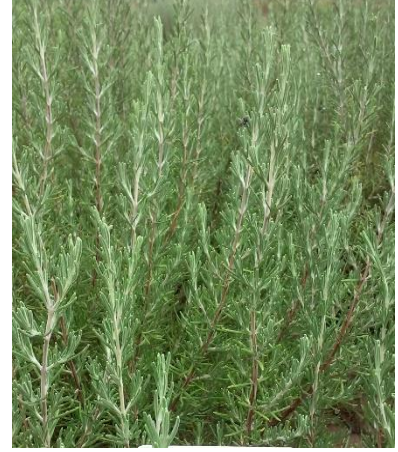
Şekil 3.15. İN-2 klonu yaprak-dal görünümü