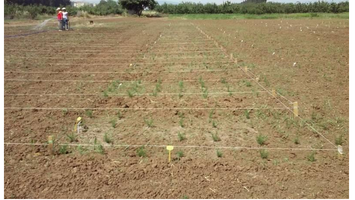
Şekil 3.30. Deneme alanına biberiye ( Rosmarinus officinalis L.) bitkisinin dikilmesi.