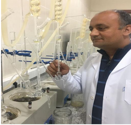
Şekil 3.36. Laboratuvarda Neo-Clevenger apareyi ile biberiye uçucu yağı elde edilmesi.

b-) Uçucu yağ bileşenleri (%): Uçucu yağ bileşiminin belirlenmesinde Gaz Kromatografisi (GC) yöntemi kullanılmıştır. Yöntem, gazların belirli sıcaklıkta ve taşıyıcı bir gazın akış hızında, çözünürlük farkları nedeniyle sıvı gazın içinde ayrılması esasına dayanır. Uçucu yağ bileşen analizi, Yalova Atatürk Bahçe Kültürleri Merkez Araştırma Enstitüsü Gıda Teknolojisi ve Tıbbi Aromatik Bitkiler Bölümü Laboratuvarı'nda bulunan Agilent 5975 C Kapılar Kolonlu Gaz Kromatografi cihazı ile belirlenmiştir. Cihazın çalışma koşulları aşağıda verilmiştir.