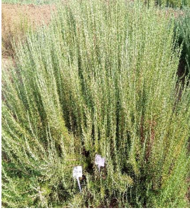
Şekil 3.12. DED-10 klonu genel görünümü