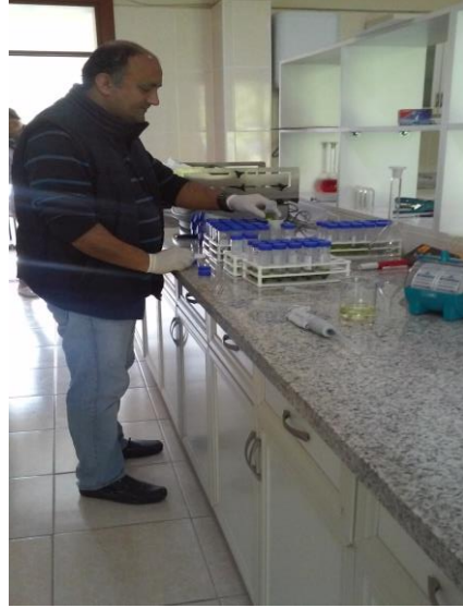
Şekil 3.37. Kurutulmuş yaprak örneği alınması ve metanol eklenmesi.

Ekstraksiyon işleminden sonra hazırlanan metanol ekstraktlarından 0,1 ml alınıp üzerine 0,9 ml distile su eklenmiş ve sırasıyla 5 ml 0,2 N Folin-Ciocalteu çözeltisi ile 4 ml doymuş sodyum karbonat çözeltisi (75g/l) ilave edilmiştir. Tüpler vorteks ile iyice karıştırılıp 2 saat oda sıcaklığında ve karanlıkta bekletildikten sonra 765 nm dalga boyunda metanole karşı okumalar yapılmış ve absorbans değerleri elde edilmiştir.