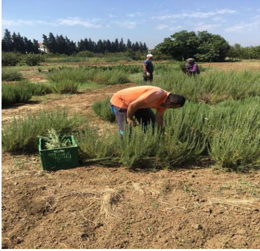
Şekil 3.32. Deneme alanında bitkilerin biçilmesi.

Elde edilen ürün gölgede ve kurutma raflarında sabit ağırlığa gelinceye kadar kurutulmuştur. Kurutulan bitkilerde yaprak ve sap ayrımı yapılmıştır (Şekil 3.5).