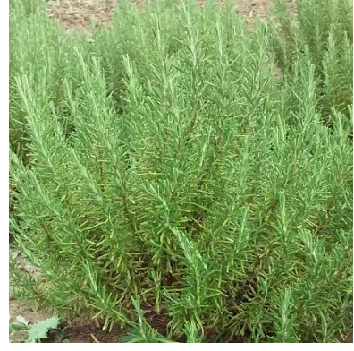
Şekil 3.25. YENİCE klonu yaprak-dal görünümü