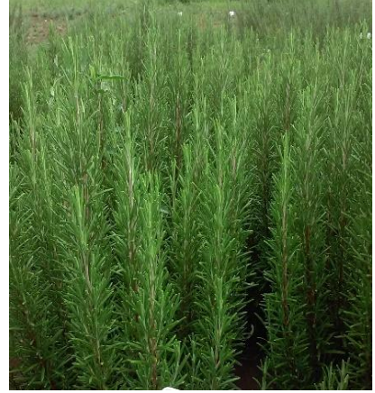
Şekil 3.5. U-2 klonu yaprak-dal görünümü