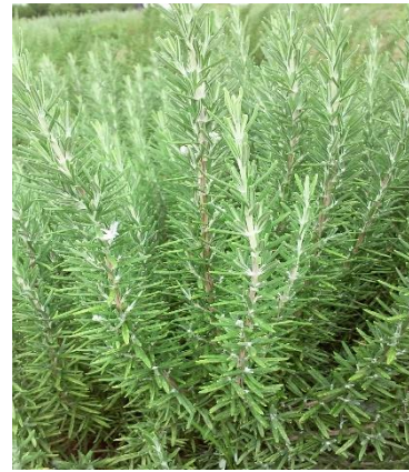
Şekil 3.11. DED-5 klonu yaprak-dal görünümü