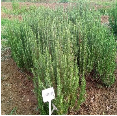
Şekil 3.22. MEL-28 klonu genel görünümü