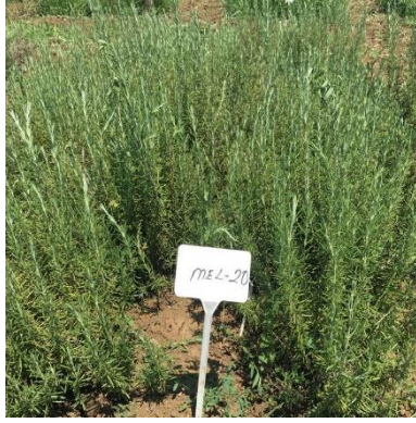
Şekil 3.20. MEL-20 klonu genel görünümü