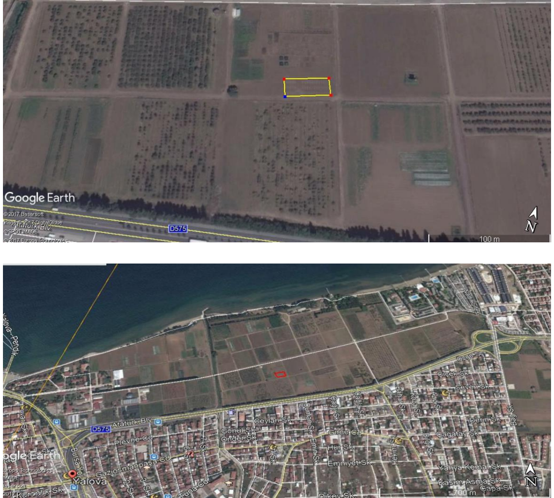
Şekil 3.1. Deneme alanına ait uydu görüntüleri

Bu araştırma 2016-2018 yılları arasında 3 yıl süreyle Atatürk Bahçe Kùltürleri Merkez Araştırma Enstitüsü-Yalova deneme tarlalarında yürütölmüştür. Deneme alanının rakımı 5 metre olup, koordinatları 40^{\circ} 39' kuzey enlem ve 29^{\circ} 17' dođu boylam dereceleri arasındandır (Şekil 3.1).