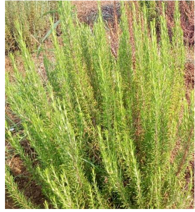
Şekil 3.27. YUM-17 klonu yaprak-dal görünümü