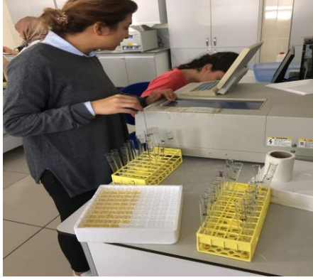
Şekil 3.39. DPPH metodu ile antioksidan kapasite analizinin yapılması.

okuma yapılmış, 25 ve 800 \mu\text{M} Trolox standardı ile hazırlanan kurveden elde edilen formül yardımıyla örneklerin antioksidan aktiviteleri \mu\text{M} Trolox eş değeri olarak hesaplanmıştır (Thaipong ve ark. 2006).