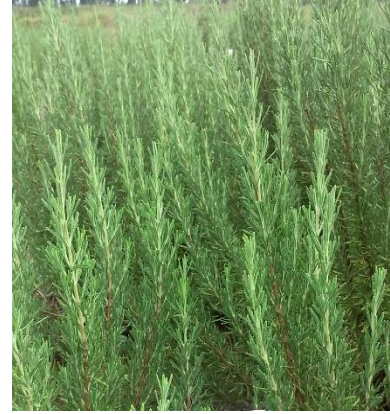
Şekil 3.9. YAK-8 klonu yaprak-dal görünümü