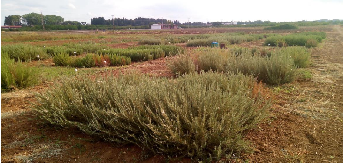
Şekil 3.35. Deneme alanında biberiye ( Rosmarinus officinalis L.) bitkisinin 2018 yılı genel görünümü.