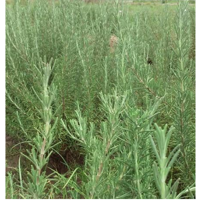
Şekil 3.19. İN-9 klonu yaprak-dal görünümü