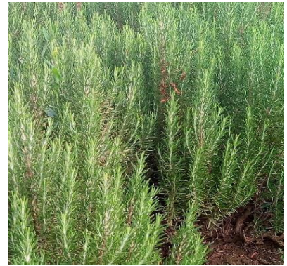
Şekil 3.23. MEL-28 klonu yaprak-dal görünümü