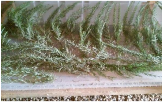
Şekil 3.33. Bitkilerin raflarda kurutulması.