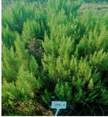
Şekil 3.8. YAK-8 klonu genel görünümü