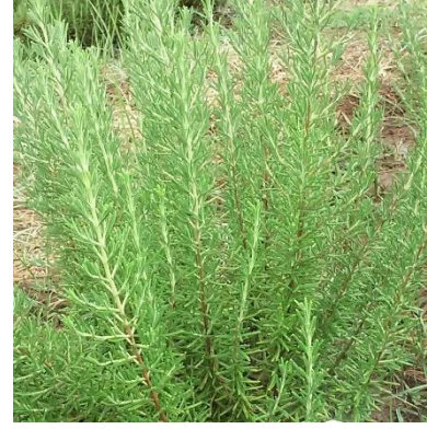
Şekil 3.7. ÇİF-13 klonu yaprak-dal görünümü