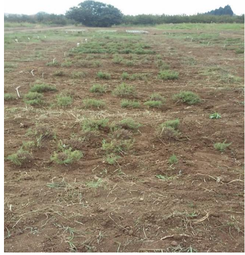
Şekil 3.34. İlk yıl biçim öncesi ve sonrasında deneme alanı görüntüsü