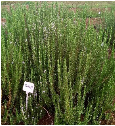
Şekil 3.28. YUM-18 klonu genel görünümü