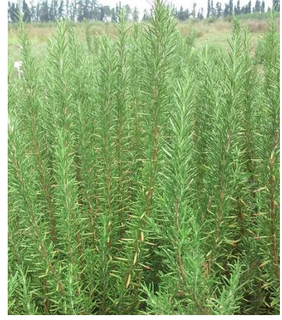
Şekil 3.3. U-1 klonu yaprak-dal görünümü