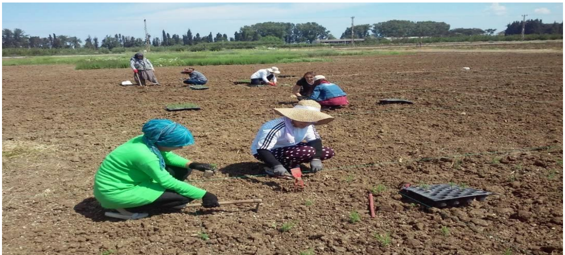
Şekil 3.31. Deneme alanına dikimle birlikte gübre verilmesi.