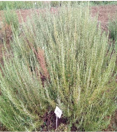
Şekil 3.16. İN-3 klonu genel görünümü