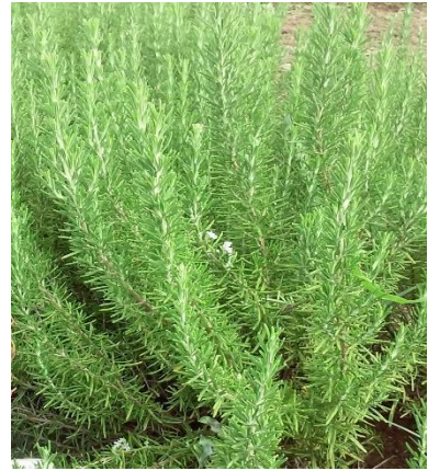
Şekil 3.29. YUM-18 klonu yaprak-dal görünümü