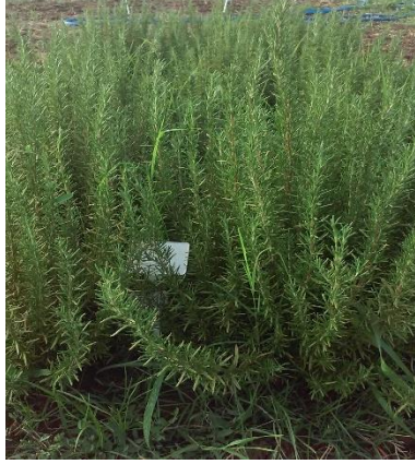
Şekil 3.4. U-2 klonu genel görünümü