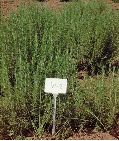
Şekil 3.14. İN-2 klonu genel görünümü