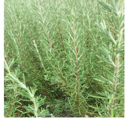
Şekil 3.21. MEL-20 klonu yaprak-dal görünümü