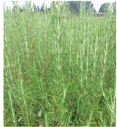
Şekil 3.17. İN-3 klonu yaprak-dal görünümü