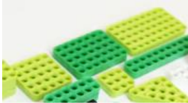
Robotis seti plakaları