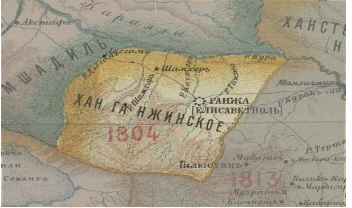
Şekil 1. Gence Hanlığı'nın Haritası – 1804 yılı