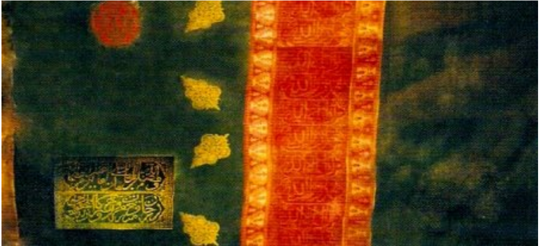
Şekil 7. Gence Hanlığı'nın İşgali Esnasında Ele Geçirilen Savaş Bayrağı