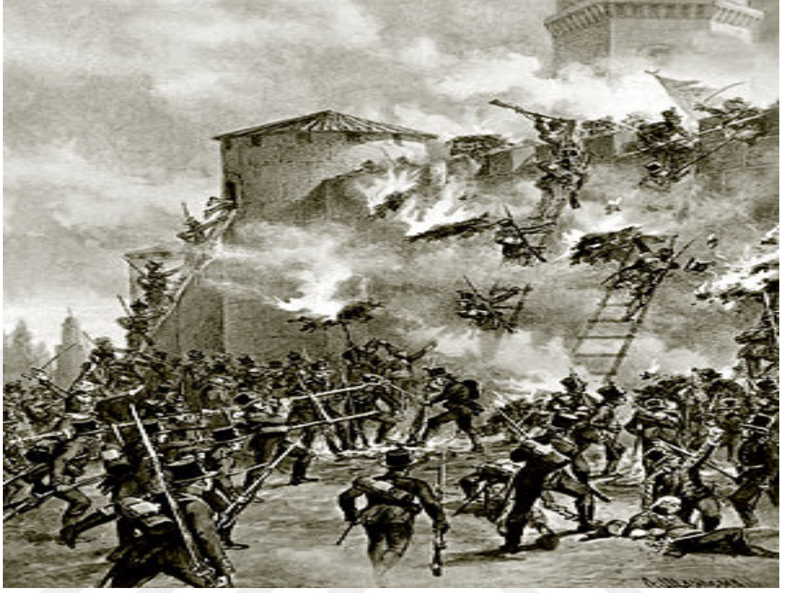
Şekil 6. Gence Kalesi'nin Ruslar Tarafından İşgali