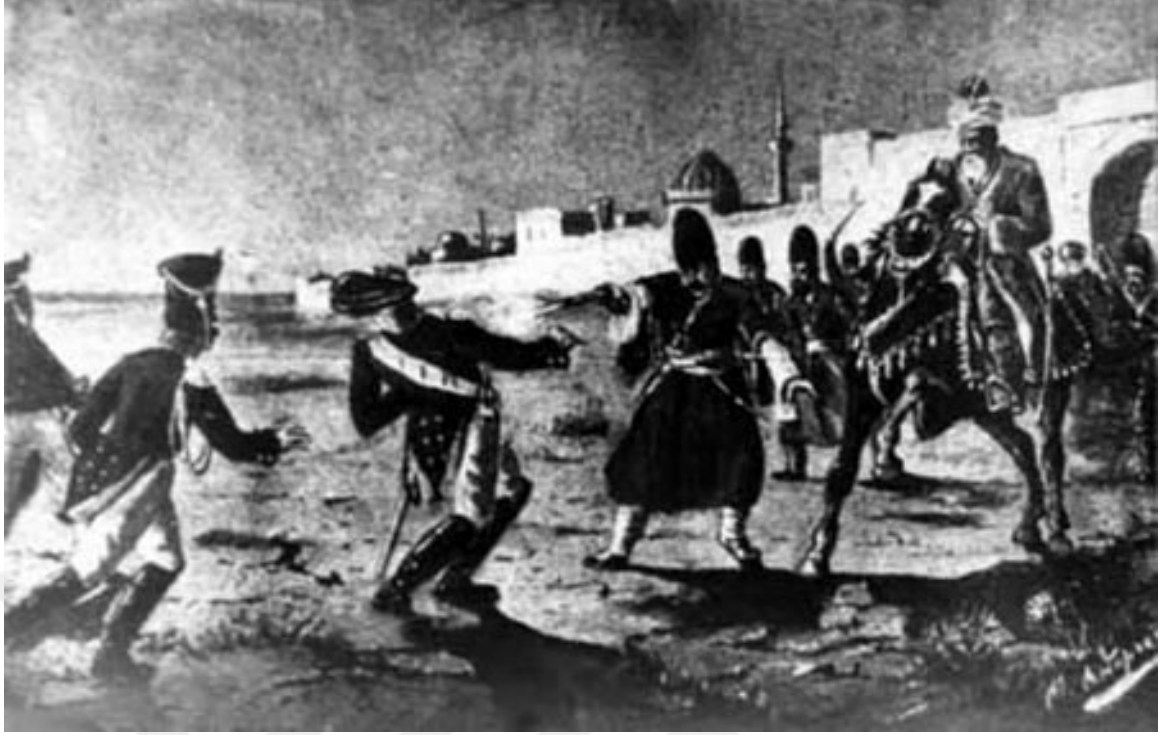
Şekil 8. General Sisianov'un Öldürülmesi - 8 Şubat 1806