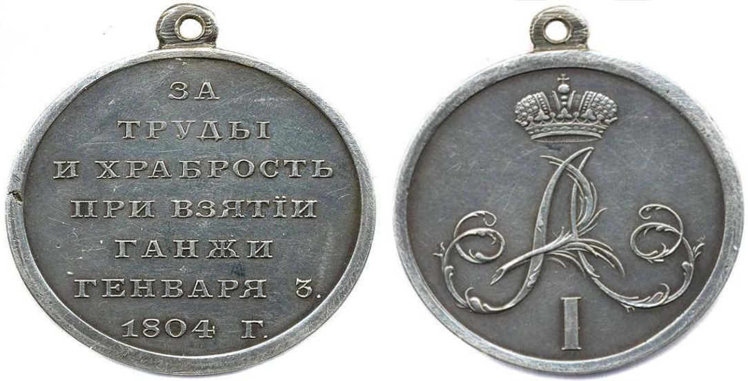
Şekil 9. Gence Hanlığı'nı İşgal Eden Askerlere Verilen Madalyon