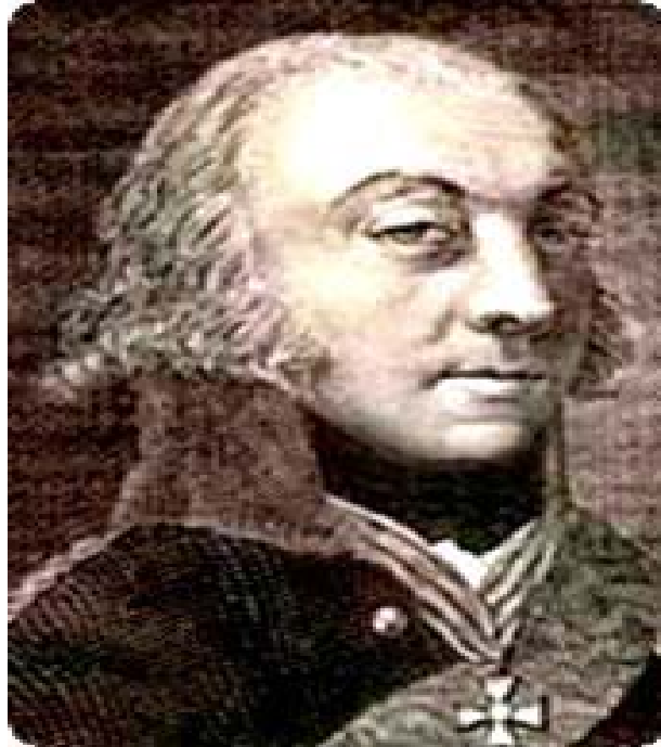
Şekil 4. General Pavel Dmitriyeviç Sisianov