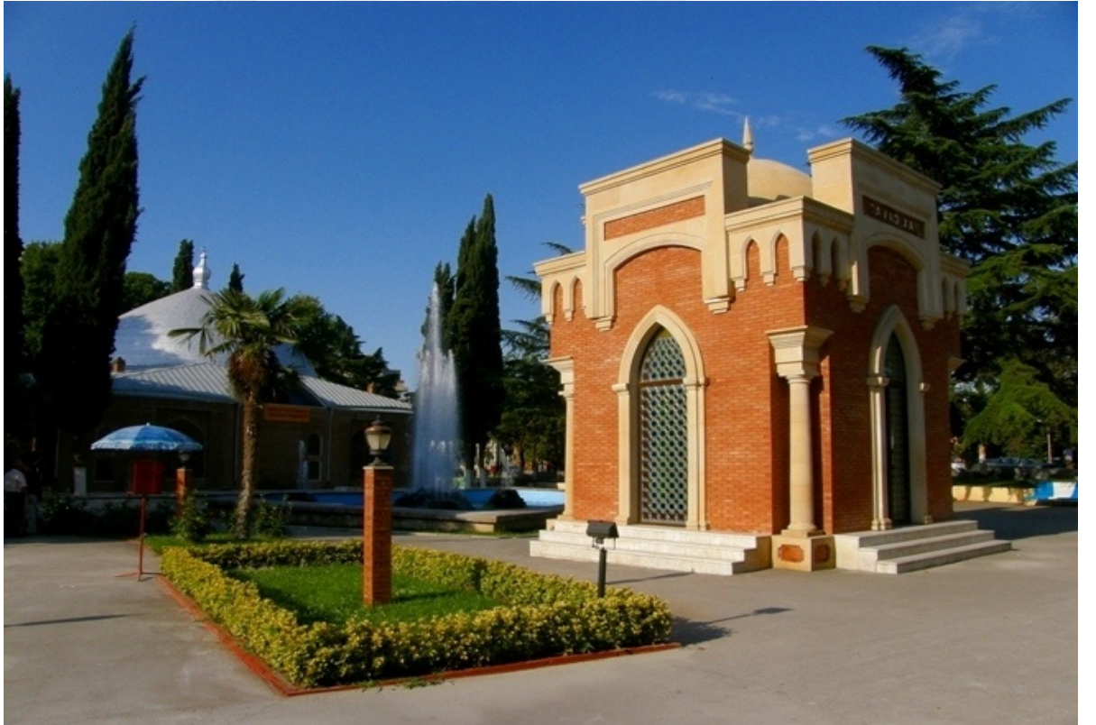
Şekil 2. Cevad Han Türbesi