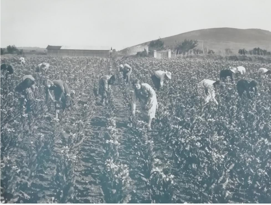
Ek 5: Sak üzerinde muhtelif seviyede bulunan yaprakların, yani “el”lerin idrak zamanı.