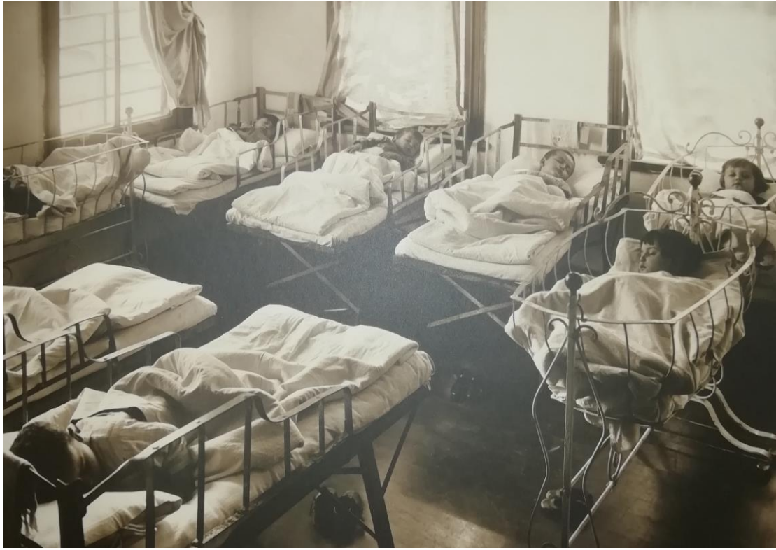
Ek 12: Fabrikada çalışan annelerin çocuklarını bıraktığı fabrikaya mahsus yuva. Celâl Bayar Vakıf Kütüphanesi, Türk Tütünü-T.C. İnhisarlar Albümü, no.95.