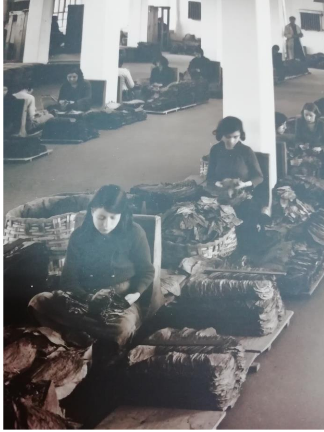
Ek 15: Şemsi Paşa depo ve imalathanesinin yaprak tütün işleme salonu.