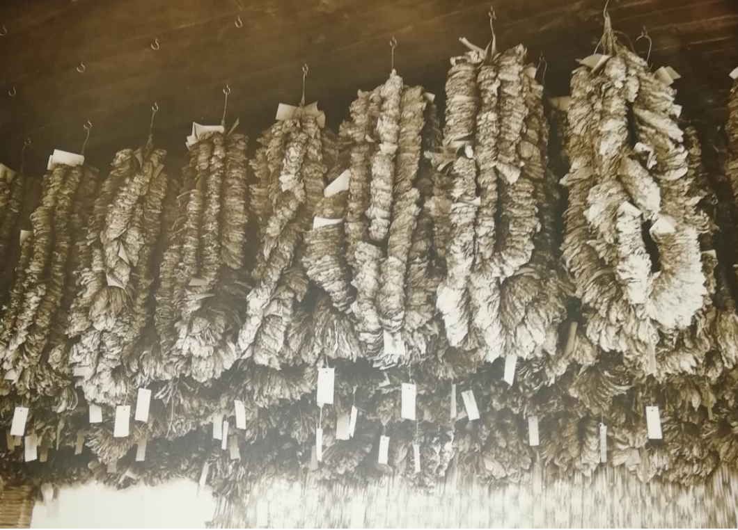
Ek 8: Tütünün muhafazası. Ek-7: Kurutulan tütünlerin muhafazası.