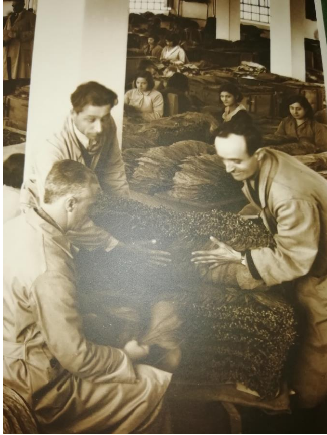
Ek 14: Şemsi Paşa depo ve imalathanesinin yaprak tütün işleme salonu.