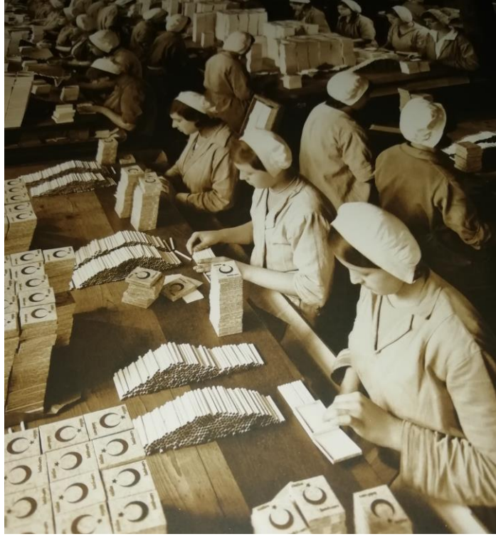
Ek 13: Sigara sarma işlemi.