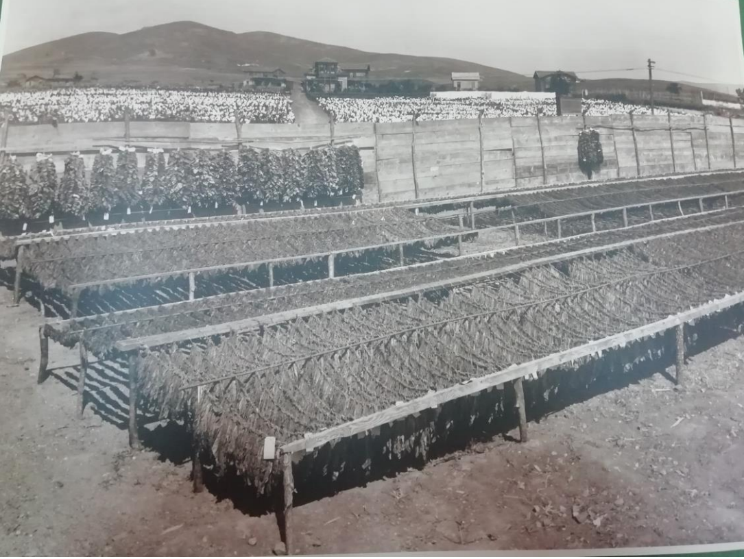
Ek 7: Tütünün kurutulması.