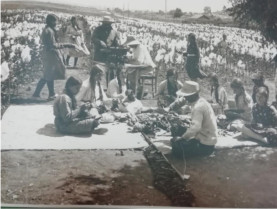
Ek 6: Tütünün ipe dizilmesi. Kaynak: Celâl Bayar Vakıf Kütüphanesi, Türk Tütünü-T.C. İnhisarlar Albümü, no.95.