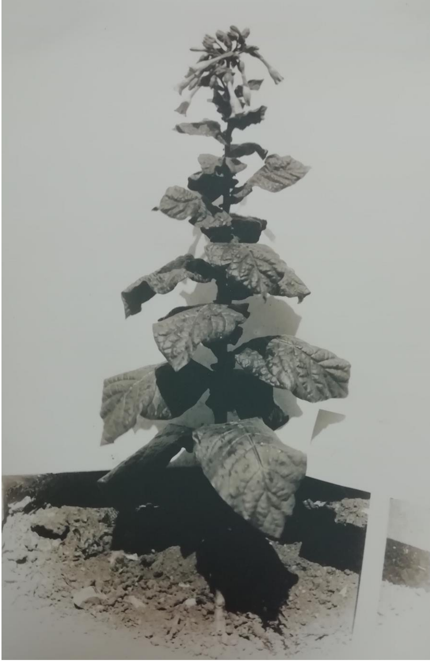
Ek 4: Tütün Bitkisi