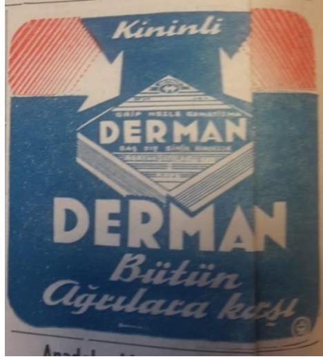
Vatan , 20 Şubat 1954