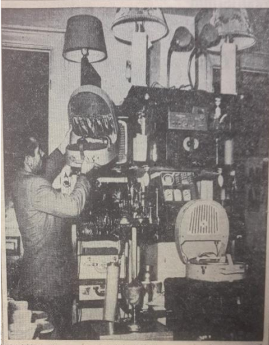
Selâmlindeki Amerikan eşyası satan dükkanlardan birinin içi. (Foto: Hürriyet - A.15)