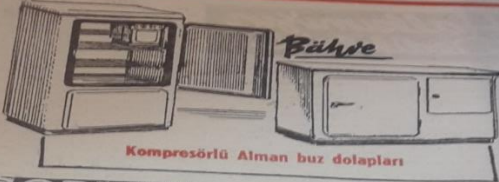
Kompresörlü Alman buzdolapları