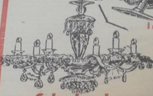
Çekoslovakyanın kristal avizeleri