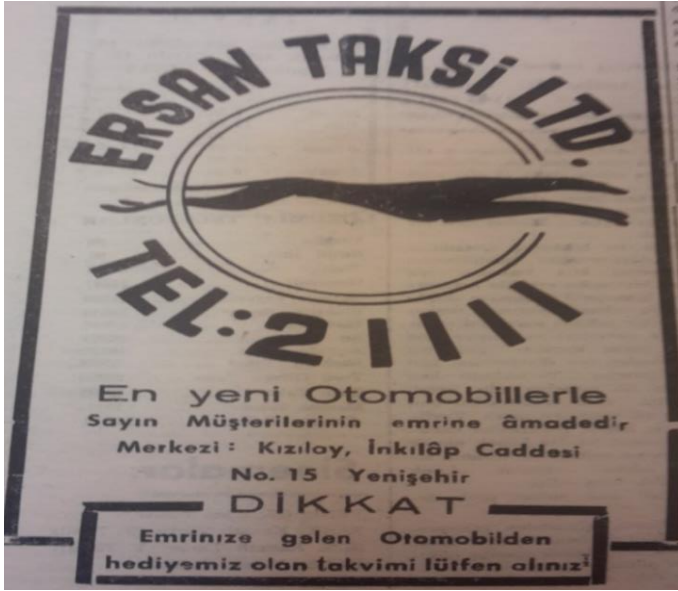
Yeni Sabah , 11 Mart 1958

Uludağ Üniversitesi Fen-Edebiyat Fakültesi Sosyal Bilimler Dergisi Uludağ University Faculty of Arts and Sciences Journal of Social Sciences Cilt: 18 Sayı: 33 / Volume: 18 Issue: 33