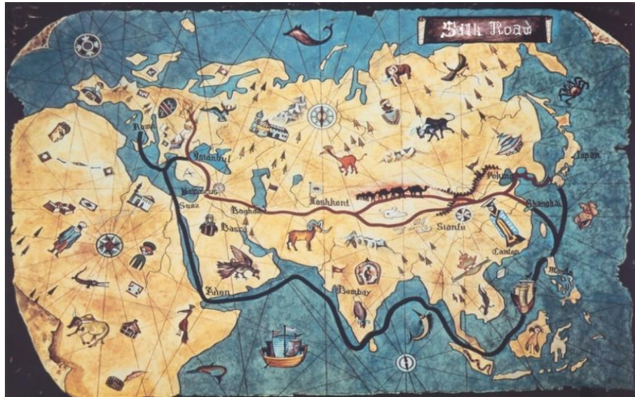
Şekil. 2.1. Anadolu'da ipek yolunun geçtiği bölgeler (Anonim 1991)

1845 yılında Bursa'da buharla çalışan ve 60 mancınığı bulunan ilk Harir (İpek) Fabrikası kurulmuştur. Bursa, Bilecik ve İzmit dolaylarında kurulan ipek çekme fabrikaları 1860 yılına kadar büyük gelişme göstererek sayısı 85'e, ipek dokuma tezgahlarının sayısı ise 5000 adete ulaşmıştır (Karaca 2008, Kozabirlik 2016).