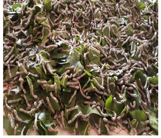
İkinci yař dönemindeki larvalar