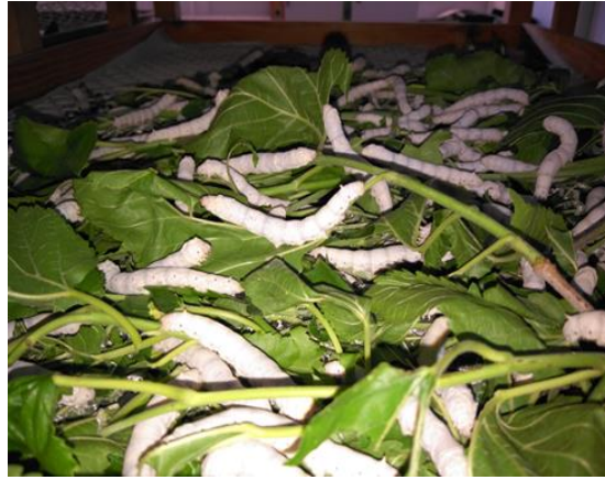
Beřinci yař dönemindeki larvalar