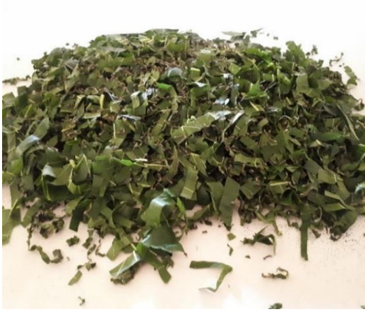
Birinci yař dönemindeki larvalar