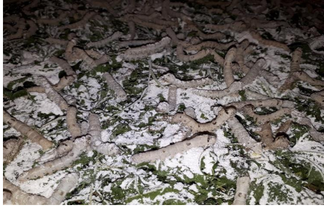
řekil 3.3. Kireç tozu uygulaması yapılan ipekböceęi larvaları

Her deri deęiřtirme devresinde besleme yataęına ve larvaların üzerine sönmiř kireç tozu serpilerek toplamda dört defa kireç uygulaması yapılmıřtır. Uyku devresinde sönmiř kireç tozu serpilmesinde böceklerin %20'sinin uyanması (deri deęiřtirmesi) beklenmiřtir. Kireç tozu uygulanmasının amacı, besleme yataęının nemini düşürmek ve çeřitli patojen ve mikroorganizmaların yanı sıra özellikle sütleme, gibi sık görülen ipekböceęi hastalıklarının oluřumunu ve dięer böceklere bulařmasını engellemektir.