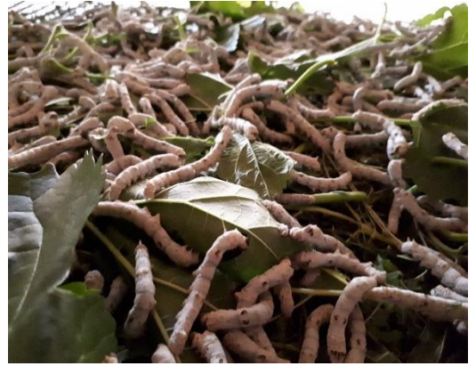
Dördüncü yař dönemindeki larvalar