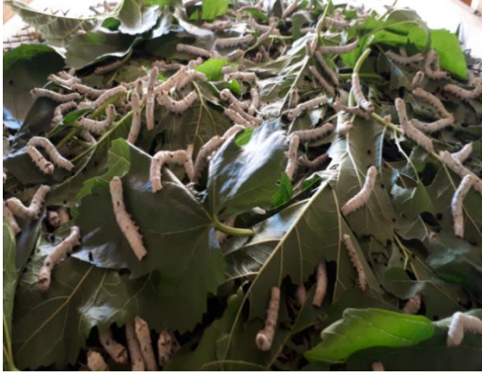
Üçüncü yař dönemindeki larvalar