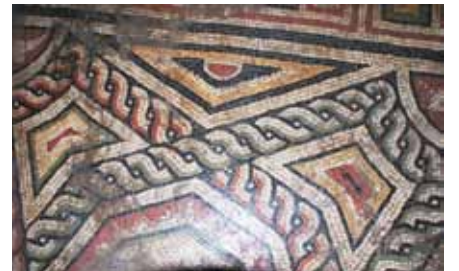
Resim 8 Haç Kollarındaki Trapez Şekiller

Haç kollarının dar kenarlarında yer alan konkav trapez şekillerin yükseklikleri 39-41 cm, dar konkav kenarları 27-30 cm, geniş kenarları içe doğru "V" şeklinde kırık 52-54 cm.ler arasında değişen boyutlardadır. Genel olarak farklı renklerde (sarı, kırmızı, beyaz, yeşil ve siyah renklerin sıraları değişmekte) iç içe küçülen boyutlarda tekrarlanan trapezlerden oluşmaktadır. Ancak, çapraz durumdaki iki haç kolunda yer alan trapezler farklı dizaynda işlenmiştir. Bunlardan birinin içi dama motifi ile diğerinin içi ise yatay çizgi desenlerle doldurulmuştur. Olasılıkla duvarların altında kalan ve bizim görme şansına sahip olmadığımız trapezler de bunlara benzemektedir.