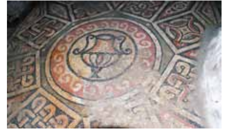
Resim 14 Sekizgen göbek

Kantharosu kuşatan siyah çemberin dış tarafı kırmızı ve beyaz renkli ters ve düz dalga motifleri ile çevrilmiş, dalga motifleri ise siyah konturlu beyaz renkli dairevi bir bant ile kuşatılmıştır. Bu dairevi beyaz bant ile sekizgen arasındaki zemin yeşil renkte gösterilmiş ve sekizgenin köşelerine beyaz nokta şeklinde rozetler konmuştur. Sekizgenin kenarlarında beyaz renkli 60 x 62 cm. boyutlarında kareye yakın çerçeveler içerisine antrolac desenler yapılmıştır. Bu antrolac desenler ile tüm panoyu dıştan kuşatan beyaz kare çerçevenin dört bir köşesine 37 x 105 cm. ölçülerinde baklava dilimi biçimli motifler yerleştirilmiştir. Her yüzeyin ortasına iki antrolac çerçeve arasına birer eşkenar üçgen, kenarlara ise ikişer adet alınlık türü iç içe üçgen şekiller (batı yöndeki gözüküyor) yapılarak panoya çarpıcı bir görsellik kazandırılmıştır.