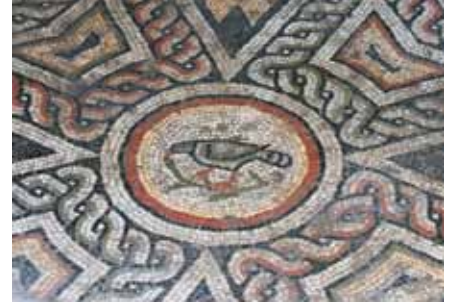
Resim 5 Kuş Figürlü Merkezi Daire

Ana panonun merkezini oluşturmaktadır. Dış çapı 62 cm., iç çapı 37 cm. olan ana panonun orta noktasını oluşturmaktadır. Dıştan içe doğru siyah konturlu beyaz, kırmızı ve sarı renkte iç içe dairelerin ortasında beyaz zemin içerisinde, ağaç dalının üstüne tünemiş ve dalı gagalayan güvercin figürlüdür. Güvercinin ayakları kırmızı, vücut hatları ve kanatları siyah renkli olarak belirtilmiş, ağaç dalı ise yeşil olarak gösterilmiştir.