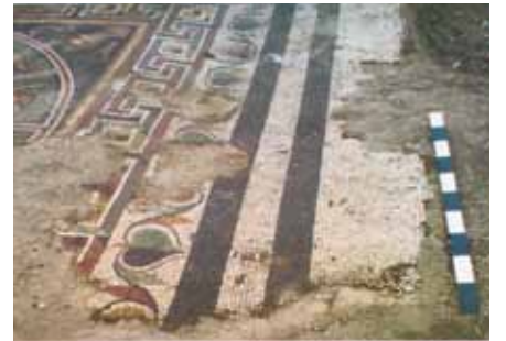
Resim 33 Meanderli bordür