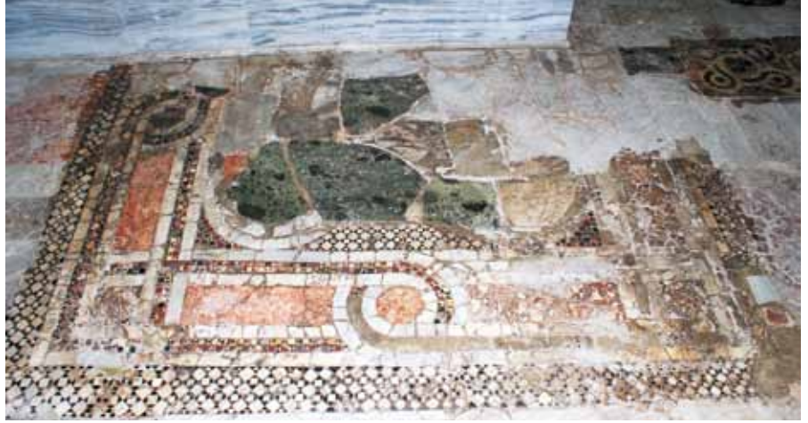
Resim 26 Bordürlü Pano

taşların düğümlü mermer çerçeveler içerisinde gösterilmesiyle oluşturulmuştur. İki mermer şerit arasından mozaik kuşak geçirilerek dizayn edilen düğümlü mermer çerçevelerin kuzey ve doğu yönlerde olanları günümüze bozulmadan ulaşmış, diğer kısımları ise deformasyona uğramıştır. Mermer çerçevelerin keşişme noktalarında kare şekilli metoplar oluşturularak içerisine yuvarlak kesitli alaca renkli taşlar konmuştur. Bu çerçevenin içerisinde ise olasılıkla antrolac bir düzenleme merkezi motif olarak kullanılmıştır. Ancak bu merkezi motif büyük oranda deforme olduğundan günümüze ulaşmamıştır.