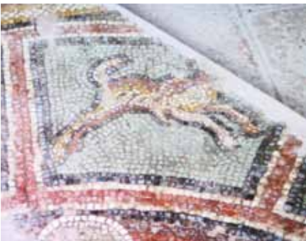
Resim 29 Oğlak Burcu

ile çevrilmiş olan ana pano, sarı ve kırmızı renkte iç içe kare çerçeve içerisinde gösterilmiştir. Kare çerçeve ise, meander motifli bir bordür, yürek biçimli sarmaşık yapraklı bir kuşak ve en dışta da ortası beyaz birbirine paralel iki siyah şerit ile sınırlanmıştır.