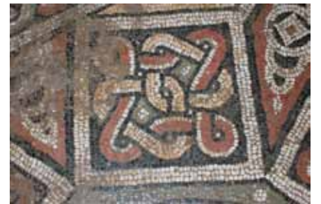
Resim 16 Oval Üçgenli Antrolac

Ana panoyu sınırlayan kare çerçevenin dört bir köşesinden başlayarak, ortada bulunan sekizgen şeklin köşegenlerine kadar uzanmakta ve içlerinde saat kordonunu andıran desenleri genel hatlarıyla birbirlerine benzemektedir. Desenler; siyah konturlu, kırmızı zemin içerisinde, ortasında 3'ü eşkenar dörtgen, 1'i kum saati motifli, beyaz renkli merkezi dairevi şekle her iki taraftan bağlantılı