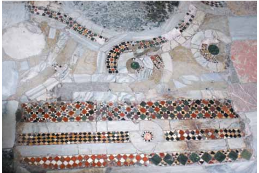
Resim 24 Ana panoyu sınırlayan opus sectile bordür

Ana panoyu batı yönden sınırlayan bu bordür, kuzey-güney doğrultuda mermer düğümlü ve üç sıra mozaik şerit takviyelidir. 50 cm. genişliğinde, günümüze kalan uzunluğu 163 cm. olarak ölçülebilmektedir. Mermer düğümlü şeridin merkezinde bulunan dalgalı kırmızı renkli yuvarlak taşın çevresi siyah ve beyaz