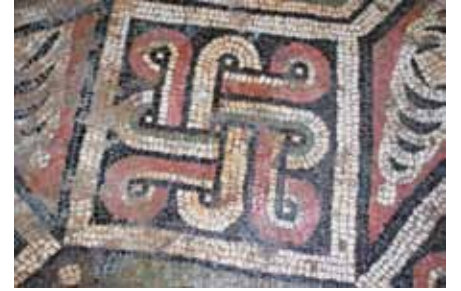
Resim 15 Antrolac desen

Her yönde ikişer adet olmak üzere, beyaz kare çerçeveli, siyah zemin içerisinde gösterilmiş ve sekizgenin köşegenlerine göre konumlandırılmışlardır. Antrolac desenlerin 5 adedi (2 doğu, 1 batı, 1 kuzey ve 1 güney yöndekiler) birbirine benzemekte, 3'ü ise dizayn itibarıyla birbirlerinden ayrılmaktadır. Benzer desenler, kare çerçevenin köşelerine uygun, kare formlu, köşeleri oval şeritlerin ilmekler halinde birbirine geçirilmesi ile Süleyman düğümü şeklinde oluşturulmuştur. Benzer olmayan antrolac desenlerden güney yönde olan antrolac , hasır örgüsü şeklindedir. Kuzey yönde olan, dört köşesi düğümlü konkav dörtgen şeride, çapraz durumda birbirine geçmiş, köşeleri oval iki üçgenin dolaştırılmasıyla oluşturulmuştur (Resim 16). Batı yöndeki ise, merkezinde bulunan konkav kare şeklin kenarlarına uyumlu kavis yapan şeritlerin, dairevi şekle alttan ve üstten geçirilmesiyle dizayn edilmiştir (Resim 17).