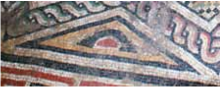
Resim 11 Üçgen şeklindeki Alınlık Motif

Haç kollarının uç noktalarında, tabanı 125 cm., yüksekliği 32 cm. ölçülerinde beyaz çerçeveli, iç içe, küçülen boyutlarda kırmızı, siyah konturlu yeşil ve sarı renkte yarım yuvarlak desenlerden oluşmaktadır. Siyah konturlu yeşil renkli bandın dışına, kırmızı banda doğru beyaz renkte güneş ışınlarını simgeleyen radyal motifler işlenmiştir.