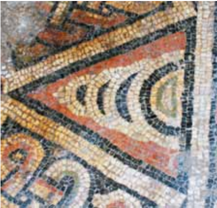
Resim 19 İkizkenar Üçgen