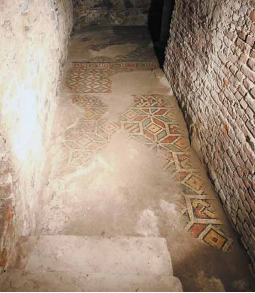
Resim 1 Yerkapı mozaikleri Koridorlu Alan