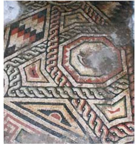
Resim 6 Kalkan biçimli haç

1.70 x 1.80 m. boyutlarında, merkezi kuş figürlü dairevi şeklin kenarlarında asıl motif olarak işlenmişlerdir. Dört adettir. Giyöş bordürlüdür. Haç kollarının uçları konkav olup iki kenarı kuş figürlü merkezi daireye, iki kenarı da meanderli bordürün kenarındaki iç içe yarım yuvarlaklardan oluşan tezyinata teğettir. Kalkan şekilli yatay ve dikey haç kollarının birbiri ile kesiştiği orta noktada iç içe sekizgenlerden oluşan kuş figürlü madalyon işlenmiş, kenarları ise konkav trapez şekillerle dizayn edilmiştir. Giyöş lu bordürler, madalyonların yer aldığı orta bölümde birbirine alttan ve üstten geçmiş olarak ( antrolac dizaynda) gösterilmiş, yatay kollardaki giyöş lar siyah konturlu yeşil ve beyaz renkler ile dikey kollardaki giyöş lar ise kırmızı ve beyaz renkli olarak belirtilmiştir.