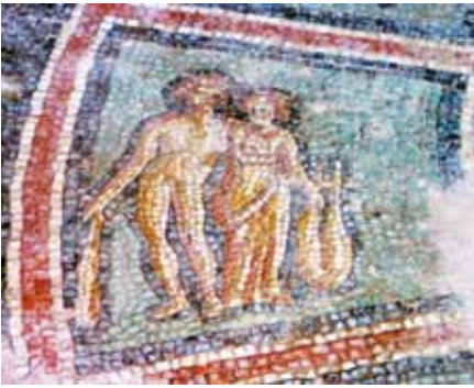
Resim 28 İkizler Burcu