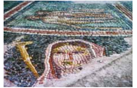
Resim 32 Kış mevsimi personifikasyonu