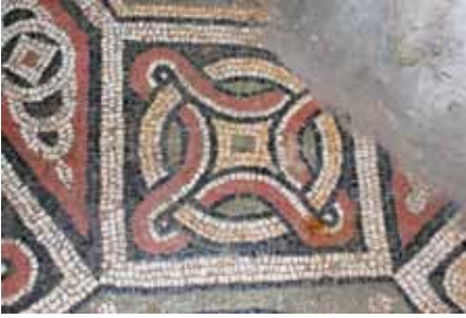
Resim 17 Daire ve Konkav Kare Şekilli Antrolac