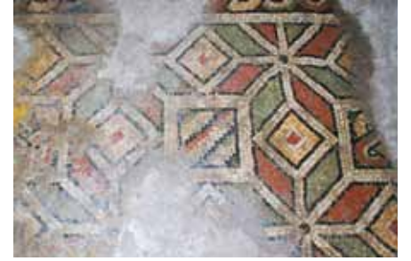
Resim 2 Sekiz kollu yıldız desenleri kare, eşkenar dörtgen ve altıgen şekiller