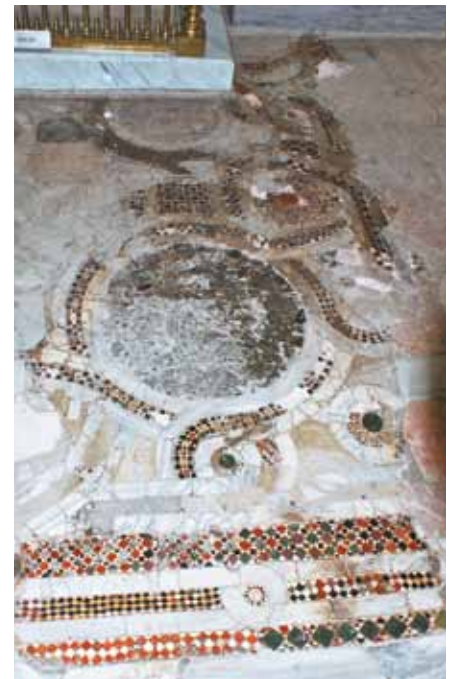
Resim 23 Ana Pano

Üst paragrafta da belirtildiği gibi, bir bölümü Orhangazi'ye ait mezarın altında kalan, 65 cm. çapındaki siyah ve koyu yeşil damarlı plaka ile başlamaktadır. Bu renkli plakanın çevresi beyaz mermer bir kuşakla çevrilmiş, bu çerçeve ise üç sıradan ibaret üçgen formlu yeşil ve kırmızı renkli mozaiklerle kuşatılmıştır. Ancak kuşak büyük oranda noksan olup dairevi şekli tamamlayamamaktadır. Bu bezemenin güney kesimi, volüt biçimli şerit ile sarılmış antrolac bir düzenlemeden oluşmaktadır. Antrolac 'ın düğüm kısmını oluşturan koyu yeşil yuvarlak taşın çevresi üçgen taşlarla (deforme olmuş) doldurulmuş, bunu kuşatan şeridin kenarları ise koyu yeşil ortası kırmızı renkli baklava dilimi biçimli taşlarla dizayn edilmiştir. Bu şeridin orta kısmı noksandır ve noksan kısımda kiremit tozu katkılı horasan harç gözükmektedir. Bu da tesseraların horasan harcın üzerine dizildiğini göstermekte ve buradaki mozaiklerin yapım tekniği hakkında bizlere bilgi vermektedir. Bu bezemeden ana panonun merkezini oluşturur ve zeminde görülen en büyük çaplı yuvarlak (98 cm.) plakaya geçişte, bu plakanın doğu kenarını saran mozaik şeride teğet durumda, 29 x 29 cm. ebatlarında kenarları konkav bir kare şekil içerisindeki koyu yeşil ve kiremit kırmızısı renkli kare şekilli taşlardan oluşan bir dama motifli bulunmaktadır. Dama motifinin güneyinde ise iki mermer şerit arasında bir oyun zarının beşinci yüzü şeklinde (dört yeşil kare şeklin ortasında bir kırmızı kare) dizayn edilmiş mozaik bir bantla ayrılmış