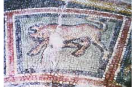
Resim 30 Boğa Burcu

Zodiac kuşaklı mozaik üzerinde, tanrı ve tanrıça figürleri ile kentaur ve Musa figürleri gibi mitolojik ve pagan unsurlar içermektedir. Bu durum, mozaiklerin yapım tarihini Hıristiyanlık öncesi bir döneme taşımaktadır. Güneş Tanrısı Sol ise, nümizmatik biliminde M.S. 3. yüzyılda ortaya çıkan bir betimdir; ancak mozaikler üzerinde daha önceki dönemlerde de görülebilmektedir. Gerek bu özellikler gerekse mevsimlerde gösterilen kadın büstü personifikasyonlardaki kabarık saç, alnı ortasından ikiye ayrılarak arkaya doğru toplanan ve alnı üçgen gösteren saç stili ise M.S. 2. yüzyıl sonu ve 3. yüzyıl başına ait özellikler olup, zodiac kuşaklı mozaiklerin tarihlendirilmesi aşamasında bu kriterlere dikkat edilmelidir.