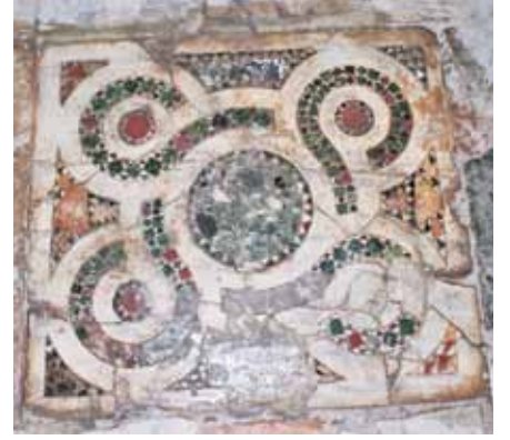
Resim 25 Küçük antrolac çerçeve

renkli ters ve düz üçgen kesimli mozaiklerle kuşatılarak rozet şekline dönüşmüştür. Rozet motifinin her iki tarafında mevcut mozaik şerit birbirinden farklı olup güneyindeki mozaik kuşak, iki kırmızı iki siyah renkli baklava dilimi biçimli taşlar ile aralarda oluşan sarı ve beyaz renklerde yine baklava dilimi biçimli taşlarla dizayn edilmiş, kenarlarda ise sarı ve beyaz renkli üçgenlerle doldurulmuştur. Kuzeyindeki kuşak ise, aynı renklerde, diğerine göre bir sıra daha fazla baklava motifleri ilave edilerek aynı tarzda yapılmıştır. Bordürün iç tarafında ana panoyu sınırlayan mozaik şerit, kırmızı ve koyu yeşil renkli üç sıra baklava dilimli motif ile bunların aralarında oluşan siyah, koyu yeşil, kırmızı ve turuncu renkli karelerle şekillendirilmiş, karelerin çevresi sarı renkli üçgenlerle doldurulmuştur. Bordürün dış tarafındaki şerit ise, iki bölümden ibaret olup kuzey kesimi, ortası beyaz kenarları bir sıra kırmızı baklava dilimleri ile güney bölümü ise, bir sıra koyu yeşil renkte eşkenar dörtgen dizisi ve aralarda oluşan renkli üçgen kesimli taşlarla dizayn edilmiştir.