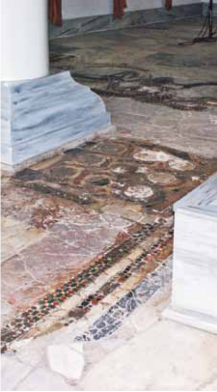
Resim 21 Ters "L" durumundaki Bordür