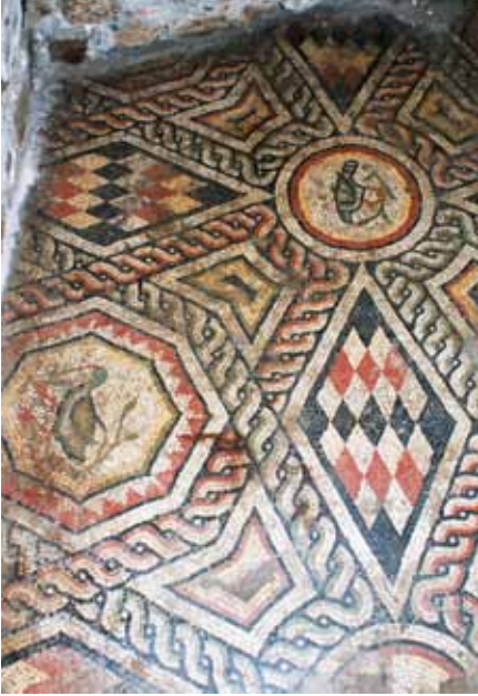
Resim 9 Baklava Şekilli Motifler

Meanderli bordür ile ana pano arasına, bordürün kuzey bitişiğine paralel biri siyah, biri beyaz olmak üzere iki bant çekilmiş, ana pano ile bordür arasında oluşan boşlukları doldurmak için de beyaz banda bağlantılı, bir alınlık ve bir yarım daire şekilli, üç kez tekrarlanmış (görülebilin) desenler yapılmıştır. Her iki desende dış konturları beyaz renkli çerçeveler ile gösterilmiştir.