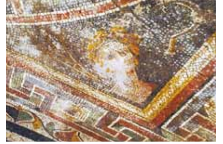
Resim 31 Yaz mevsimi personifikasyonu