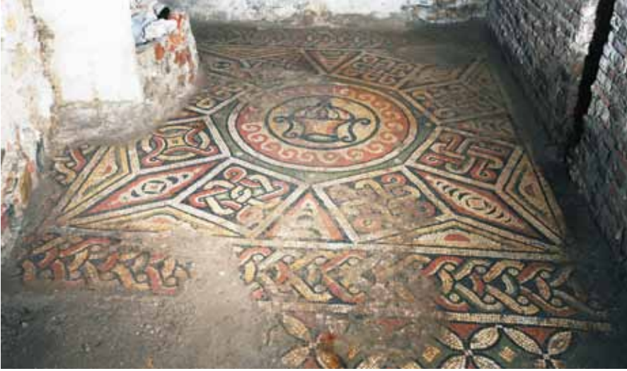
Resim 13 Kantharoslu Alan