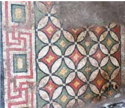
Resim 20 Kesişen daireler

değişen sayıda yarım halkalardan oluşmaktadır. Kuzeybatı köşedeki desen, merkezi dairevi şeklin ortasında içi kırmızı-beyaz renkli eşkenar dörtgenden oluşmakta, iki yarım halka bağlantılı ve uçları badem şekillidir. Kuzeydoğu köşedeki desen, merkezi elips şeklin ortasında beyaz renkli eşkenar dörtgenden oluşmakta, dört yarım halka bağlantılı ve uçları topuz şekillidir. Güneybatı köşedeki desen, merkezi dairevi şeklin ortasında sarı renkli kum saati motifinden oluşmakta, üç yarım halka bağlantılı ve uçları top şekillidir. Güneydoğudaki desen, merkezi dairevi şeklin ortası beyaz renkli eşkenar dörtgenden oluşmakta, üç yarım halka bağlantılı ve uçları kırmızı renkli sivri üçgenle bitmektedir.