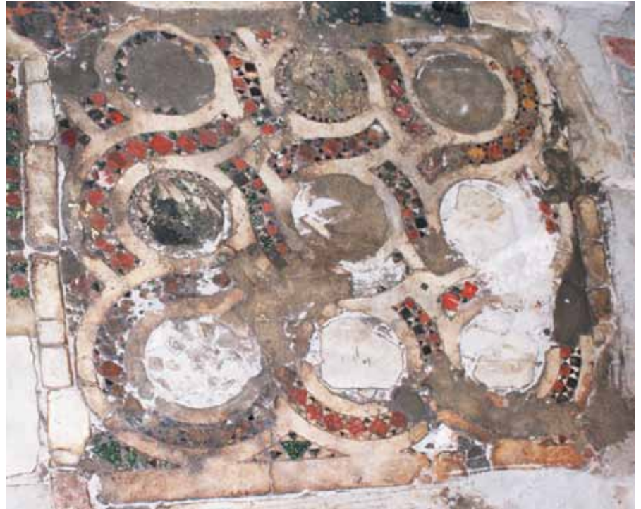
Resim 22 Büyük antrolac çerçeve

Haç tezyinatlı, kapıya doğru ters "L" yapan bordürün doğu-batı doğrultudaki parçasının kuzey bitişiğinde 122x128 cm ebatlarında, kareye yakın mermer bir çerçeve içerisinde kısmen deforme olmuş durumdadır (Resim. 23, çizim 2.4). Bu tezyinat, üç adedi seçilebilir durumda, 19 cm. çapında toplam dokuz adet yuvarlak plakanın çevresi, iki mermer şerit arasında eşkenar dörtgen ve araları siyah üçgen biçimli tesseralarla ilmek şeklinde sarılarak oluşturulmuştur. Plakaları sarı mermer şeritlerin kesişme noktalarında ve deseni kuşatan mermer çerçevenin köşelerinde üçgen biçimli doldurma motifleri (5 adedi seçilebiliyor) bulunmaktadır. Bunların da içleri kırmızı ve yeşil renkli üçgen taşlarla dizayn edilmiştir.