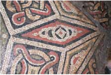
Resim 18 Kare Çerçevenin Köşelerindeki Baklava Motif