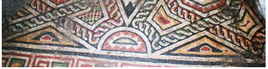
Resim 10 Doldurma Motifleri