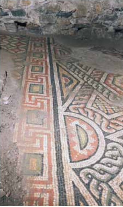
Resim 4 Meanderli bordür