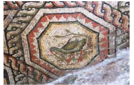
Resim 7 Kuş figürlü madalyon/Arma

Haç kollarının kesiştiği noktada 80 x 82 cm. boyutlarında yer alan sekizgen madalyonların içerisindeki kuş figürleri, merkezi dairedeki gibi ağaç dalları üzerine tünemiş olarak gösterilmiştir. Gerek kuş figürlerinde gerekse iç içe sekizgenlerde, kullanılan renkler merkezi dairedeki gibidir. Ancak bu iç içe sekizgenlerde kırmızı ve sarı renk arasına siyah konturlu yeşil renkli bir bant daha ilave edilmiş bu bandın dışına, kırmızı banda doğru beyaz renkli güneş ışınlarını simgeleyen radyal (piramidal) motifler işlenmiştir.