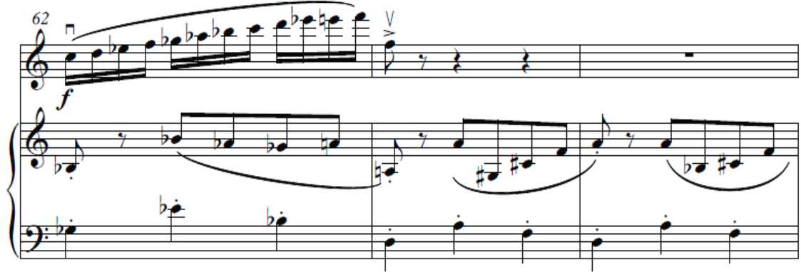
Şekil 8. İkinci Bölüm Köprü Ögesi (62-64) ölçüler

ölçü süren üçüncü a2 cümlesi gelir ve re minör tonundadır. Yine A bölümünde ikinci kez köprü gelir ve 58 ile 81. ölçüler arasındadır. Şekil 8’de görüldüğü gibi kromatik gamların hızlı çalımıyla oldukça etkileyici ve gerilimli bir hava yaratılmıştır.