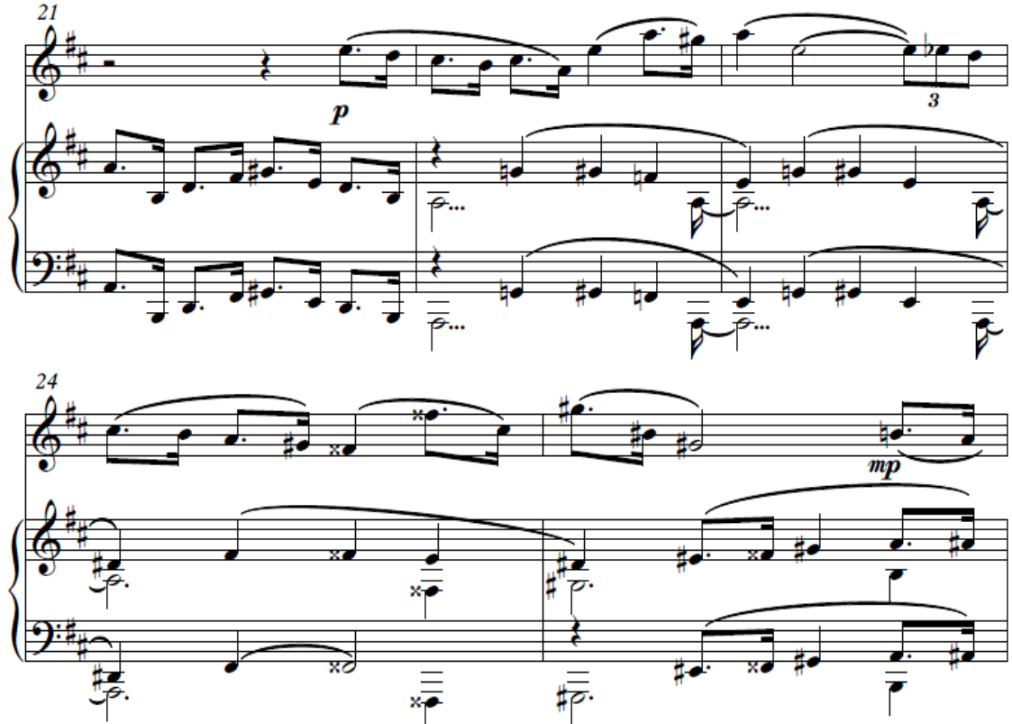
Şekil 2. Birinci Bölüm B Teması (21-25) ölçüler

Şekilde 2’de görüldüğü gibi B teması 20. ölçüde kendini göstermeye başlar ve 21. ölçüde ortaya çıkar. Sergi, gelişme ve codettası ile birlikte 41. ölçüde sona erer. B temasının girişi kendini belirgin şekilde hissettirse de A temasından çok uzakta değildir. Daha durgun bir yapıdadır. A temasında olan temanın ardından gelen farklı tondaki sekvensin olması gibi B temasında gelen iki ölçülük la majör giriş ardından gelen iki ölçü ise varyasyondur. Daha sonra sergi bölmesinin bitişi yine bir varyasyonla gelir ve la majör tonunda sona erer.