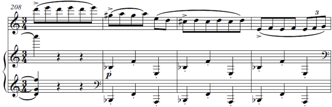
Şekil 11. İkinci Bölüm B Bölmesi Tekrarı (208-211) ölçüler

B bölümünün tekrarı ise 191 ile 201 ölçüleri arasındadır. Fakat şekil 11'deki gibi daha sonra gelen 202 ile 220. ölçülerdeki tekrarı daha farklı biçimlendirilmiştir.