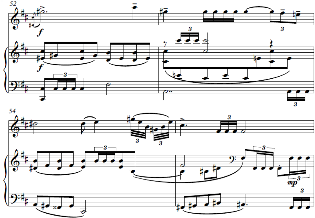
Şekil 4. Birinci Bölüm Gelişme Bölmesi İkinci Kesit, B Teması (52-55) ölçüler

Daha sonra şekil 4'teki gibi 52. ölçüde A temasına oldukça benzeyen bir melodik yapıya sahip olan gelişme bölmesinin a teması gelir. Fakat bölümün başında gelen temadan daha farklı olarak ilk iki ölçüden sonra B temasını andıran bir yapıya geçer. Keman partisinde gelen üçleme ve altılamalar kendini göstermektedir.