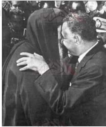
■ الرئيس جمال عبد الناصر يعانق البابا كيرلس السادس

Resim 6: 1952 devrim konseyi başkanı Muhammed Necip, Patrik II. Yousab'ı ziyaret ediyor.