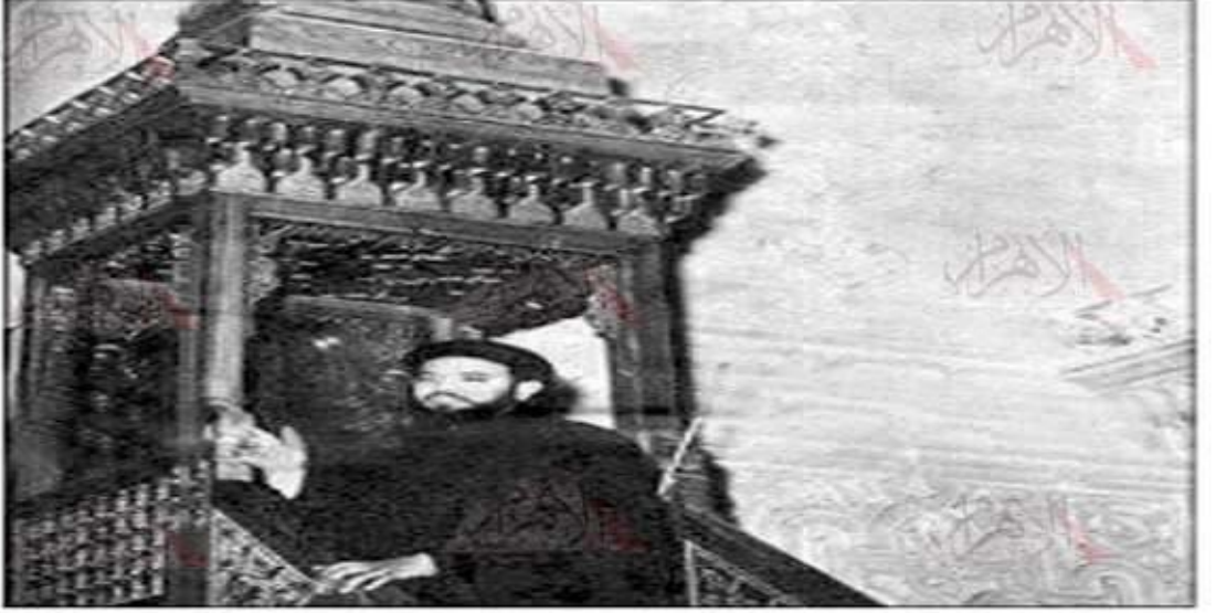
■ قس فوق منبر مسجد يطالب المصريين بالقتال ضد العدوان