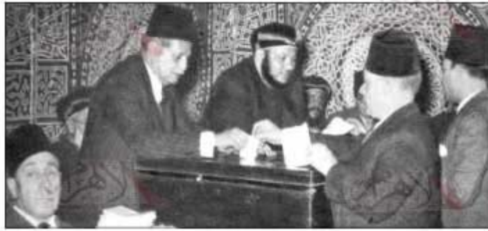
■ عملية انتخاب بابا جديد عام 1946