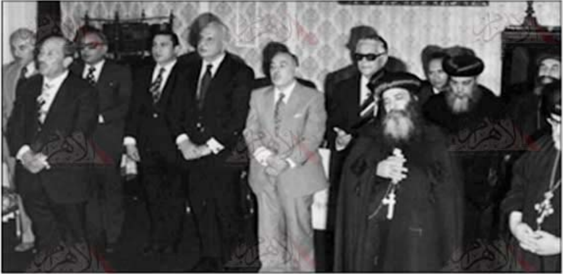
■ الرئيس السادات ونائبه مبارك ورجال الدولة والاتباء لشهوده والشمس كل يؤدى صلته فى مكان واحد