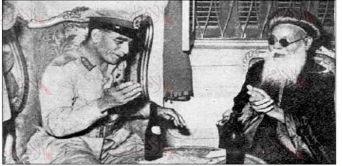
■ الرئيس محمد نجيب قائد مجلس الثورة يزور الانبا يوساب

Resim 6: 1952 devrim konseyi başkanı Muhammed Necip, Patrik II. Yousab'ı ziyaret ediyor.