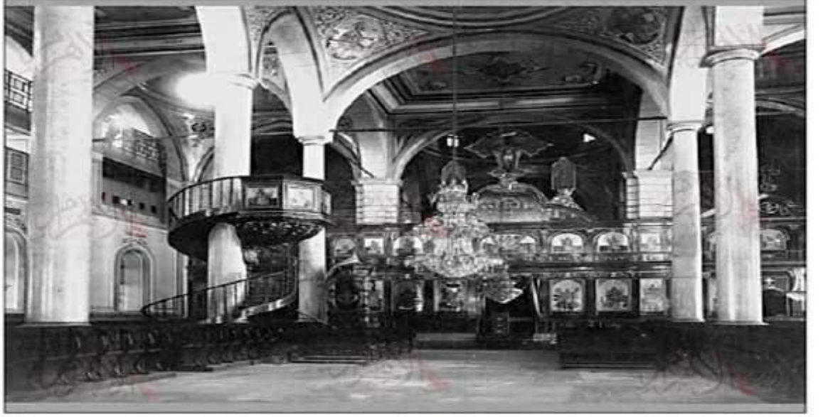
■ بهو الكاتدرائية القديمة التي تم بناؤها بأمر سلطاني ١٨٥٣ واكتملت في ١٨٨٩

Resim 1: Emr-i Sultan'i ile 1853 Yılında başlayıp 1889 yılında tamamlanan Eski Katedral'den bir görünüm.