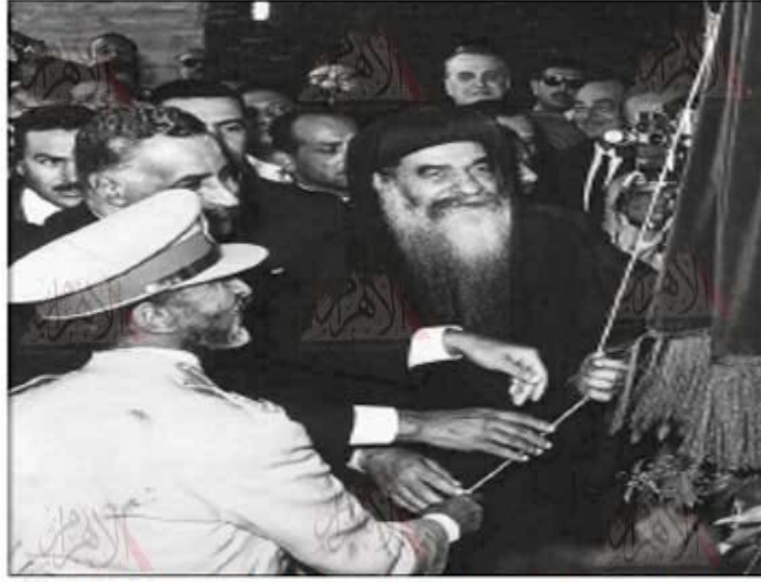
■ عبدالناصر وكيرلس وهيلد سلامسى اثناء افتتاح الكاتدرائية